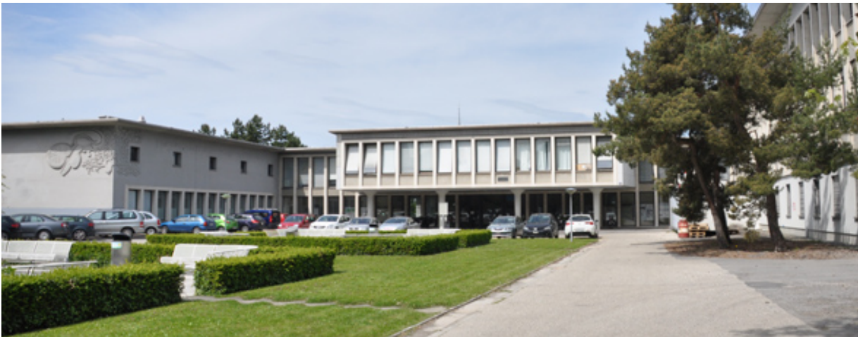
Le siège de l'ancien Institut de Biologie Cellulaire et de Morphologie (IBCM), Rue du Bugnon 9, 1005 Lausanne.

Pour plus d'informations sur les activités du DNF voir leur site