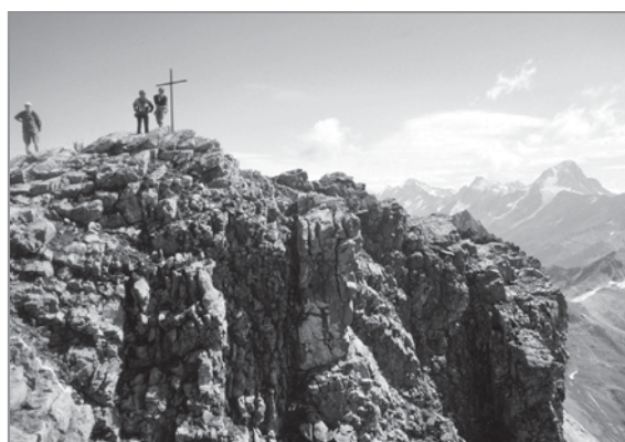
FIGURE 3 – (à droite) Le sommet du Torrenthorn et les falaises de la face sud.

espèces très rares sont toujours oubliées), il est important d'avoir des indications, mêmes grossières, de l'abondance respective des espèces. En plus, de telles estimations permettent un suivi plus fin des changements intervenus (ou futurs) sur le sommet. L'échelle à cinq niveaux de GRABHERR et al. (2001) a été utilisée: r! – l'espèce est très rare, un ou deux individus; r – rare; s – (comme scattered) dispersée, peu abondante; c – commune, fréquente; d – dominante. Des répartitions très hétérogènes peuvent être indiquées par une double valeur, complétée par un l , comme localement (par ex. r-lc – rare, mais localement abondante). Pour les espèces très rares, localement plus abondantes ou avec une répartition limitée à un secteur du sommet, l'estimation du recouvrement était complétée par des indications de localisation (face où elle est présente, altitude maximale par exemple). Ces données ne sont pas publiées ici, mais sont à disposition des intéressés auprès du premier auteur.