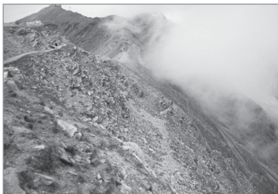
FIGURE 2 – (à gauche) La face sud du Gornergrat, un mélange de rochers, de fragments de pelouses et de plantes saxicoles. La part des pelouses augmente dans la partie basse, hors de la surface considérée dans cette étude.