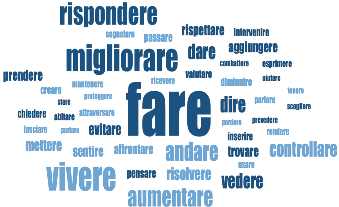
Fig. 1 – Nuvola dei verbi più frequentemente utilizzati nei commenti dei cittadini di Lugano. Esclusi verbi ausiliari e modali

I verbi all'infinito che compaiono con maggiore frequenza (oltre 20 volte) sono “fare”, “vivere”, “migliorare”, “rispondere”, “aumentare”, “andare” (Fig. 1).