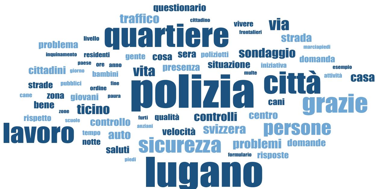
Fig. 2 – Nuvola dei sostantivi più frequentemente utilizzati nei commenti dei cittadini di Lugano

I sostantivi che appaiono con più frequenza (oltre 100 volte) sono nell'ordine quelli di “polizia”, “Lugano”, “quartiere”, “città”, “lavoro”, “grazie” e “sicurezza” (Fig. 2).