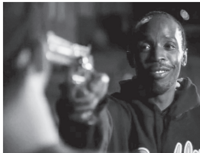
Omar : « Tout est dans le jeu »

Il existe de nombreuses versions du « jeu » dans The Wire . La police, le pouvoir municipal, les enseignants ou le business des journaux en sont tous des incarnations. Mais le jeu joué par ceux qui sont impliqués dans le trafic de drogue est assurément le plus meurtrier et le plus commenté. Les autres institutions n'appellent d'ailleurs pas leur jeu « le jeu ». Parce que les trafiquants se livrent à un jeu hors de la loi, ils ne peuvent pas y recourir lorsqu'eux-mêmes sont volés. Lorsqu'Omar Little prononce pour la première fois la phrase qui clôt la première saison, il tient un revolver pointé sur la tête d'un trafiquant de rue, faisant ce qu'il sait faire le mieux : voler de la drogue ou de l'argent aux trafiquants eux-mêmes. Il pouffe et dit : « Tout est dans le jeu, mec. Tout est dans le jeu » (saison 1, épisode 13,