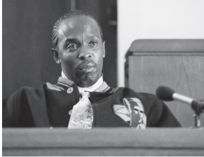
Omar au tribunal : « J'ai le fusil à pompe, vous avez la mallette. Mais tout ça fait partie du jeu, non ? »

nue Omar, puisque nous profitons tous deux du trafic de drogue ? La différence est bien évidemment que la vie d'Omar sera courte tandis que celle de Levy sera longue et prospère puisqu'il opère avec et à l'intérieur de la loi, plutôt que hors d'elle. Néanmoins, comme si souvent dans The Wire , la comparaison entre les actions et les motivations d'institutions diverses mène loin. Omar est comme Levy, mais comme le montre le spécialiste du droit Alafair Burke 12 , Omar profite également du trafic de drogue de manière comparable à celle de la police, accumulant des heures supplémentaires à l'occasion d'affaires de drogue importantes.