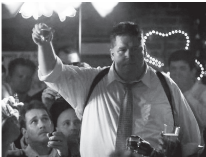
Deuil bruyant et public de la police

A la fin de la série, une autre veillée, «fausse» celle-là, est donnée au Kavanaugh Pub, pour la mort symbolique de Jimmy McNulty en tant que policier, tandis que la mort d'Omar, alors qu'il est abattu de façon inattendue dans une épicerie par le jeune dealer Kenard, ne fera l'objet d'aucun deuil et passera surtout inaperçue. Presque comme une pensée après coup, un médecin légiste remarquera qu'une fausse étiquette a été accrochée à son orteil. Ni la police ni Le Sun de Baltimore ne remarqueront l'importance de sa disparition (saison 5, épisode 8, «Clarifications»). Comme tous les autres Noirs qui meurent dans la série, de Wallace à D'Angelo Barksdale, de Stringer Bell à Bodie Braudus, Omar meurt de façon abrupte et violente. Alors que les Blancs ont le luxe de pouvoir pleurer leurs amis, et souvent, comme pour les dockers , paraissent faire le deuil de leurs privilèges perdus «à l'époque» de la démocratie libérale Keynésienne, les Noirs meurent sans avertissement et sans possibilité de deuil public; aucune occasion d'«être senti». Ceci ne signifie pas que