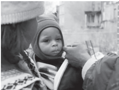
Omar caresse la joue du bébé

Dans cette même première saison (saison 1, épisode 6, « The Wire »), après qu'Avon a torturé Brandon puis exposé son corps mutilé sur le capot d'une voiture, il n'y a aucun doute qu'il s'agit là d'un message spécialement destiné à Omar, non seulement parce qu'il est queer mais parce qu'il a affiché son affection pour un autre homme en public. Omar accompagne ensuite McNulty chez le médecin légiste afin d'identifier le corps de Brandon. Cette scène magistrale permet à la fois de révéler et de se détourner de la douleur d'Omar lorsqu'elle atteint son plus haut degré.