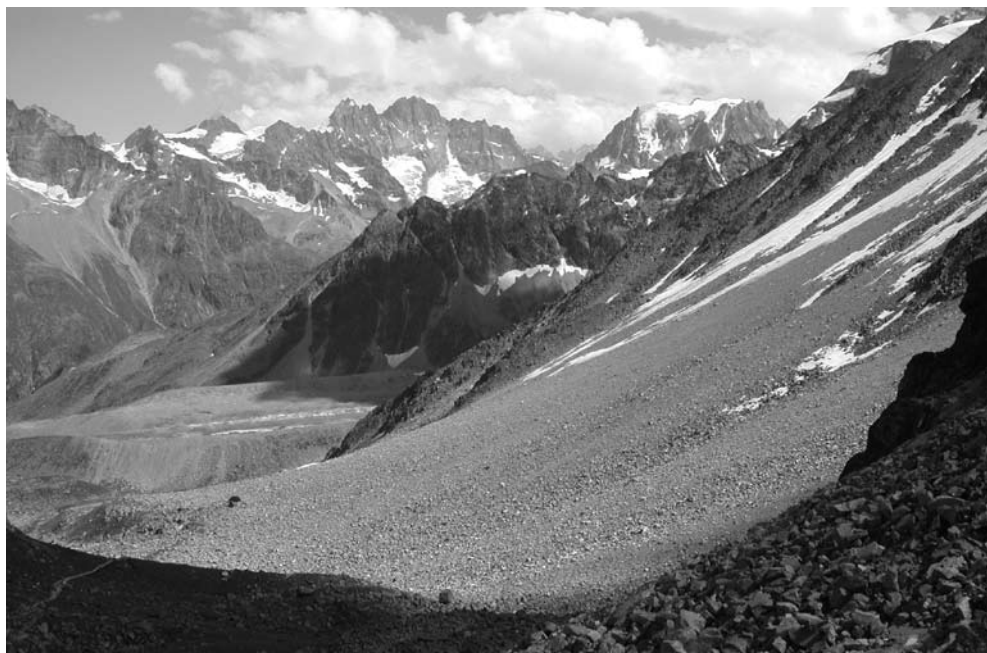
Figure 1. Vue latérale sur un éboulis typique de la zone périglaciaire alpine. Ici, l'éboulis de Isena Réfien, dans la région d'Arolla (exposition nord-est, altitude basale 2600 m).

fins. Cette stratigraphie est commune à de nombreux cas étudiés. Lorsque l'on s'élève dans la pente, la résistivité du niveau gelé tend à décroître. Une diminution de la teneur en glace (et/ou un réchauffement du terrain) en est vraisemblablement la cause. Le niveau gelé tend même à disparaître dans bien des cas. La décroissance des résistivités en direction de l'amont est illustrée par la figure 2, qui présente les résistivités apparentes mesurées à une profondeur d'environ 10 mètres, c'est-à-dire au sein du corps gelé.