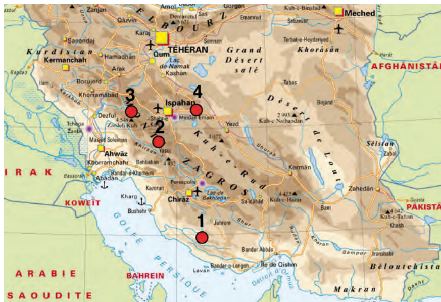
Carte d'Iran avec les localités étudiées: 1.) Kuh e Surmeh; 2.) Kuh e Dena; 3.) Zard Kuh; 4.) Shareza.

Les recherches engagées depuis bientôt 40 ans par le soussigné et ses collègues ont permis, grâce à la mise au point de nouvelles méthodes, de montrer de manière détaillée les changements apparus et enregistrés dans les couches de la limite de l'ère Primaire à l'ère Secondaire de diffé-