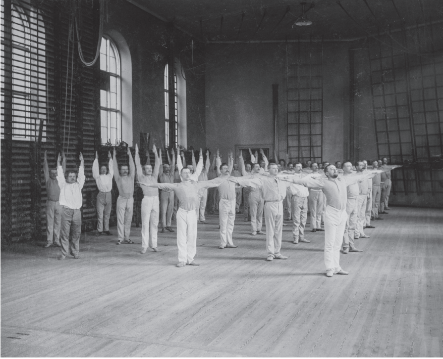
Figure 2. Pratique de la gymnastique à l'Institut central royal de gymnastique (1900) 45 .

l'utilité reste vague ou semble dénuée de sens, doivent être supprimés. Il souligne également l'importance de la précision et affirme qu'il n'y a qu'une seule façon d'exécuter correctement un mouvement. À cet égard, Hjalmar Ling promet un type d'éducation physique qui met l'accent sur la forme du mouvement plutôt que sur l'habileté de l'élève 46 . En mettant l'accent sur un mouvement scientifique, correct et précis, on peut lui reprocher, comme à son père, de promouvoir des exercices rigides, répétitifs et restrictifs (figure 2) 47 .