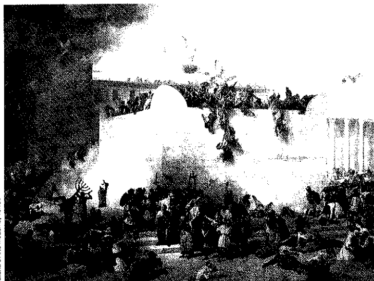
Galleria d'Arte Moderna, Venise

≈ -620 : le roi Josias entreprend une réforme politique et cultuelle qui fait de Jérusalem le seul lieu de culte légitime, et du dieu Yahvé, vénéré à Jérusalem, le dieu Yhwh « UN ». Cette réforme n'est pas monothéiste, mais « monolâtrique ». On ne nie pas l'existence des autres dieux, on interdit leur vénération.