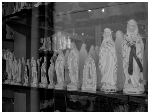
Fig. 1.