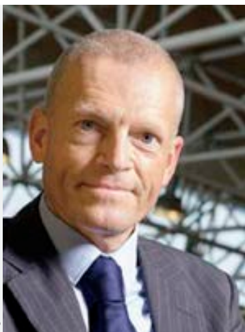
Andreas R. Ziegler

est professeur de droit international à l'Université de Lausanne. Menant des recherches approfondies sur les droits LGBTI ( https://www.unil.ch/dip/home/menuguid/droit-lgbti.html ), il est membre de l' European Commission on Sexual Orientation Law et figure sur la liste d'experts du Conseil de l'Europe ( Sexual Orientation and Gender Identity ).