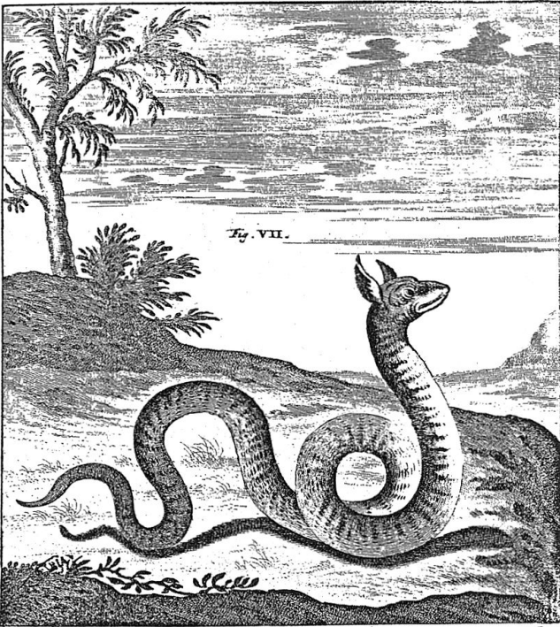
Ein Drachen der Alpen (in: Johann Jakob Scheuchzer: Οὐρεσφοίτης Helveticus sive Itinera per Helvetiae alpinas regiones facta annis 1702–1707, 1709–1711, 4 Bde., Lugduni Batavorum 1723, Bd. 1, Taf. VIII).

Die Berichte und die Beobachtungen seiner Reisen in die Alpen stellte der Zürcher Wissenschaftler u.a. in den Itinera Alpina und in der dreibändigen Natur-Historie des Schweitzerlandes (Zürich, 1716–1718) dar, wo er sich mit den Grenzen und der Beschaffenheit der Berge, den Wasserläufen, den atmosphärischen Phänomenen, den Mineralien, den Fossilien usw. befasste. 9