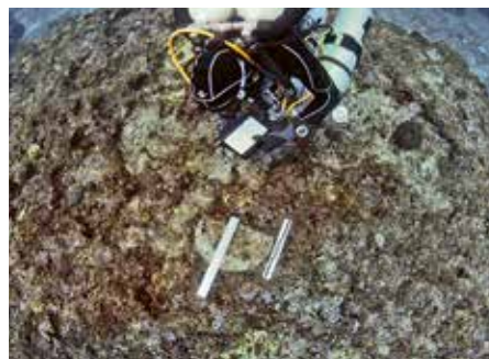
Υποβρύχια έρευνα 2021 – 2021 underwater survey.

Το σημείο του ναυαγίου, τα όρια του οποίου είναι προσδιορισμένα σε αρκετά ικανοποιητικό βαθμό, βρίσκεται στους πρόποδες μιας απότομης βραχώδους πλαγιάς που εκτείνεται από 20 έως 50 μ. από την ακτή, και φθάνει σε βάθος 45 μ. κάτω από την επιφάνεια. Στους πρόποδες αυτής της πλαγιάς βρίσκεται ένα αμμώδες οροπέδιο περίπου 70 × 50 μ., στο οποίο έχουν εντοπιστεί και ανασκαφεί σε μικρά τμήματα, κατά τη διάρκεια προηγούμενων αποστολών, αρκετά σημεία ιδιαίτερου ενδιαφέροντος. Ο στόχος της πρώτης Ελληνο-ελβετικής εκστρατείας, η οποία πραγματοποιήθηκε στις αρχές του Οκτωβρίου 2021, ήταν η έρευνα της περιοχής με μια μικρή ομάδα εξειδικευμένων δυτών