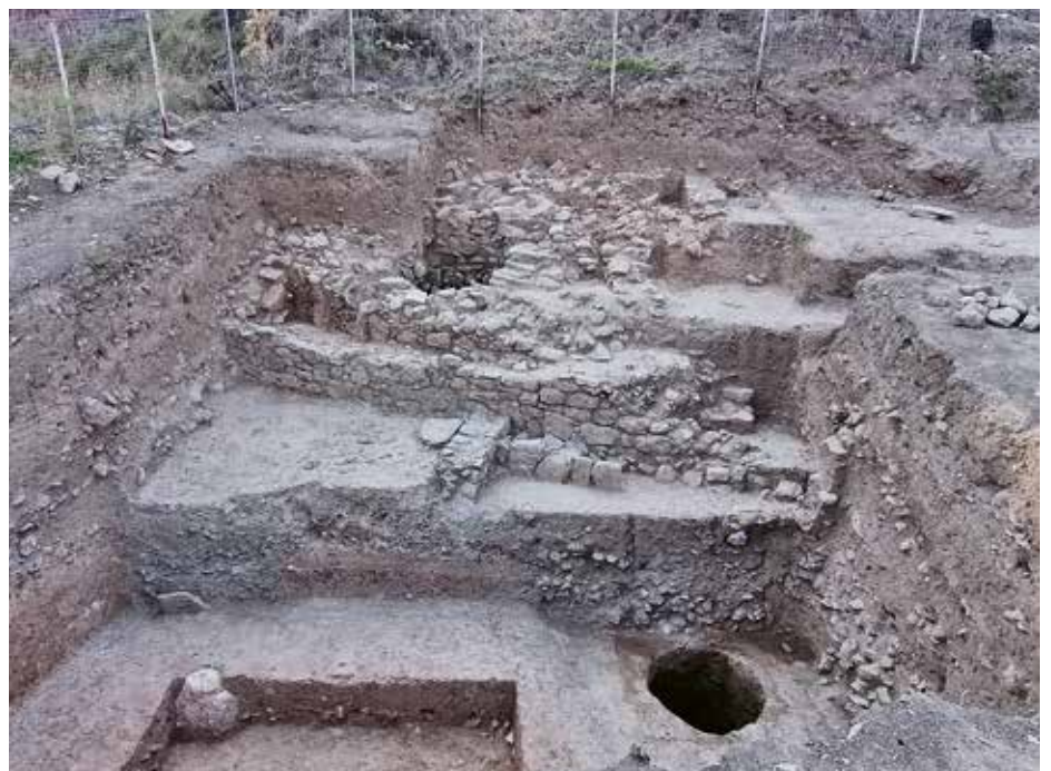
Πηγάδια και τοίχοι της Πρώιμης Εποχής του Χαλκού μέσα σε δοκιμαστική τομή στους πρόποδες του λόφου. Early Bronze Age wells and walls in a trench at the foot of the hill.