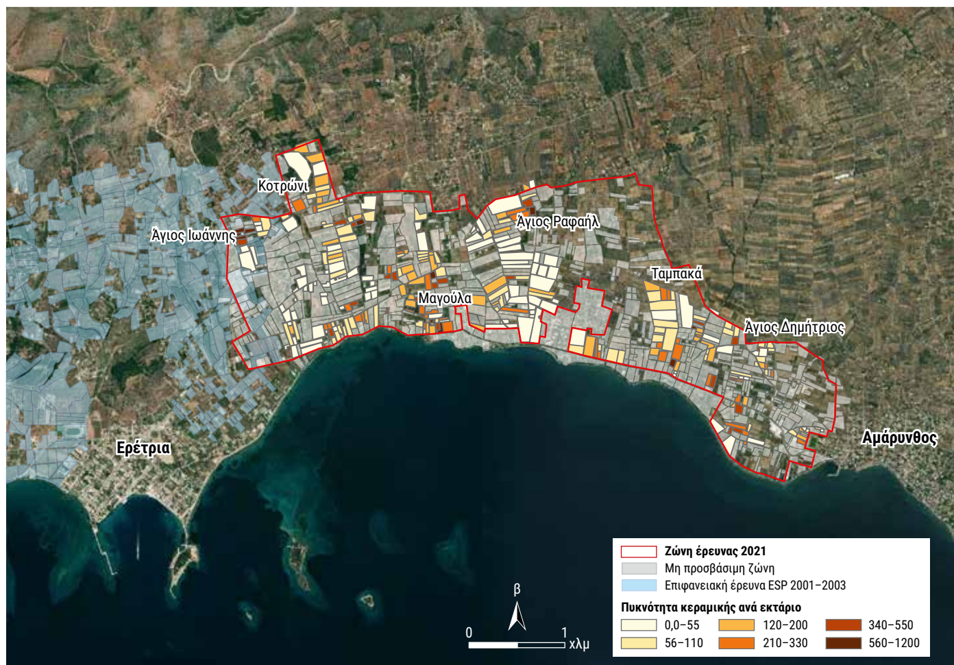
Επιφανειακή έρευνα μεταξύ Ερέτριας και Αμαρύνθου, 2021 — Survey between Eretria and Amarynthos, 2021.

κατοίκηση της περιοχής σε αυτές τις περιόδους. Η τάση αυτή δεν φαίνεται να αντιστρέφεται στην Πρώιμη Εποχή του Σιδήρου, καθώς στην περιοχή της έρευνας του 2021 δεν βρέθηκαν θέσεις της περιόδου αυτής.