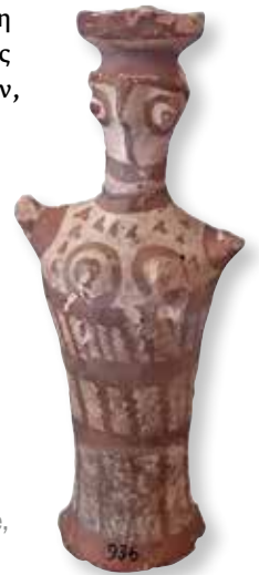
Πήλινο ειδώλιο Μυκηναϊκής περιόδου, ανασκαφή της δεκαετίας 1930. Mycenaean terracotta figurine, excavation of the 1930s.

εντατικότερα από ότι στη σύγχρονη εποχή, όπως δείχνουν, μεταξύ άλλων, μια δεύτερη Υστερομυκηναϊκή οχύρωση (Μεγάλη Κορυφή), ένα "Δρακόσπιτο", πολλές βαθμιδωτές ξερολιθιές και δεξαμενές (σουβάλες).