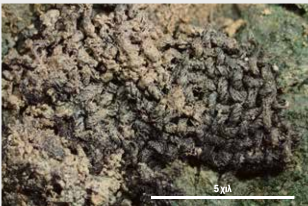
Τμήματα υφασμάτων διατηρημένα πάνω σε χάλκινο αντικείμενο που βρέθηκε στο Αρτεμίσιο της Αμάρυνθου — Fabrics preserved on a bronze object found in the Artemision of Amarynthos.

Μέρος του καταλόγου των ενδυμάτων που αφιερώθηκαν στην Βραυρώνα Αρτεμίδα κατά τη διάρκεια του έτους 345–344 π.Χ. (IG II 2 1514, 34–59).