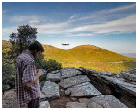
Πάλλη-Λάκκα, αποτύπωση του Δρακόσπιτου μέσω drone — Palli-Lakka, drone survey of the Drakospito.

The excavation of the Artemision has been extended by a survey project starting this year, which aims at clarifying the sanctuary's position within the ancient landscape. Despite the intensive urbanisation of the region, more than 300 plots of land, spread over an area of 12 km 2 , were surveyed to the east of Eretria. Several ancient settlements, burial plots as well as evidence of the sacred road connecting Eretria to the Artemision were located and documented.