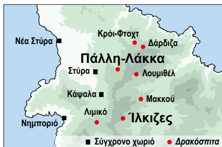
Τοποθεσίες των Δρακόσπιτων γύρω από τα Στύρα. Map of the "dragon houses" around Styra.

Το Ελληνο-Ελβετικό ερευνητικό πρόγραμμα των Δρακόσπιτων στην περιοχή των Στύρων έχει ως στόχο να παράσχει νέα χρονολογικά και λειτουργικά στοιχεία για τα αιγιματικά αυτά κτίρια. Οι εργασίες το 2021 επικεντρώθηκαν στην ανασκαφή του Δρακόσπιτου στη θέση Ίλκιζες και στην σχεδιαστική αποτύπωση του συγκροτήματος στην θέση Πάλλη-Λάκκα.