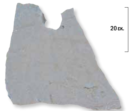
Λίθνη άγκυρα της Εποχής του Χαλκού. Bronze Age stone anchor.

χρονολογικά επάλληλοι τοίχοι της Πρώιμης Εποχής του Χαλκού ακολουθούν την πορεία της πλαγιάς. Μόνον περαιτέρω έρευνες θα καταδείξουν εάν επρόκειτο για οχύρωση,