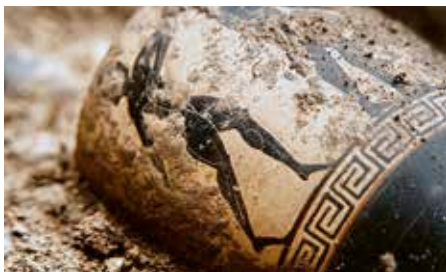
Αμάρυνθος, μελανόμορφη λήκυθος λευκού βάθους. Amarynthos, white-ground black-figure lekythos.

Στην Αμάρυνθο, η ανασκαφική περίοδος του 2021 επέτρεψε την αποσαφήνιση της κάτοψης και των διαφορετικών φάσεων του ναού της Αρτέμιδος. Επίσης, ο αποθέτης της Ύστερης Αρχαϊκής εποχής που είχε αποκαλυφθεί το 2020 ανασκάφηκε σχεδόν πλήρως. Λόγω της εξαιρετικής κατάστασης διατήρησής του αλλά και του μεγάλου πλούτου του, η ανακάλυψη αυτή βρίσκεται ανάμεσα στις πιο εντυπωσιακές που έχουν γίνει τα τελευταία χρόνια στον Ελλαδικό χώρο και έχει προσελκύσει το ενδιαφέρον των Ελβετικών και Ελληνικών μέσων ενημέρωσης.