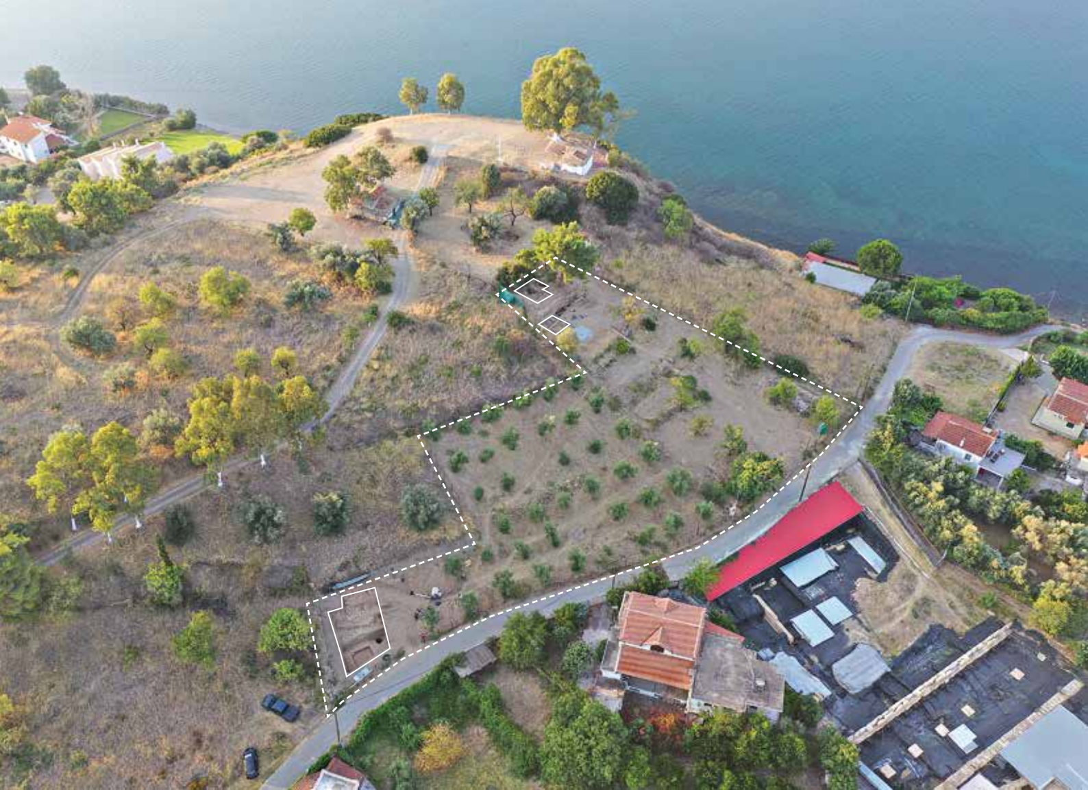
Φωτογραφία με drone του λόφου των Παλαιοεκκλησιών με τους δύο τομείς που ερευνήθηκαν το 2021 — Drone photo of Paleoeckklisies hill and the 2021 trenches.

η οποία προστάτευε αυτή την πλευρά του λόφου. Ομοίως, μπροστά από τους δύο αυτούς τοίχους, βρέθηκε μία λίθινη άγκυρα, ένδειξη της σπουδαιότητας της ναυσιπλοΐας της Εποχής του Χαλκού κατά μήκος του Ευβοϊκού κόλπου. Ποικίλα ευρήματα μαρτυρούν επαφές με τις Κυκλάδες ήδη κατά την 3η χιλιετία π.Χ., όπως έχει διαπιστωθεί και για άλλες αρχαιολογικές θέσεις στην Εύβοια. Δύο πηγάδια αποκαλύφθηκαν επίσης στον ίδιο τομέα. Για λόγους ασφαλείας, μόνο τα ανώτερα δύο-τρία μέτρα της επίχωσης τους ανασκάφηκαν. Και τα δύο εμπεριείχαν αποκλειστικά προϊστορική κεραμική.