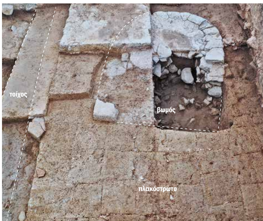
Ο Αρχαϊκός βωμός (11) με το πλακόστρωτο από ωμόπλινθους. The Archaic altar with the mud-brick floor.

Ο βωμός, ο οποίος δεν γνωρίζουμε ακόμη πότε κατασκευάστηκε, παρέμεινε σίγουρα σε χρήση για μεγάλο χρονικό διάστημα, ιδίως σε συνδυασμό με τον ναό 14. Στη συνέχεια, διατηρήθηκε προσωρινά κατά την κατασκευή του κτιρίου 6, πριν να εξαφανιστεί κάτω από τις επιχώσεις, και ίσως και την βάση της κεντρικής κιονοστοιχίας του κτιρίου, η οποία δεν διασώζεται. Απέναντι από τον τελευταίο ναό, χτίστηκε ένας νέος βωμός (11).