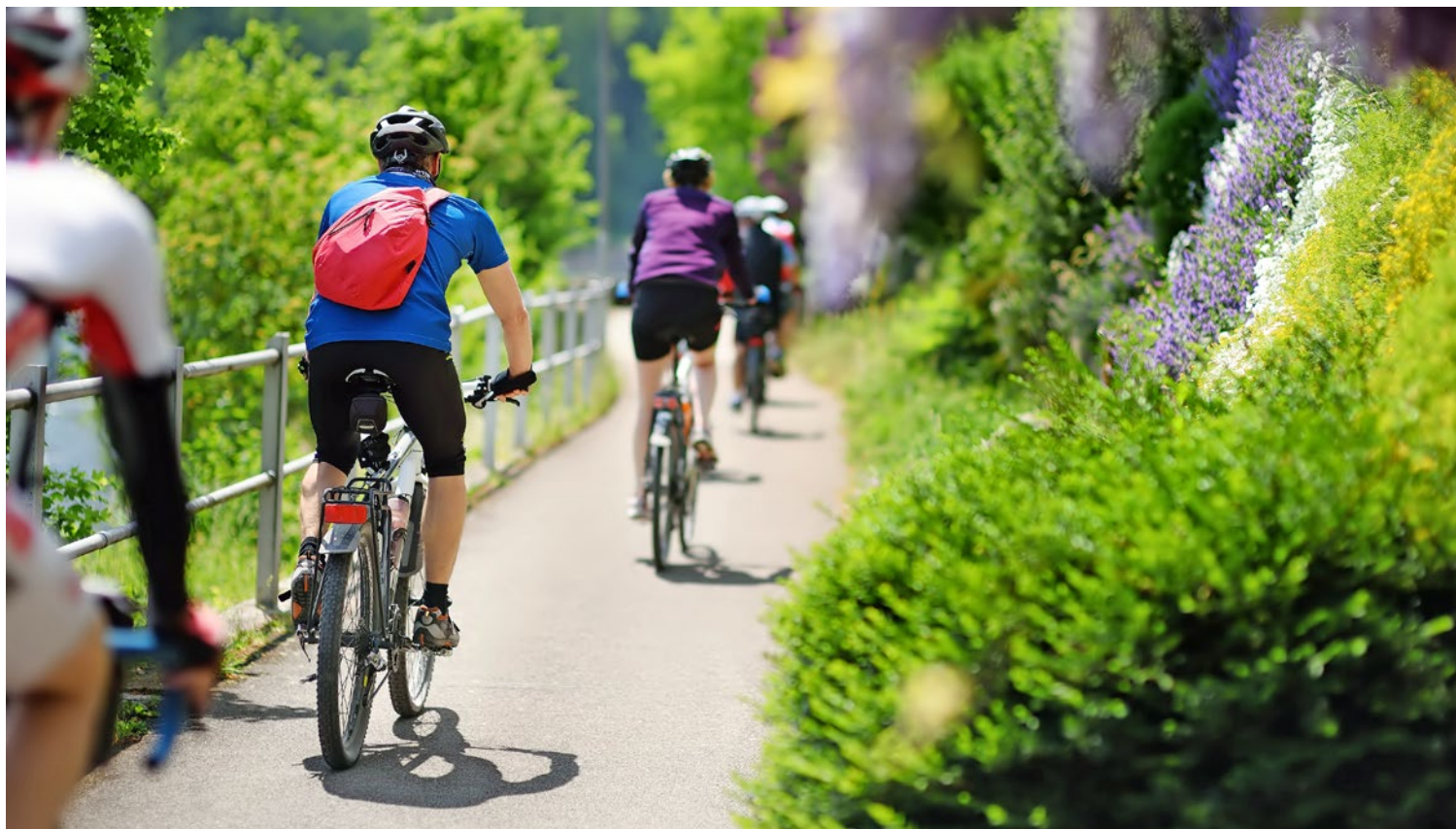
Velofahren ist nicht nur gesund und umweltfreundlich, sondern auch flächensparend und günstig.