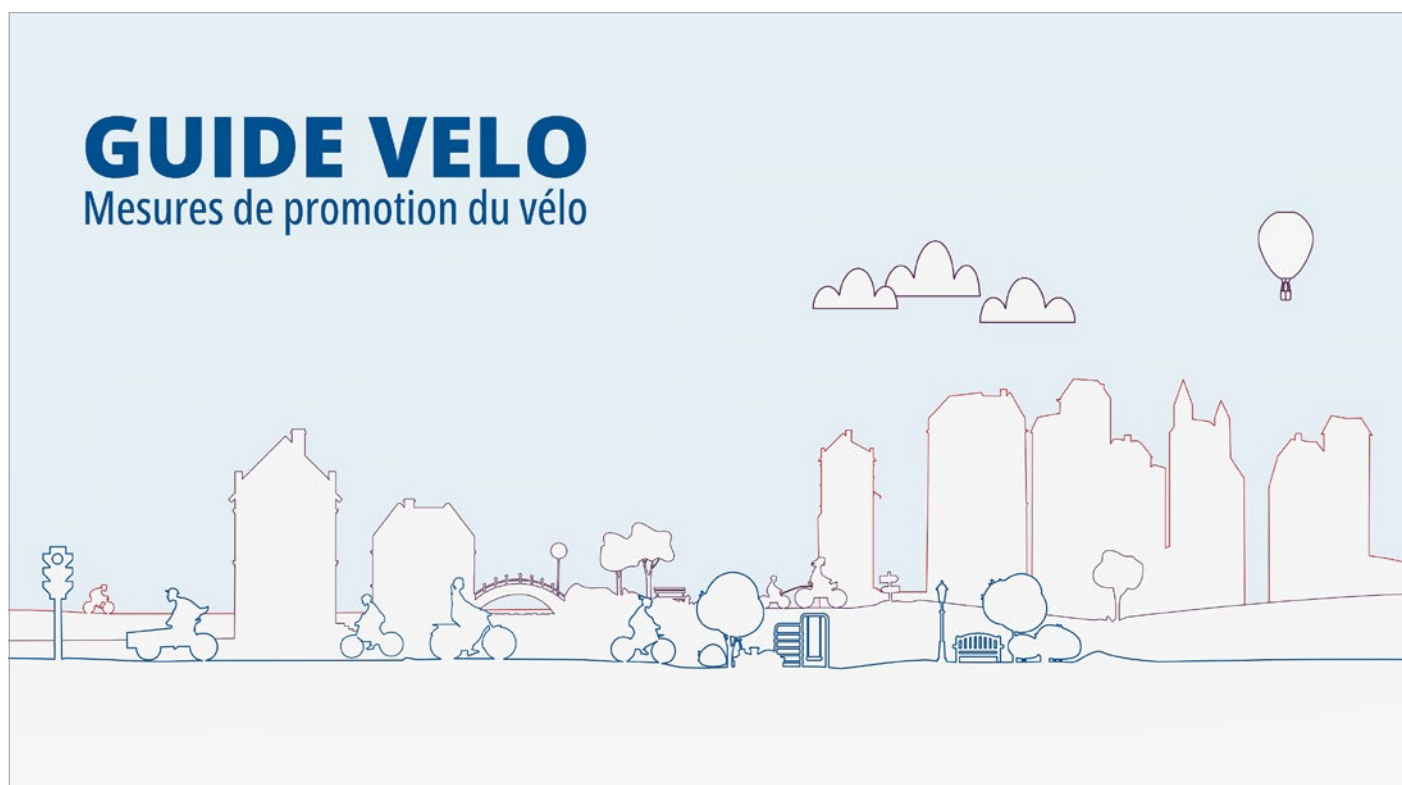
Un nouveau guide montre aux communes comment encourager la pratique du vélo.

Ensuite, le guide met l'accent sur la grande diversité des cyclistes et des types de vélos. Il fait notamment référé-