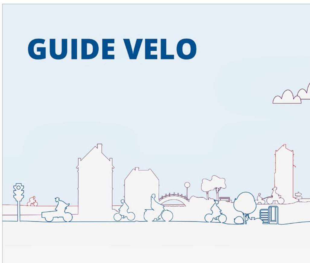
Una nuova guida mostra ai comuni come promuovere la mobilità ciclistica.

Per promuovere l'uso della bicicletta è necessario un «sistema ciclistico», quindi occorre pensare in modo olistico e agire sia sui ciclisti, sia sull'idoneità del territorio che li accoglie (ciclabilità). A tal fine, la guida suggerisce una serie