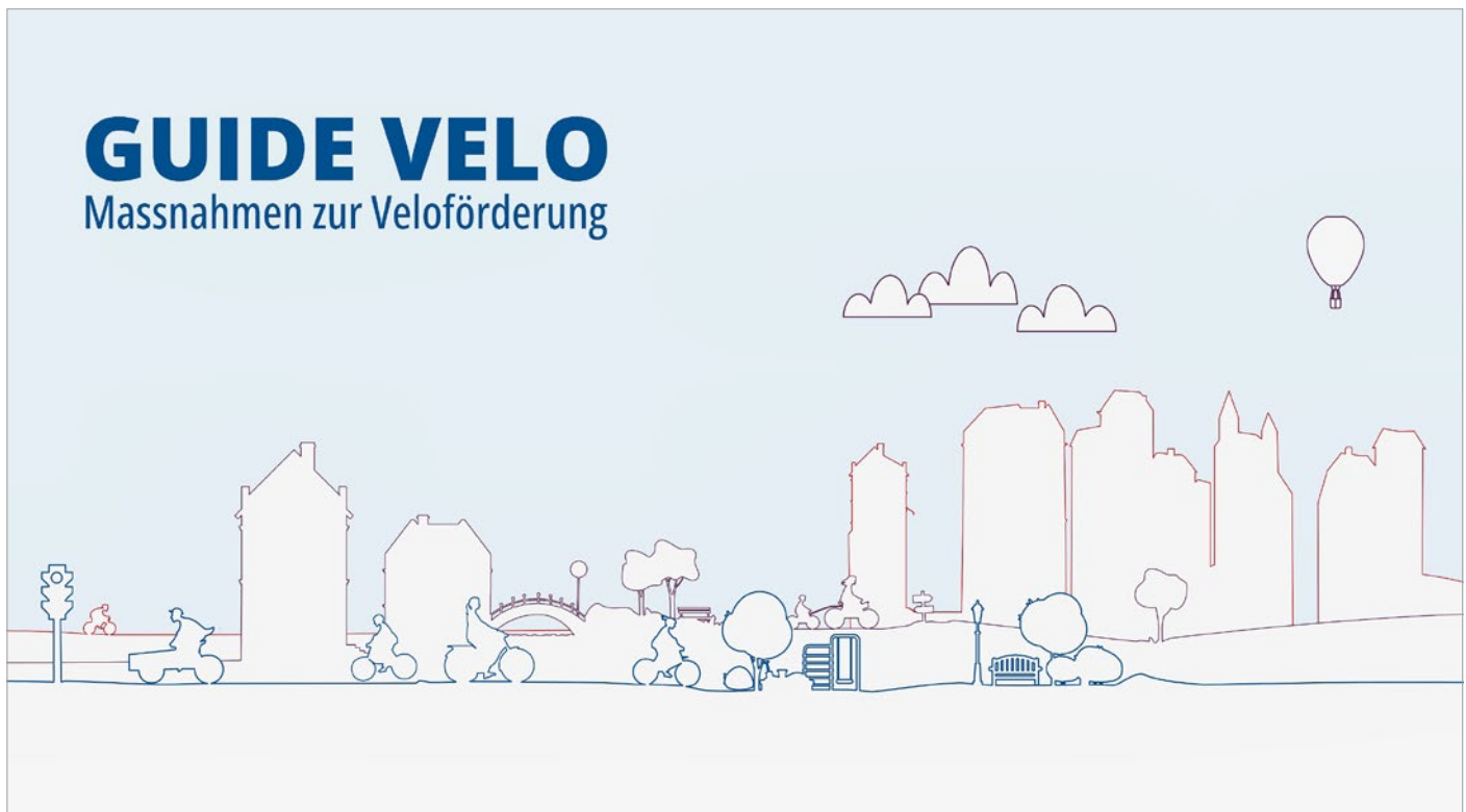
Ein neuer Leitfaden zeigt Gemeinden auf, wie das Velofahren gefördert werden kann.

Eine neue Onlineplattform unterstützt Gemeinden bei der Veloförderung. Sie beschreibt, wie ein Gebiet velofreundlich gestaltet und wie das Velofahren in den verschiedenen Bevölkerungsgruppen gestärkt werden kann.