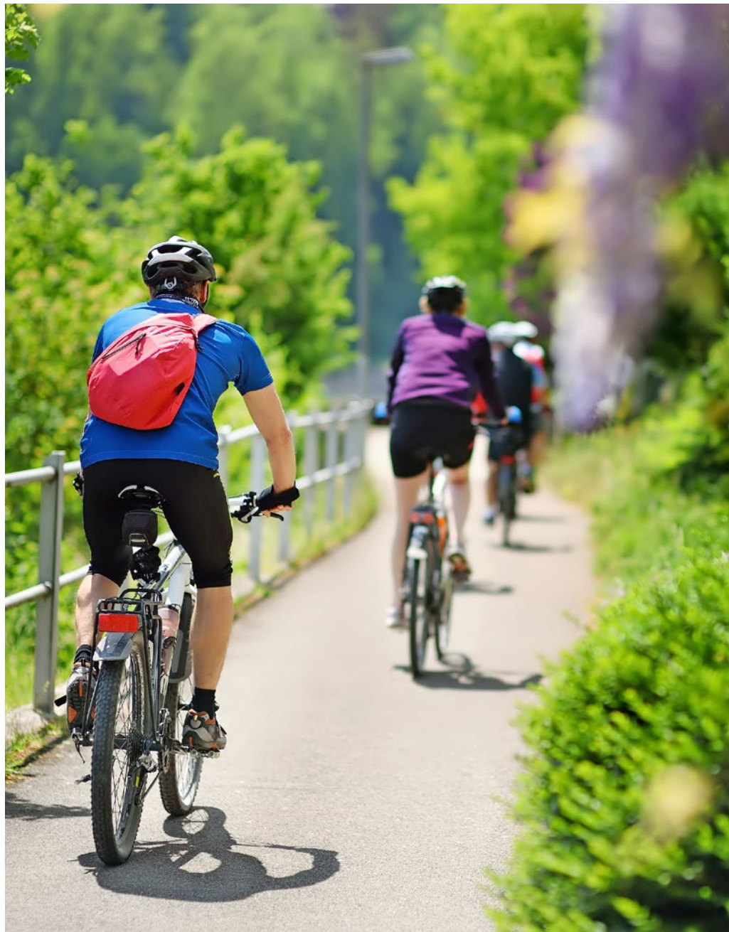
La bicicletta ha molti vantaggi: è silenziosa, salutare, ecologica, poco ingombrante ed economica.

La prima serie di schede riguarda le infrastrutture e la pianificazione. L'obiettivo di queste misure è rendere il territorio a misura di bicicletta e garantire che i percorsi siano diretti, collegati in una rete, sicuri, confortevoli e attraenti. In particolare, riguardano i diversi tipi di percorsi, i limiti di velocità, la gestione delle biciclette agli incroci, nonché i parcheggi, la segnaletica e la gestione delle biciclette durante i lavori stradali. Una seconda serie di misure riguarda la comunicazione, la formazione, la prevenzione e la promozione. Queste misure dovrebbero rendere visibili i miglioramenti dei percorsi ciclabili, legittimare la bicicletta come mezzo di trasporto e incoraggiare le