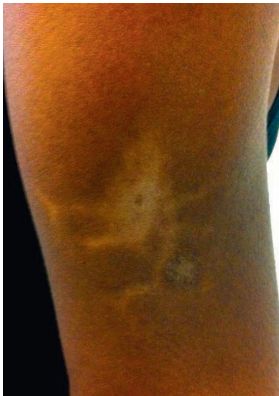
Figure 1: Epaule gauche avec atrophie et hypopigmentation linéaire en étoile trois mois après l'injection.

Une aide-soignante de 45 ans d'origine africaine, en bonne santé habituelle, Body Mass Index (BMI) 21 kg/m 2 , se présente pour une vaccination de rappel contre l'hépatite B en raison d'un titre d'anticorps insuffisant. Une dose de vaccin Engerix B ® , lui est administrée au niveau du muscle deltoïde gauche antéro-proximale-ment à une cicatrice laissée par un vaccin contre le bacille de Calmette et Guérin (BCG). Pour rappel, le vaccin contre l'hépatite B comprend les constituants suivants listés par le fabricant: 20 µg d'antigène de surface du virus de l'hépatite B (AgHBs), hydroxyde d'aluminium, chlorure de sodium, phosphate disodique, dihydrogénophosphate de sodium et eau.