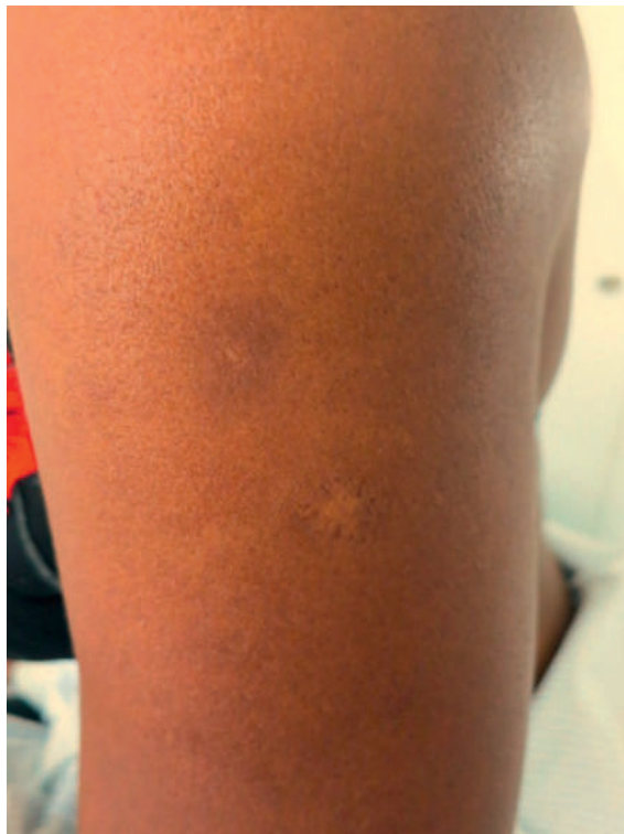
Figure 3: Epaule gauche avec discrète hyperpigmentation cutanée autour du point d'inoculation neuf mois après l'injection.

orteil [9], ainsi que dans la capsule articulaire interphalangienne [10] ou d'un genou [11] dans des cas de poly-arthrite rhumatoïde, ou encore dans la capsule de Tenon dans le cadre d'une maladie de Behçet [12], ceci déjà à partir d'une dose de 1 mg en ce qui concerne la triamcinolone [4].