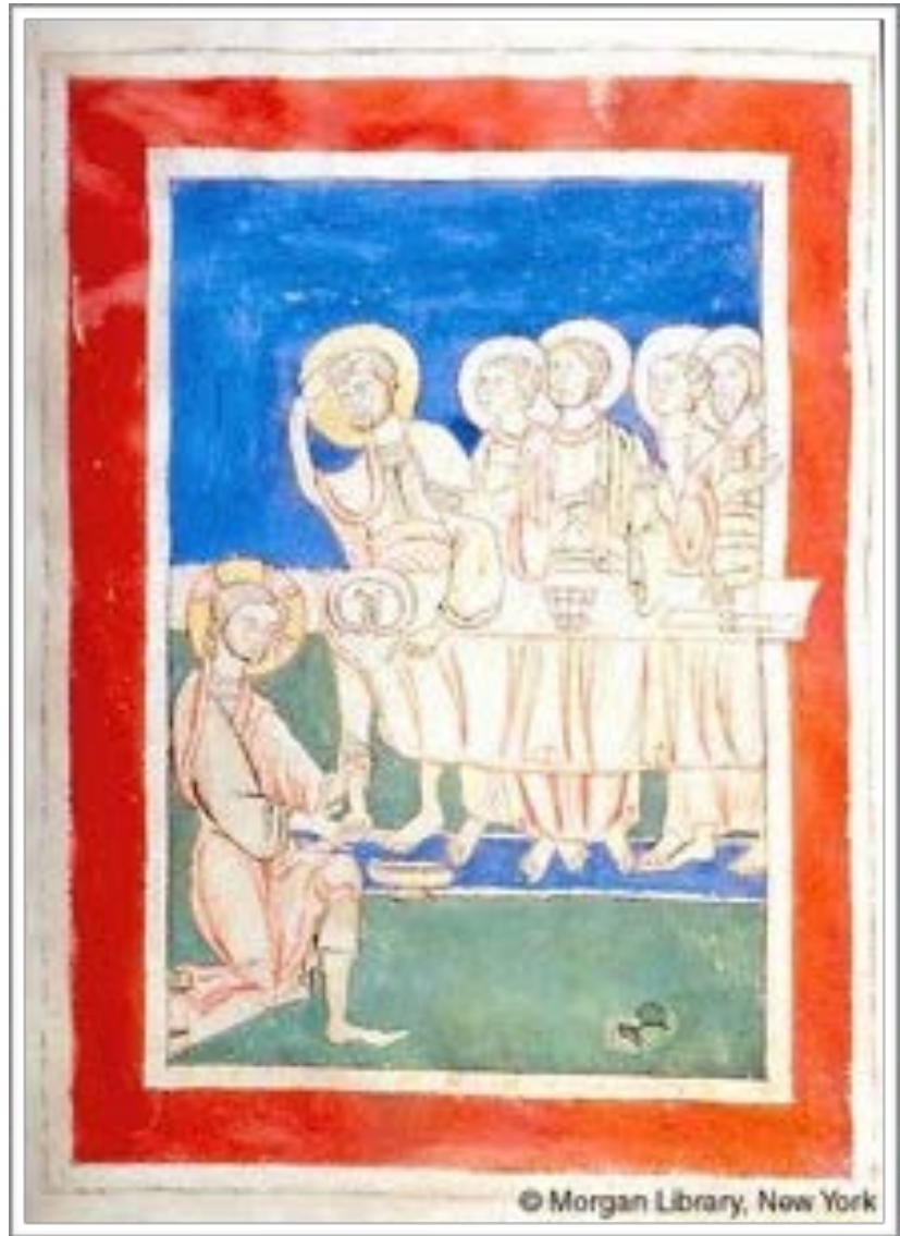
“Lavement des pieds” (Souabe: 1175-1199; psautier; Pierpont Morgan Library and Museum: Ms. M.0645, fol. 4v)

Lors de son dernier repas, Jésus, après avoir mangé un bretzel, lave les pieds de ses disciples pour leur signifier que le maître est au service de ses disciples. (Évangile de Jean, chapitre 13)