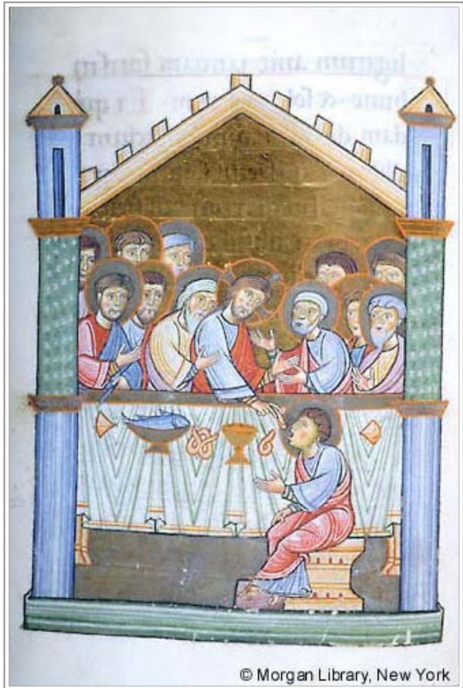
Salzburg – 1060/80 – Évangélaire (New York: Pierpont Morgan Library and Museum: Ms. M.0780, fol. 027v)