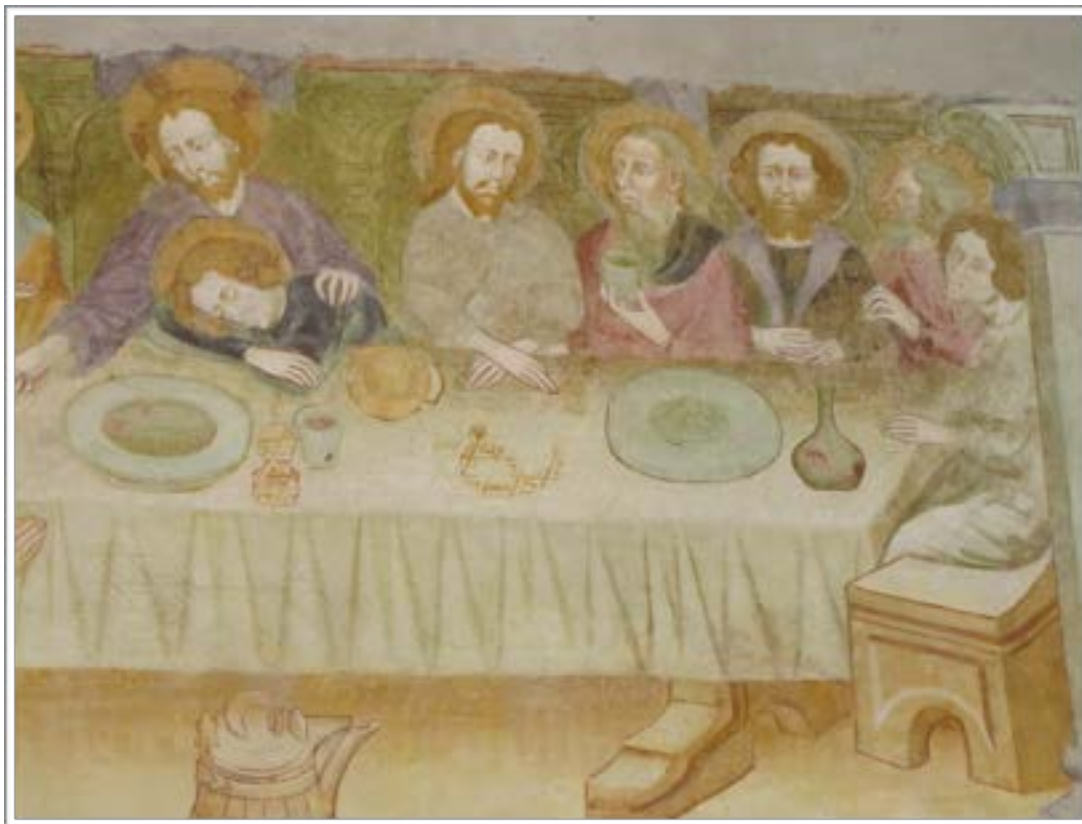
Fresque (1420-1430). Tramin-an-der-Weinstrasse: église San Valentino

Je vais pour rapporter la clef à l'office du tourisme quand, à ma grande surprise, je reconnais l'homme au chapeau noir qui sort de l'église paroissiale. Il a donc assisté à la messe! Voilà une nouvelle donnée que je dois intégrer. Se pourrait-il qu'il soit catholique? Voilà qui changerait ma perspective! Serait-ce alors l'Église catholique qui s'intéresserait à ma recherche? Serait-ce alors le Vatican qui me ferait suivre? Enfin, je commence à y voir plus clair. Je sais peut-être « qui? ». Il me faut maintenant savoir « pourquoi? ».