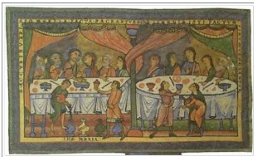
Noces de Cana (Sud-Ouest de l'Allemagne: 1166-1199; Bible manuscrite. Cod. Bibl. Fol. 60, 37rb)

Lors d'un repas, la reine Esther, après avoir mangé un bretzel, obtient de son mari Assuérus, le roi de Perse qu'il épargne le peuple juif qu'il voulait exterminer. (Esther, chapitre 7)