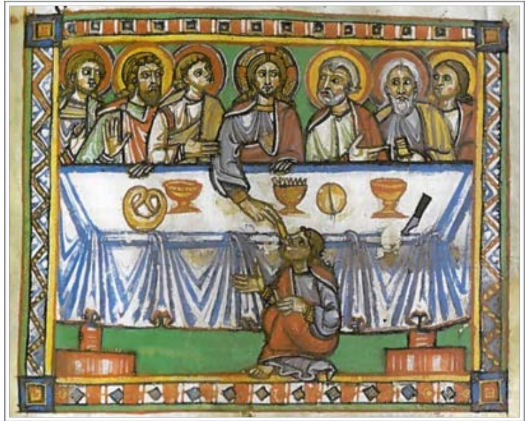
? – 1175/99 – Bible moralisée (Sankt-Florian, Autriche: Abbaye; Stiftsbibliothek: Cod III 208, fol. 156r)