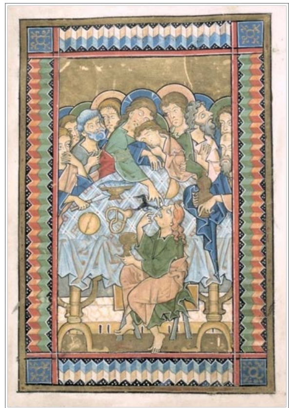
Würzburg – vers 1255/60 – Psautier de Würzburg (Melk, Autriche: Benediktinerstiftes: Psalterium Codex 1903, folio 11v)