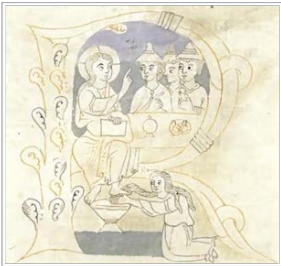
“Onction de Jésus” (12e siècle; Gumbertus Bibel; Universitätsbibliothek Erlangen-Nürnberg: Ms. 1, 355 v)

Lors d’un repas peut-être à Béthanie, peut-être chez un certain Simon qui était peut-être lépreux ou peut-être pharisien, une femme, qui était peut-être Marie, verse du parfum de grand prix sur les pieds, ou peut-être sur la tête, de Jésus qui vient de manger un bretzel. (Évangiles de Matthieu, chapitre 26, de Marc, chapitre 14, de Luc, chapitre 7, de Jean, chapitre 12).