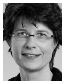
Ursula Zybach SP, BE, Nationalrat Geschäftsleitungsmitglied Krebsliga Schweiz Präsidentin Public Health Schweiz und Präsidentin der Schweizerischen Stiftung zur Förderung des Stillens