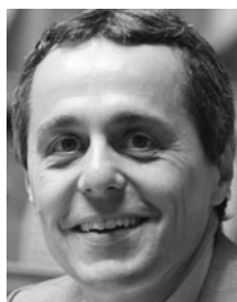
Ignazio Cassis I liberali-radicali, TI, Consiglio Nazionale Vicepresidente FMH Membro della Commissione sicurezza sociale e sanità del CN Presidente di Fourchette verte TI

Wir stellen sie in diesem Newsletter kurz mit Partei, Kanton, dem Rat für den sie kandidieren, Beruf und ihren Aktivitäten im Bereich Public Health vor.