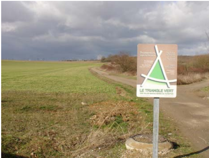
Illustration 2 : Panneaux de sensibilisation marquant l'entrée dans les espaces ruraux du Triangle vert.