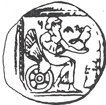
Fig. 4 Image de Yhwh sur une monnaie de l'époque perse ?