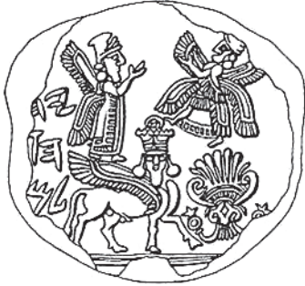
Fig. 2 Yhwh et la « reine du ciel » sur un sceau d'époque assyrienne ?