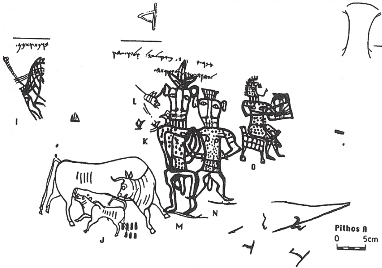
Fig. 1 Graffiti de Kuntillet Ajrud