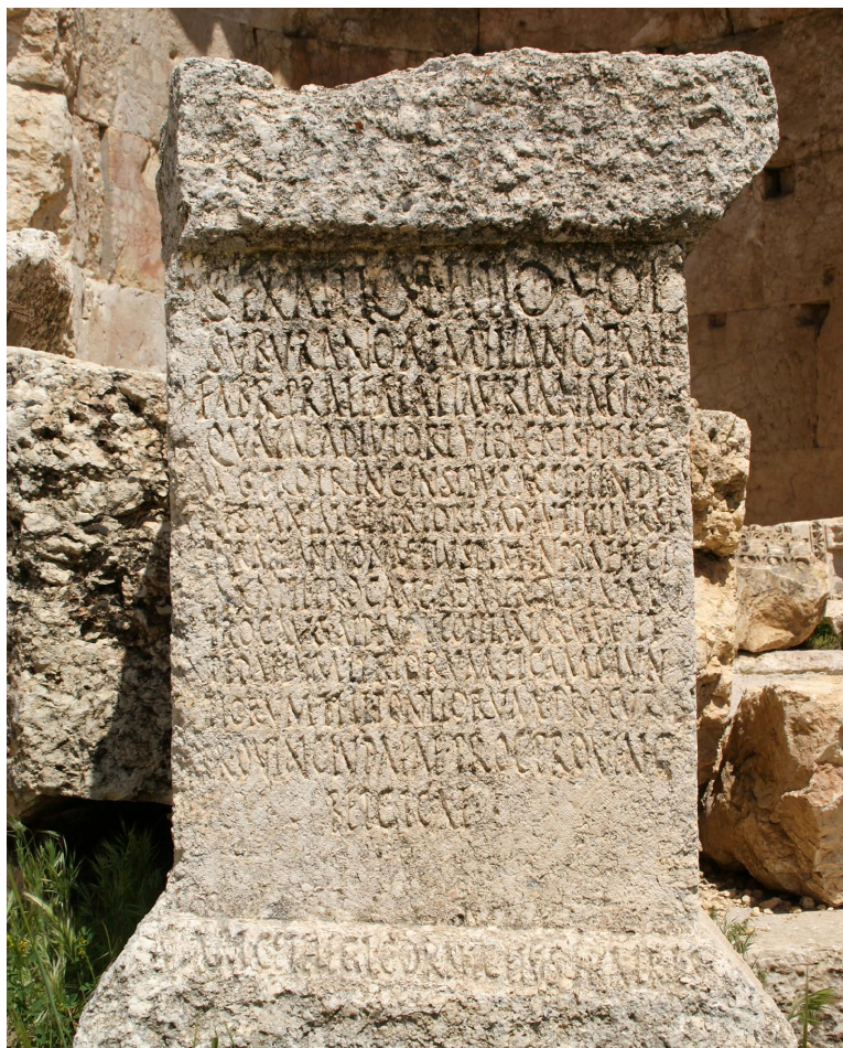
Fig. 1. Baalbek/ Heliopolis, Grande Cortile del santuario di Giove. Base di statua di Sex. Attius Suburanus Aemilianus