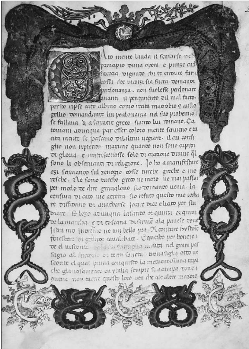
2. Biblioteca Nazionale Braidense, ms. AC.VIII.34, c. 3r. Su concessione del Ministero dei beni e delle attività culturali e del turismo.