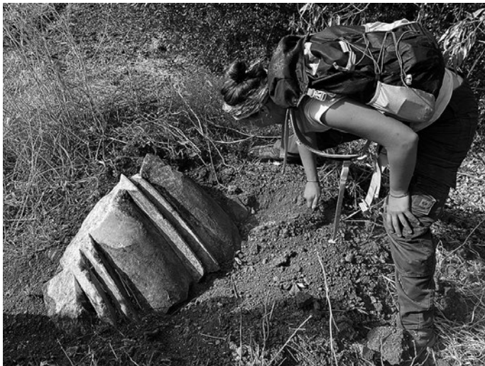
Fig. 9 Marble fragment of a funerary monument discovered along the sacred road between Eretria and Amarynthos

covered along these three axes, suggesting that the three main roads leaving Eretria to the east were lined with burials and grave monuments, highlighting a much richer and diffuse funerary landscape than previously thought.