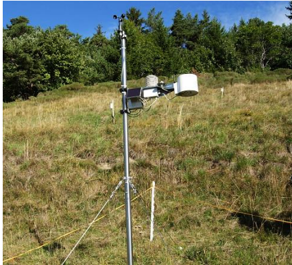
Station de mesures climatologiques installée sur les prairies de Chermignon par le projet MontanAqua.

pour la Suisse (CH2011, 2011) et de modèles glaciologiques et hydrologiques. Ces différents travaux ont montré qu'au milieu du XXI e siècle, la ressource totale disponible annuellement dans la région devrait se maintenir par rapport à l'actuelle grâce à la contribution du glacier de la Plaine Morte. En effet, jusque vers 2060, ce glacier devrait fortement contribuer aux écoulements. Cette situation pourrait néanmoins être amenée à changer au-delà de cette période en raison d'un volume de glace à fondre plus réduit (Huss et al. , 2013). Ce tableau ne doit cependant pas occulter des situations qui pourront être beaucoup plus critiques à l'occasion d'années sèches (comme en 2003 et 2011 par exemple) et également en deuxième partie d'été avec une ressource en eau devenue temporairement indisponible. Enfin, il existe des disparités géographiques fortes. En effet, les ressources en eau des communes situées sur le coteau sont déjà beaucoup plus limitées que celles des communes de montagne, une situation qui devrait encore s'accroître.