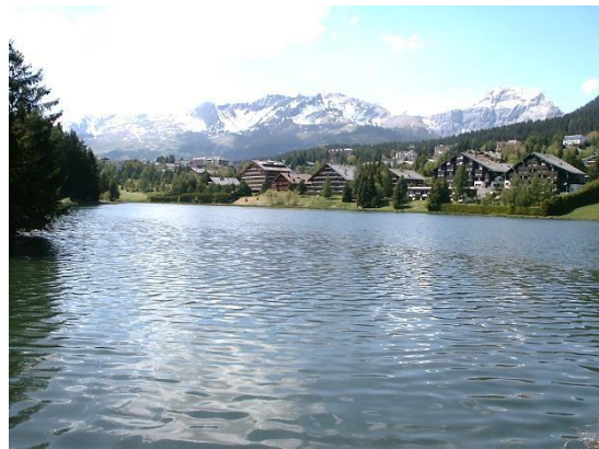
Les lacs – ici celui de la Moubra - font le charme de la station de Crans-Montana. Ils servent surtout à stocker de l'eau pour l'irrigation et parfois pour l'approvisionnement en eau potable

À l'échelle locale ou de petits bassins versants régionaux, peu de travaux ont jusqu'ici tenté d'évaluer l'évolution des demandes. En cela, le projet entrepris dans la région de Crans-Montana-Sierre, par les universités de Berne, Fribourg et Lausanne dans le cadre du projet MontanAqua du Programme national de recherche 61 Gestion durable de l'eau apparaît comme étant tout à fait original (Weingartner et Reynard, 2010 ; Reynard et al. , 2013, 2014). Couvrant une surface d'environ 130 km 2 , la zone d'étude comprenait 11 communes situées dans la région la plus sèche de Suisse et présentant des profils socio-économiques variés allant de la petite ville (Sierre) à la station touristique de montagne (Crans-Montana), en passant par les communes résidentielles et viticoles du coteau.