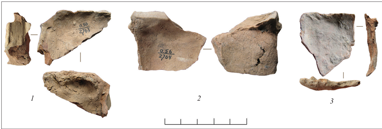
Рис. 11. Частини жертвних поверхонь віттариків.