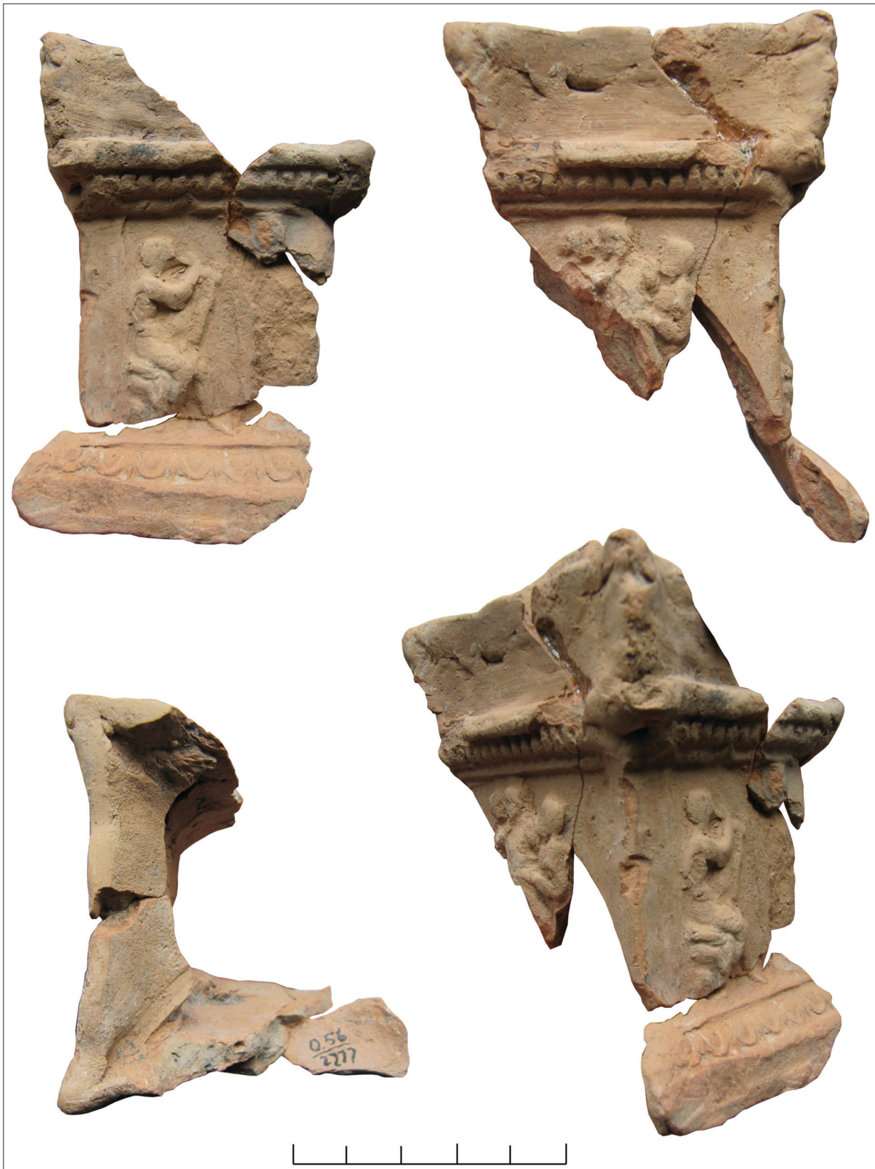
Рис. 4. Фрагментований віттарик: 2 сторони зі сценами з Діонісом, Аполлоном.