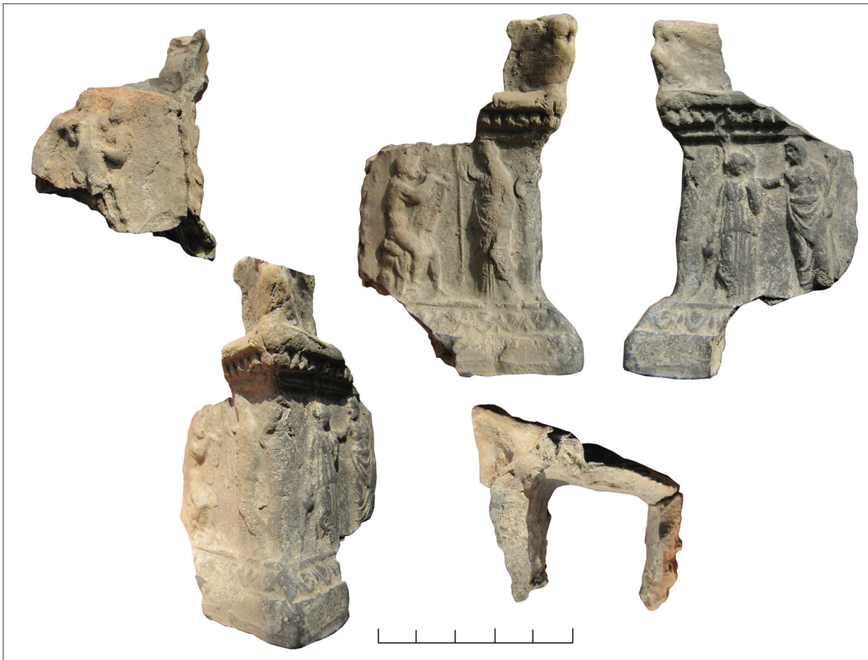
Рис. 2. Фрагментований вітварик: 3 сторони зі сценами з Діонісом, Аполлоном, Зевсом. Fig. 2. A fragmented arula: 3 sides showing scenes with Dionysus, Apollo and Zeus.

ня знахідки якого втрачена під час Другої світової війни (Савельєва 2021). Навіть якщо ми не знаємо достеменно, чи на сусідній з музеєм Тірі було знайдено форму, то можемо з певністю сказати, що вона використовувалася в регіоні, у Північному Причорномор'ї.