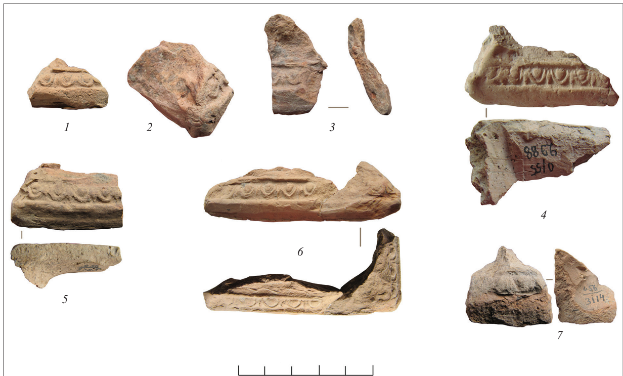
Рис. 10. Фрагменти нижніх частин вівтариків, прикрашених овами. Fig. 10. Fragments of arulae's lower parts decorated with egg-and-dart.

у сценах на цих тиміатеріях був таким: Зевс, Ніка, Діоніс, Аполлон.