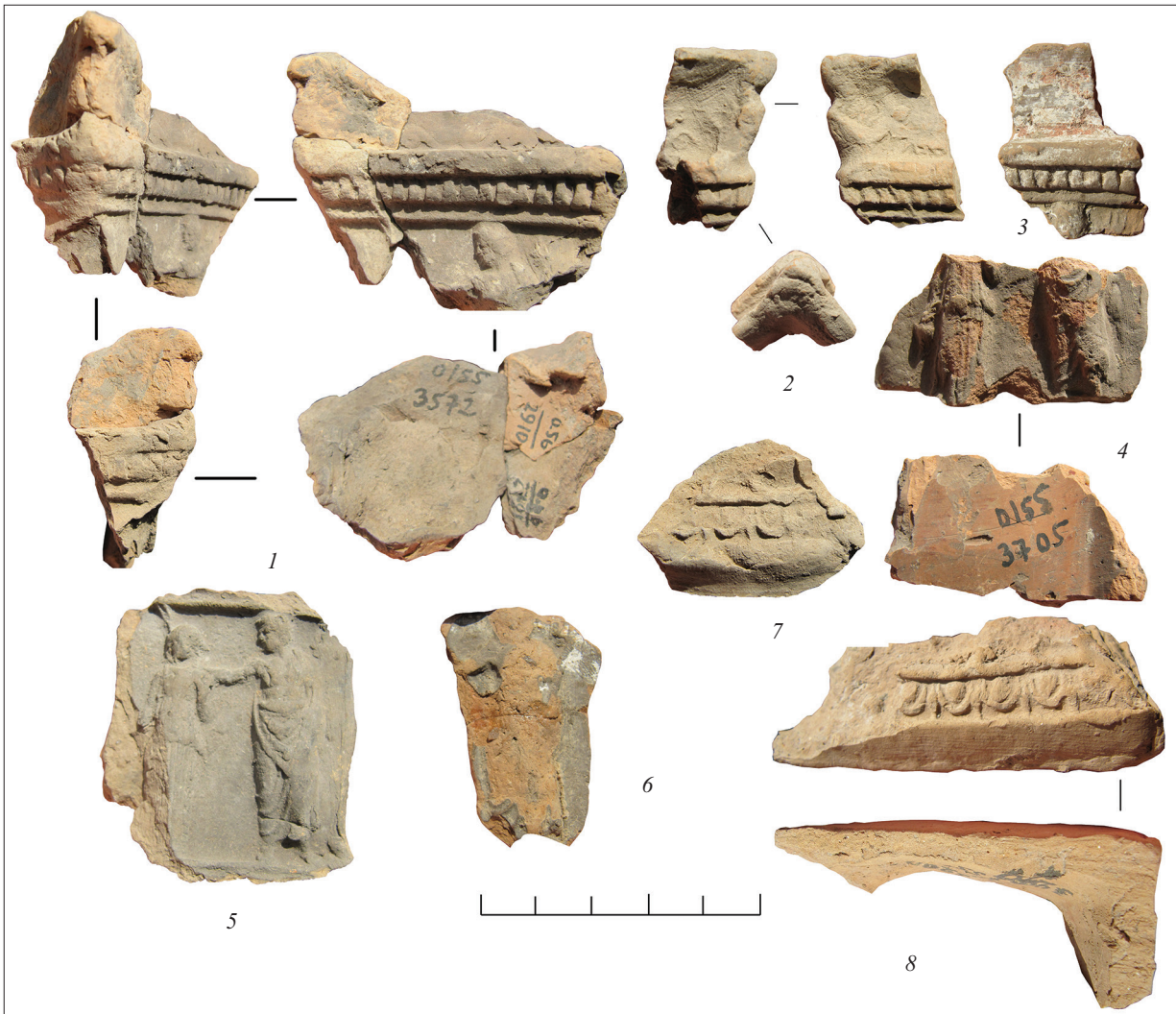
Рис. 5. Фрагменти рельєфів зі сценою із Зевсом. Fig. 5. Fragments of reliefs showing scenes with Zeus.

ливою і дає підстави зазначати «щонайменше 9 виробів». Фрагменти, які не мають спільних сторін і лише гіпотетично належали до одного виробу, позначено окремими пунктами каталогу із вказівкою на спільні ознаки з іншими фрагментами. Каталог містить дані про місце знахідки, глибину ботроса, на якій її було зафіксовано, а у випадку знахідки поза ботросом – інформацію про її контекст. Наступним пунктом в інформації є розміри фрагмента, характеристики матеріалу виготовлення, стан збереженості, техніка виготовлення, короткий опис особливостей зображення і слідів процесу виготовлення зразка.