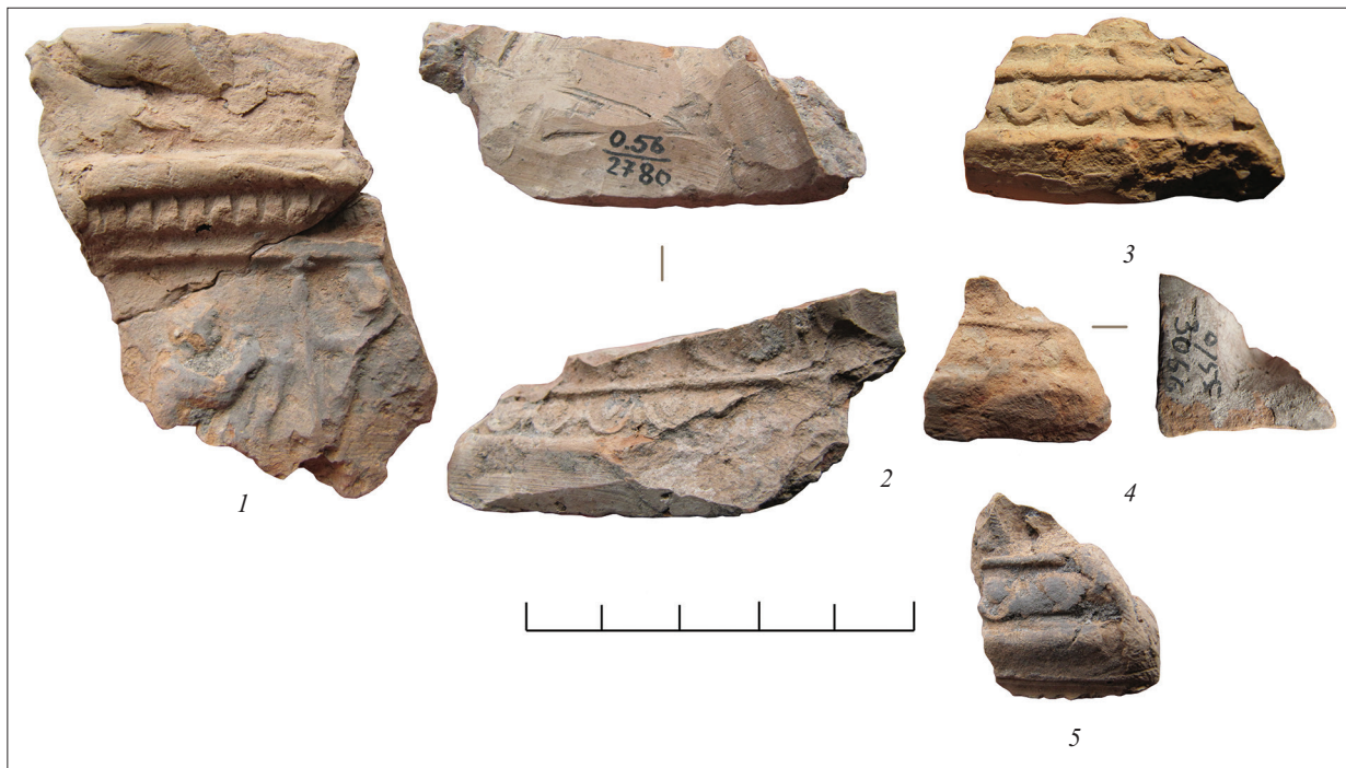
Рис. 8. Фрагменти рельєфів зі сценою з Аполлоном. Fig. 8. Fragments of reliefs showing scenes with Apollo.

вого плеча спадає навскоси до талії, скоріше за все, шкура. Пасмо довгого волосся спускається на плече. Менада показана в русі, одяг огортає талію, спадає з ліктя правої руки. На ліву руку Діоніса налягає силен, зображений боком впритул до нього.