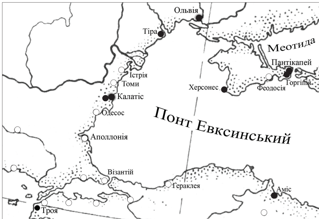
Рис. 1. Місця знахідок вітварики із рельєфними зображеннями богів у Північному Причорномор'ї.