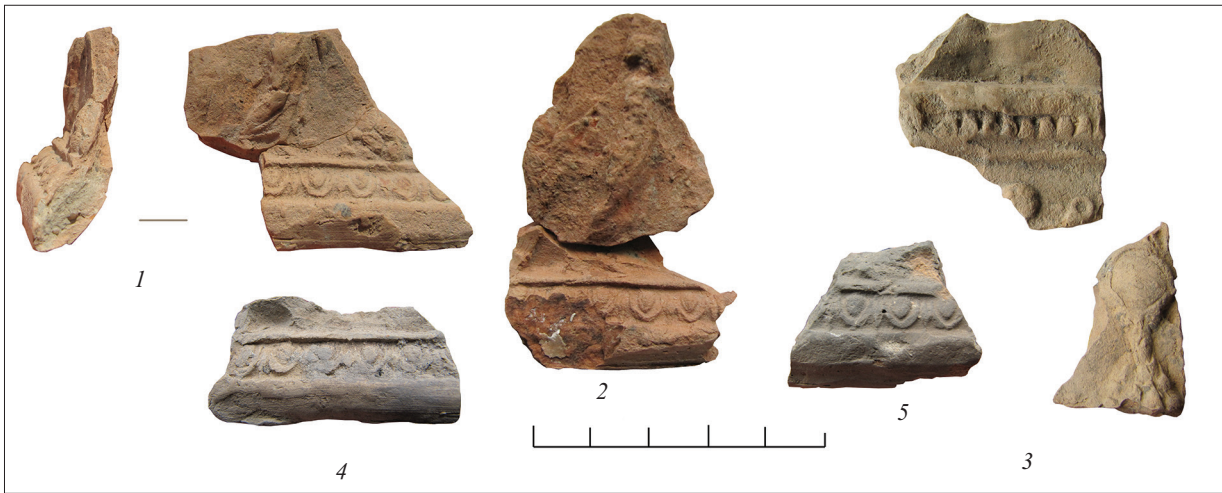
Рис. 7. Фрагменти рельєфів із зображенням Ніки. Fig. 7. Fragments of reliefs showing scenes with Nike.

Нижній край цілого виробу зазвичай вирівнювався притисканням до горизонтальної поверхні. Біля нього всередині вітгара поверхня вирівнювалася гострим інструментом. Зрізався верхній шар глини. Після цього вироби вкривали шаром ґрунтовки, в деяких випадках розмальовували, а тоді піддавали обпалу.