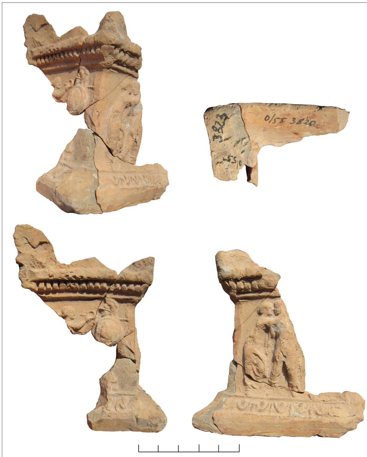
Рис. 3. Фрагментований вівтарик: 2 сторони зі сценами з Нікою, Діонісом.