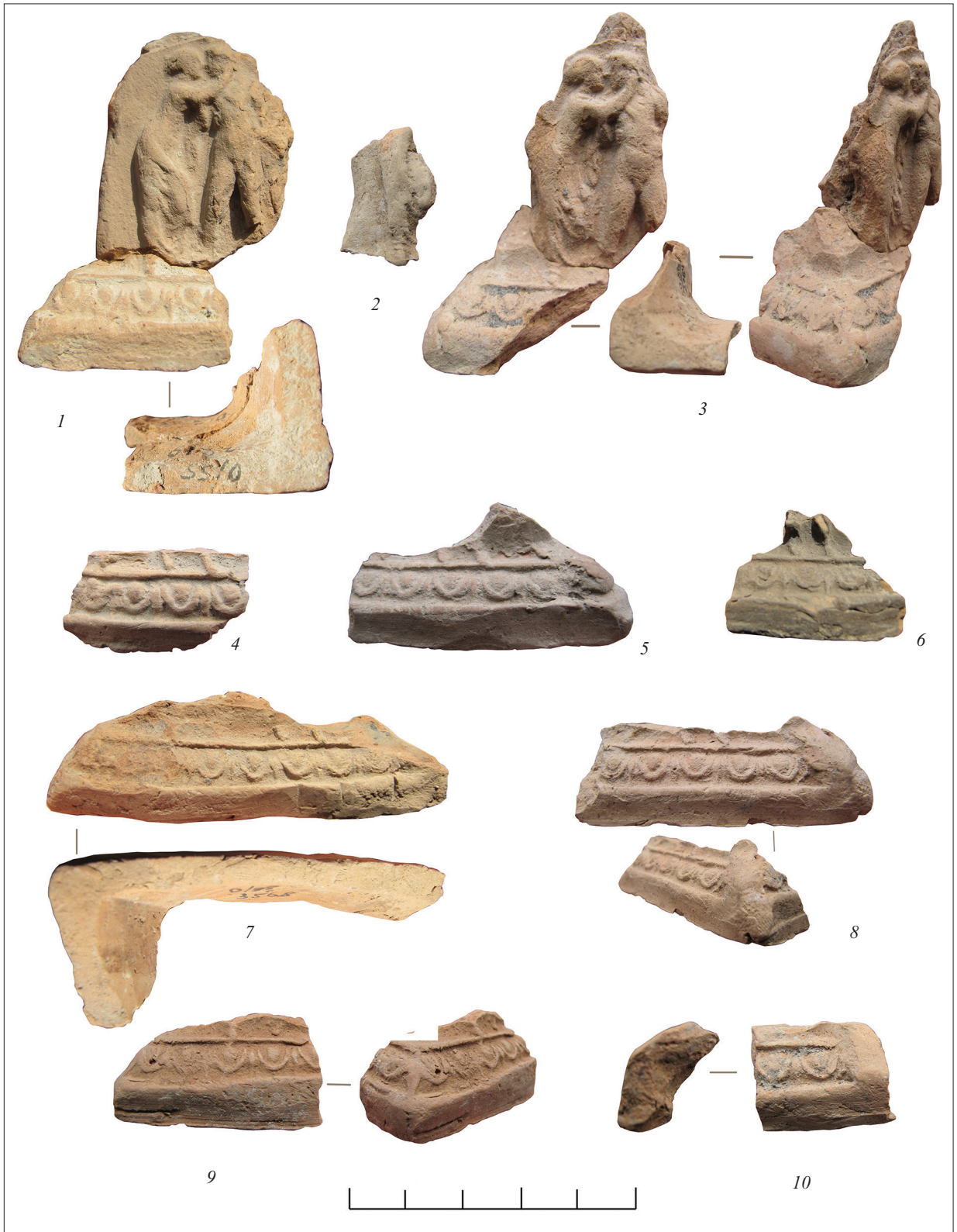
Рис. 6. Фрагменти рельєвів зі сценою з Діонісом.