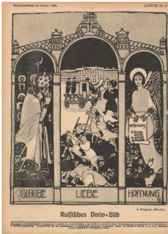
Jugend , 1905.

La place réservée à la caricature dans Jugend est importante dès l'origine et ne cesse de croître, en particulier à partir de 1905. Dans cette revue, qui privilégie le ton de l'humour, la caricature ne se distingue pas toujours nettement du dessin d'humour. L'éventail thématique se superpose à celui que l'on retrouve dans les revues satiriques de cette même aire culturelle, croquis de mœurs, caricature de styles ou traitement d'une actualité politique brûlante. Le ton est d'autant plus incisif qu'il s'agit d'affaires extérieures à l'Allemagne ou au monde de Jugend . L'accent est mis sur les cibles servant le positionnement éditorial de la revue : art académique, courants fin de siècle, institutions berlinoises, armée, mode, critique et clergé, avec une mention spéciale pour ce dernier. La spécificité des caricatures de Jugend réside dans une esthétisation Jugendstil, néanmoins réservée aux thèmes spécialement investis.