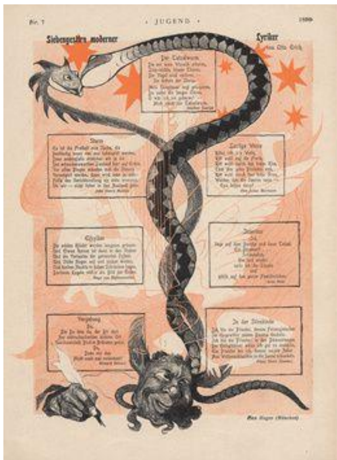
Jugend , 1899.

Même si Jugend est intimement liée au Jugendstil, elle ne peut lui être réduite. D’abord, d’autres formes d’expression y sont représentées dès l’origine, ensuite, la version que livre Jugend du Jugendstil est une adaptation munichoise au médium revue. A vrai dire, la revue doit plutôt s’entendre comme le prolongement de la Sécession munichoise de 1892, lors de laquelle le Jugendstil acquiert une visibilité transgressive vis-à-vis d’un art académique tenant lieu dans l’Allemagne de Guillaume II d’art officiel. Georg Hirth, le créateur de Jugend , y prend une place active, en tenant notamment une tribune dans son journal à fort tirage, les Münchener Neueste Nachrichten , en faveur d’un art libéré de toute tutelle académique. Contenu comme destin de la revue sont du reste très liés à la personnalité de Georg Hirth qui imprime jusqu’à sa mort, en 1917, des visions progressistes à une direction collégiale qui le suit avec plus ou moins de zèle, n’évitant pas toujours les maux de l’époque, racisme, misogynie ou antisémitisme. A cette date, la revue qui a fait beaucoup de concessions esthétiques est démodée ; malgré des tentatives louables, elle ne recouvre jamais durant la République de Weimar sa splendeur passée. Lorsqu’elle cesse de paraître en 1940, après avoir fusionné avec une revue dédiée à la photographie, elle n’est depuis longtemps que l’ombre d’elle-même.