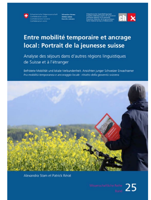
Figure 3 : Alexandra Stam et Patrick Rérat (éds.), 2019, «Entre mobilité temporaire et ancrage local : Portrait de la jeunesse suisse.» Befristete Mobilität und lokale Verbundenheit: Ansichten junger Schweizer Erwachsener. Chur/Glarus: Somedia Buchverlag, 261 p.

« L'objectif d'une politique de la mobilité temporaire consisterait à garantir l'aptitude des jeunes à entreprendre un tel projet. »