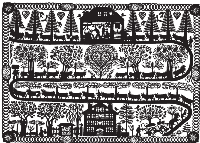
Fig. 2 Poya en papier découpé , par Johann Jakob Hauswirth (1809–1871).

de chocolat suisse traditionnelle. Cet art folklorique de la silhouette, très populaire dans les Alpes vaudoises du Pays d'Enhaut et bernoises du Haut-Simmmental, est particulièrement reconnaissable dans les scènes de la Poya , l'ascension printanière des troupeaux à l'alpage (fig. 2).