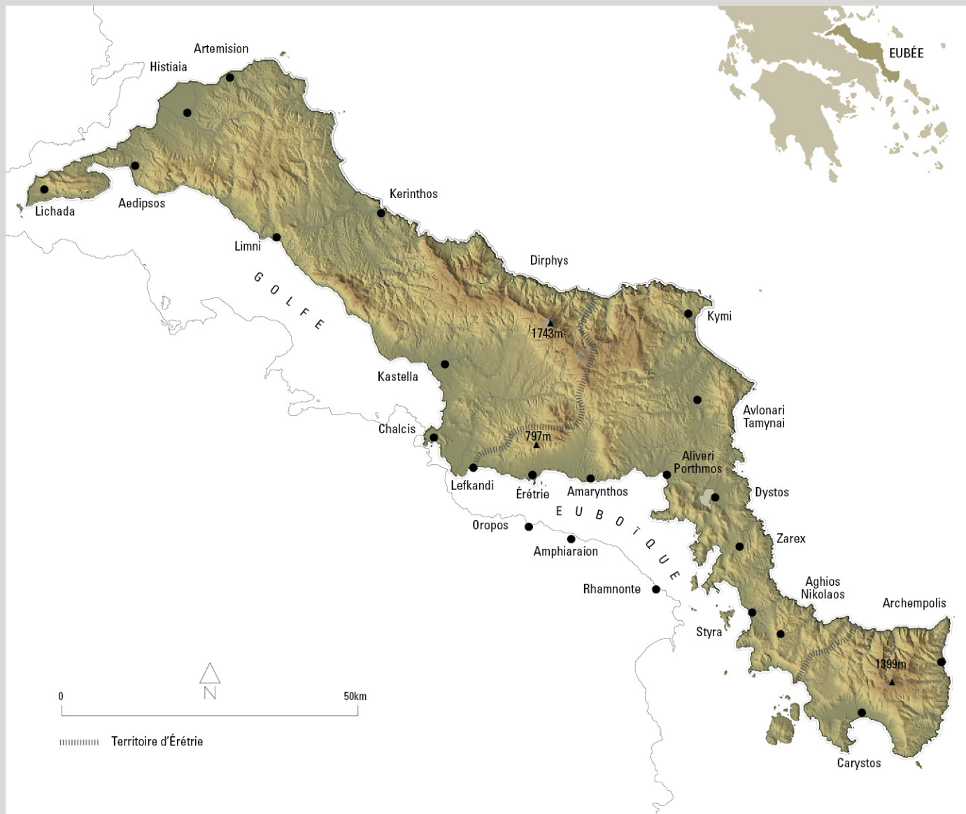
Plan 1 L'île d'Eubée avec les principaux sites archéologiques.