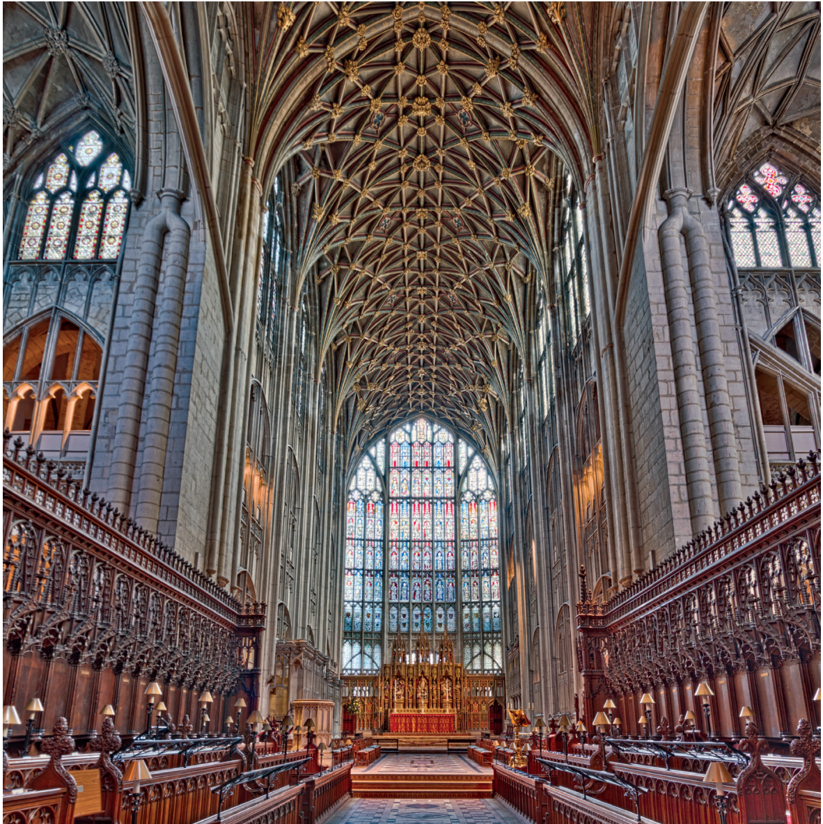
Fig. 4. Gloucester, cathédrale (autrefois abbatiale), vue du chœur et du sanctuaire

appliqué à Panofsky 15 . L'article de Panofsky partage donc avec le livre de Pevsner une même méthode, profondément ancrée dans leurs années de formation en Allemagne 16 . Comme son collègue, le savant émigré aux États-Unis, soucieux de ceux qui sont à son avis des traits permanents et omniprésents de la culture anglaise, fait preuve d'une complète indifférence à la chronologie et prend en compte des créations appartenant à différents arts – privilégiant toutefois surtout l'architecture et l'enluminure. Les deux auteurs s'attardent sur un certain nombre d'exemples communs, bien qu'ils les abordent de manière distincte : le style décoré et le style perpendiculaire en architecture (fig. 4), les drôleries