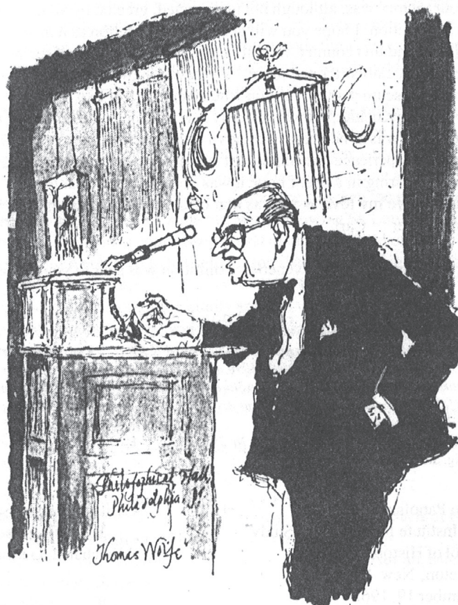
AN EXPERT RADIATING—A Rolls-Royce grille looks down impassively as learned lecture is delivered in Philosophical Hall by Dr. Erwin Panofsky.

Cette enquête sur les caractères "nationaux" de l'art anglais 8 se rapproche très fortement, dans son objet comme dans sa démarche, du célèbre essai sur l'anglicité de l'art anglais publié par Nikolaus