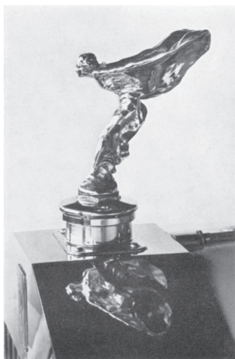
FIG. 20. Charles Sykes, R.A., the “Silver Lady” on the Rolls-Royce radiator cap.

Fig. 1. E. Panofsky, The Ideological Antecedents of the Rolls-Royce Radiator , in Proceedings of the American Philosophical Society , 107, 1963, p. 287