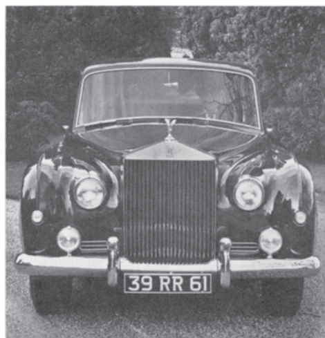
FIG. 19. Rolls-Royce car, front view.

“Stat super auratis virgae fabricatio bullis; Aureus et totum splendor adornat opus. Luna coronato quoties radiaverit ortu, Alterum ab aede sacra surgit ad astra iubar: Si nocte inspicat hunc praetereundo viator, Et terram stellas credit habere suas.”