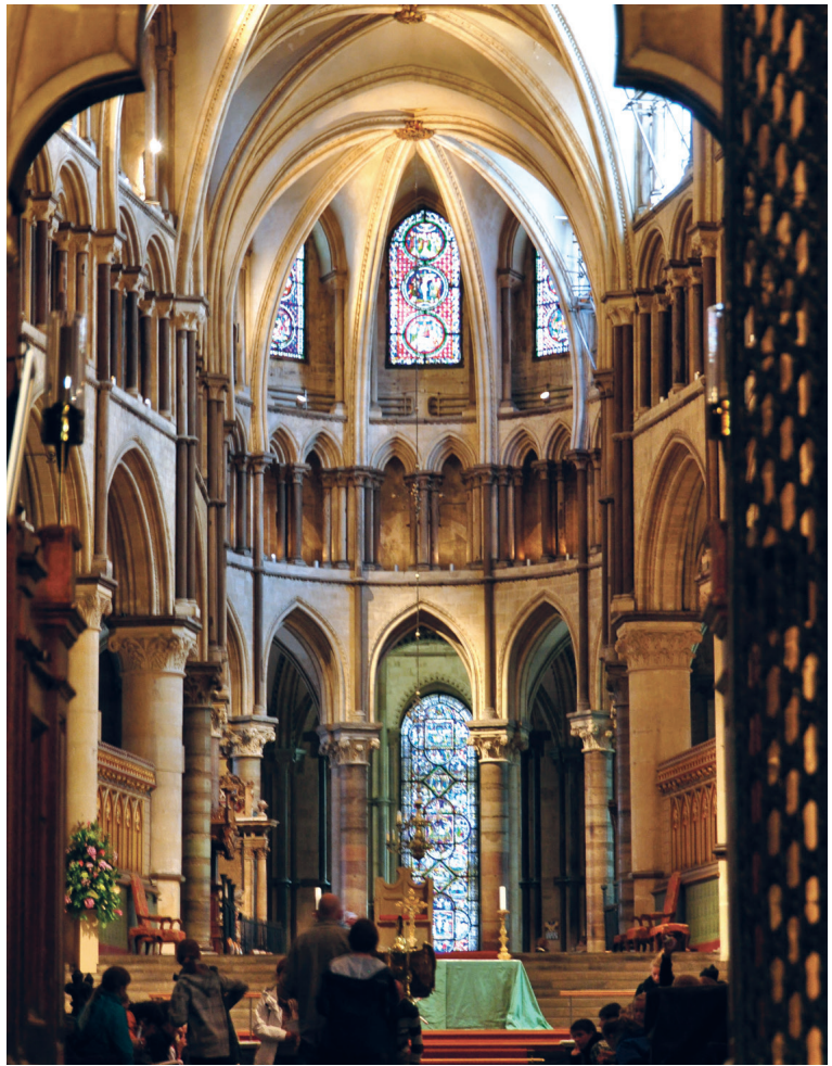
Fig. 6. Canterbury, cathédrale, vue du sanctuaire

Au-delà des affinités profondes avec Pevsner, l'article de Panofsky présente bien entendu des traits qui sont propres au père fondateur de l'iconologie. Il n'est par exemple pas surprenant que l'historien érudit habitué à tisser des rapports subtils entre images et sources écrites accorde une place très importante, dans sa description des caractères nationaux anglais, aux textes – des poèmes d'Alexander Pope à la vie de saint Colomban, de Giraud de Barri à Lord Shaftesbury. Le sixième paragraphe de l'article, qui occupe un tiers de sa longueur totale, est entièrement consacré à l'analyse du dualisme de fond de la culture anglaise tel qu'il se manifeste dans des textes du Moyen Âge 23 . L'auteur indique d'ailleurs explicitement dès le