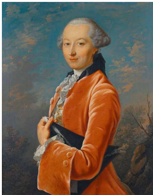
Fig.2 Portrait de Salomon de Charrière de Sévery, attribué à Johann Heinrich Tischbein, vers 1756. Huile sur toile, 63 × 82 cm. Canton de Vaud, collection privée.