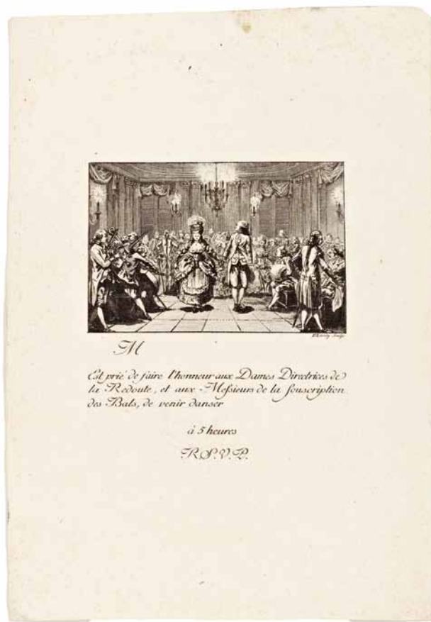
Fig. 4 Invitation au bal.

La « tyrannie des visites », unanimement dénoncée par les salonnières de l'époque, est peut-être même davantage marquée en milieu vaudois qu'à Paris, compte tenu de son caractère informel : les visites ne s'annoncent pas toujours à l'avance et ne font pas obligatoirement l'objet d'invitations ; à cela s'ajoute la petitesse du groupe social concerné (les mêmes noms de famille reviennent constamment dans le journal, et de nombreux liens de parenté les unissent), condamné à se rencontrer