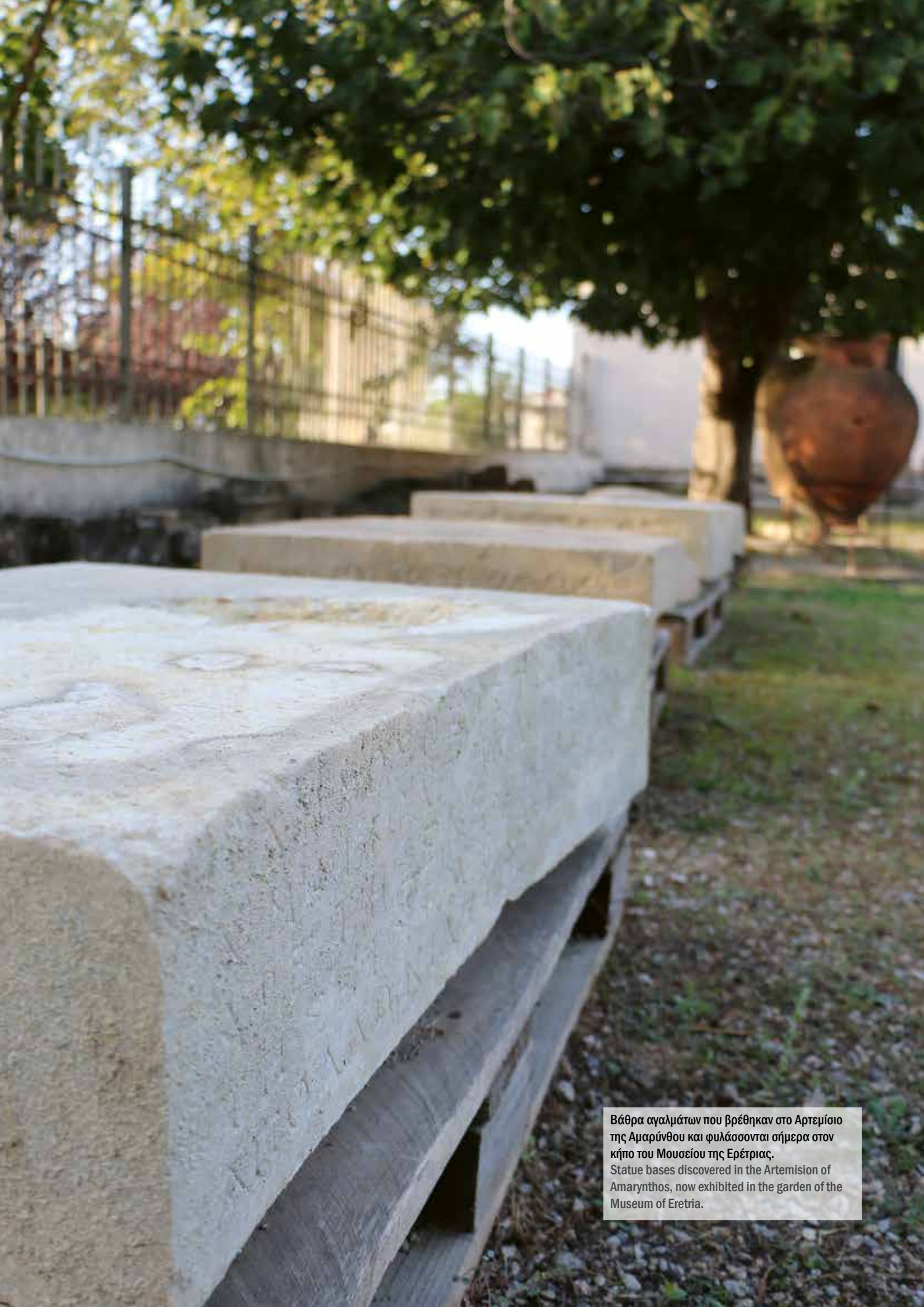
Βάθρα αγαλμάτων που βρέθηκαν στο Αρτεμίσιο της Αμαρύνθου και φυλάσσονται σήμερα στον κήπο του Μουσείου της Ερέτριας. Statue bases discovered in the Artemision of Amarnthos, now exhibited in the garden of the Museum of Eretria.