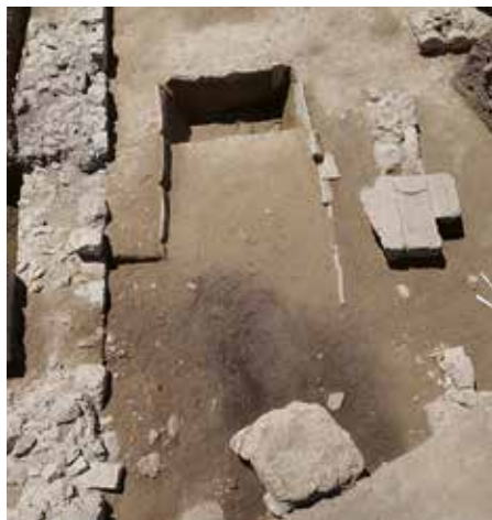
Δεξαμενή με κεραμίδες μπροστά στην πρόσοψη του κτηρίου 3 — Tile basin in front of the west facade of building 3.

Το 2012 άρχισε να αποκαλύπτεται ένα μνημειακό κτίσμα που οικοδομήθηκε γύρω στα τέλη του 7 ου αι. π.Χ. (3), τα κατάλοιπα του οποίου εμφανίστηκαν μπροστά στην πρόσοψη της ανατολικής στοάς. Κατά την ανασκαφική περίοδο του 2020 ολοκληρώθηκε η αποκάλυψη του κτίσματος και συμπληρώθηκε η κάτοψή του. Πρόκειται για ένα κτήριο μήκους 38 μ., το οποίο είχε σε κάθε άκρο του μεγάλα θυραία ανοίγματα που επέτρεπαν την πρόσβαση στο ιερό. Στο μέσον, δύο ευρύχωρα δωμάτια είναι ανοιχτά προς τον ιερό χώρο. Η χρήση τους παραμένει άγνωστη. Ακριβώς προς τα δυτικά, αποκάλυφθηκε μια ρηχή δεξαμενή (St195), της