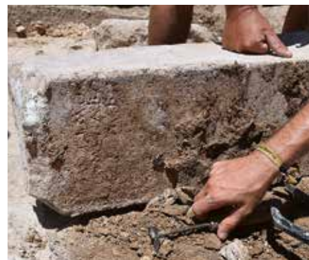
Ανάθεση στον Ερμή που ανακαλύφθηκε το 2019. Dedication to Hermes discovered in 2019.

ζόμενα θραύσματα από αυτό που έως σήμερα μας σώζεται και έχει συνδεθεί με το μνημείο, τότε θα αποτελέσει πολύτιμη μαρτυρία για το πάνθεον της Εύβοιας, το οποίο παραμένει σχετικά άγνωστο. Άλλωστε, σε αυτόν τον τομέα, από την πλευρά της επιγραφικής, οι επόμενες ανασκαφικές περίοδοι, αναμένονται να είναι εξίσου αποδοτικές. Διότι ακόμη και αν οι ελπίδες να αποκαλυφθεί ένα νέο σύνολο επιγραφών είναι πενιχρές, αντιθέτως φαίνεται πιθανό ότι η συνέχεια της ανασκαφής θα φέρει στο φως νέες μαρτυρίες σχετικά με τις λατρείες που τελούνταν στο ιερό: τέτοια δεν είναι και η περίπτωση της μάλλον απροσδόκητης ανάθεσης στον Ερμή που βρέθηκε πέρυσι σε δεύτερη χρήση κοντά στο κτήριο 6, δηλαδή στην περίμετρο του αρχαϊκού ναού της θεάς;