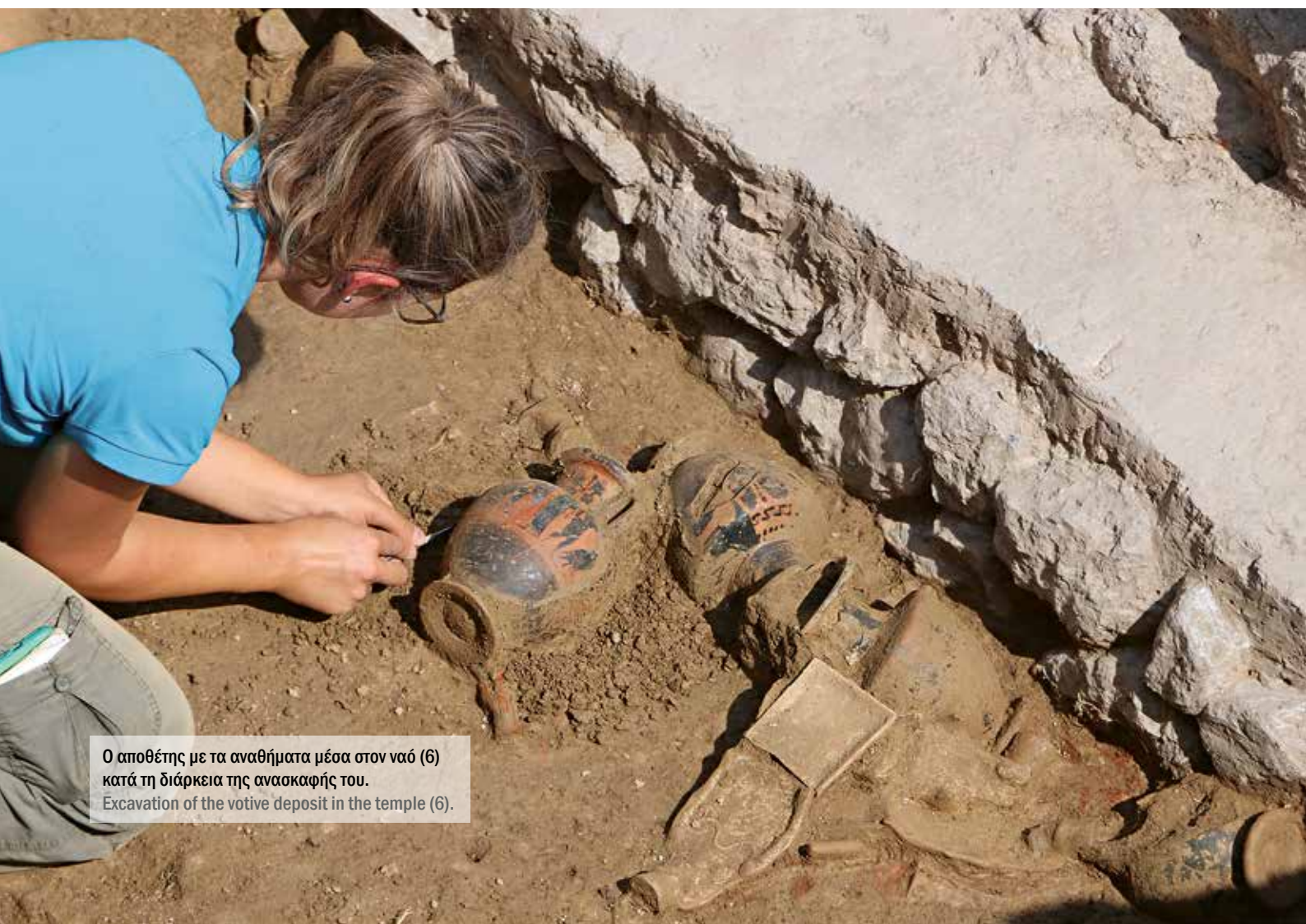
Ο αποθέτης με τα αναθήματα μέσα στον ναό (6) κατά τη διάρκεια της ανασκαφής του. Excavation of the votive deposit in the temple (6).

Αρκετές από τις ανασκαφικές τομές που ανοίχτηκαν το 2020 απέφεραν πολύτιμες πληροφορίες σχετικά με τη χρονολόγηση, την κάτοψη και τη λειτουργία του κτηρίου 6.