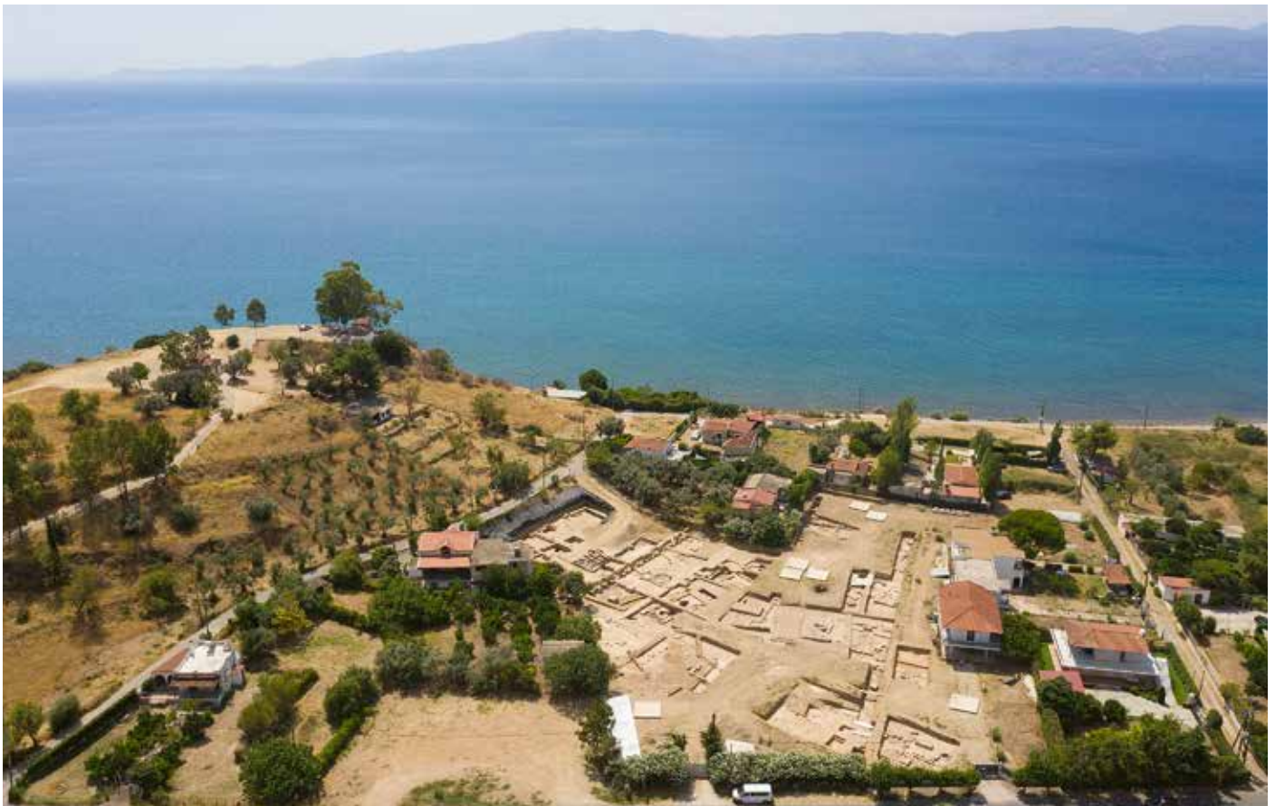
Το ιερό της Αμαρυσίας Αρτέμιδος στους πρόποδες του λόφου των Παλαιοεκκλησιών — The sanctuary of Artemis Amarysia at the foot of the hill of Paleoecklisies.

Οι ανασκαφές πραγματοποιήθηκαν σε στενή συνεργασία με την Εφορεία Αρχαιοτήτων Ευβοίας. Γεωτρήσεις και γεωφυσικές διασκοπήσεις, οι οποίες υλοποιήθηκαν από το CNRS (CEREGE) και το Παν/μιο Θεσσαλονίκης, επέτρεψαν την ακριβή θέση των ανασκαφικών τομών. Με την πάροδο του χρόνου, αποκτάμε μια ολοένα και πλουσιότερη εικόνα του χώρου του ιερού.