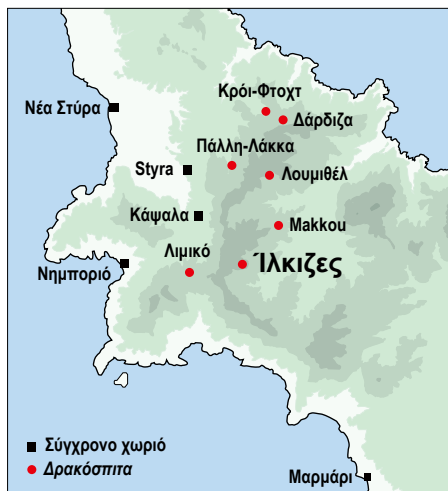
Χάρτης με τα δρακόσπιτα στην περιοχή των Στύρων. Map of the "dragon houses" around Styra.

Karl Reber – Μαρία Χιδίρογλου – Αγγελική Σίμωσι – Chloé Chezeaux – Jérôme André