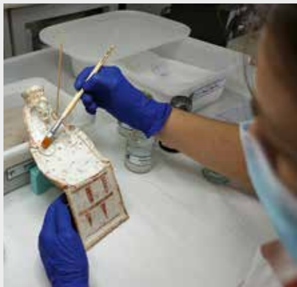
Πήλινο γυναικείο σανιδόσχημο ειδώλιο («παπάς») στο στάδιο της συντήρησης. Τέτοιου είδους αναθήματα αποτελούν σπάνια ανασκαφικά ευρήματα. Female terracotta figurine of the “pappas” type in restoration. Such votive objects are rarely found in excavations.