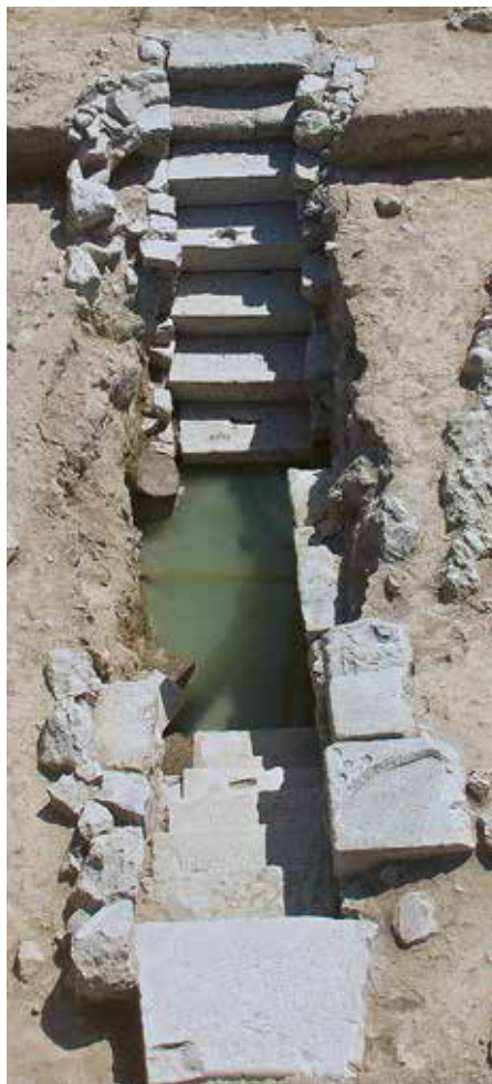
Ρωμαϊκό πηγάδι — Roman well.

Τον 2 ο αι. π.Χ., το ιερό πρέπει να επεκτάθηκε προς τα ανατολικά. Πίσω από τη μεγάλη ανατολική στοά (1) υπήρχε ένας χώρος που τον περιέβαλλε ένας τοίχος (4) κατασκευασμένος σύμφωνα με το ισοδομικό σύστημα τοιχοποιίας. Αυτός ο οπίσθιος τοίχος, που στηριζόταν από αντηρίδες, ήταν απαραίτητος για την αποφυγή κατολισθήσεων από τον κοντινό λόφο. Η πρόσβαση στον χώρο γινόταν μέσω μιας θύρας με πρόπυλο, η οποία ανοιγόταν στον οπίσθιο τοίχο της