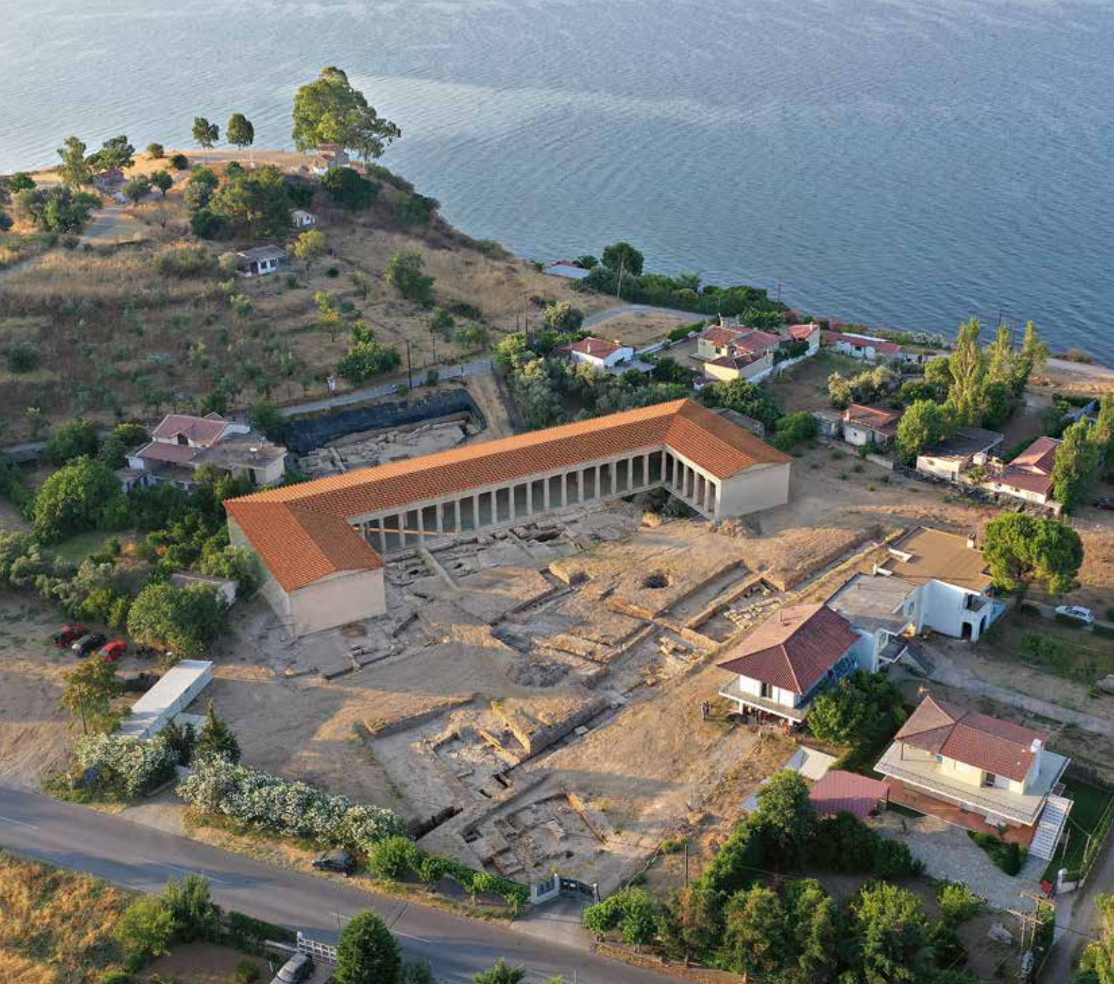
Αναπαράσταση της ανατολικής στοάς — Reconstruction of the eastern portico.