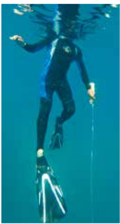
Υποβρύχιες έρευνες των στοιχείων του προϊστορικού τοπίου. Underwater exploration on features of the prehistoric landscape.

Το 2020, παράλληλα με τις υποθαλάσσιες έρευνες διενεργήθηκαν και άλλου είδους εργασίες στον όρμο, και ειδικότερα στον τομέα Λαμπαγιαννά, στα ανοιχτά της ομώνυμης παραλίας. Εκεί, μερικές εκατοντάδες μέτρα βόρεια του σπηλαιού Φράγγχι, τα λίθινα θεμέλια τοίχων και οικοδομημάτων είναι ακόμη ορατά στο θαλάσσιο βυθό. Πρόκειται για τα λείψανα μιας παράκτιας εγκατάστασης που χρονολογείται στις αρχές της Εποχής του Χαλκού, κατά την 3 η χιλιετία π.Χ. Από το 2016, αυτές οι κατασκευές αποτέλεσαν αντικείμενο τοπογραφικής αποτύπωσης, έργο που αποδεικνύεται μακροχρόνιο, καθώς τα λείψανα εκτείνονται σε έκταση περίπου 1,2 εκταρίων. Για να αποτυπωθεί στο σχέδιο η κάθε κατασκευή, θα πρέπει να ληφθούν μετρήσεις σε διάφορα σημεία της. Οι μετρήσεις αυτές πραγματοποιούνται τοποθετώντας ένα σημάδι, ορατό στην επιφάνεια, καθέτως πάνω από κάθε σημείο και, στη συνέχεια, υπολογίζεται η θέση του σημείου χρησιμοποιώντας έναν σταθμό-δέκτη, ο οποίος είναι εγκατεστημένος στην παραλία. Το 2020, ο στόχος ήταν να επιβεβαιωθούν οι μετρήσεις που λήφθηκαν τα προηγούμενα έτη και να ολοκληρωθεί η αποτύπωση.