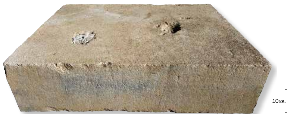
Βάθρο αγάλματος για τη νύμφη Αρχώ — Statue base for the Nymph Archo.