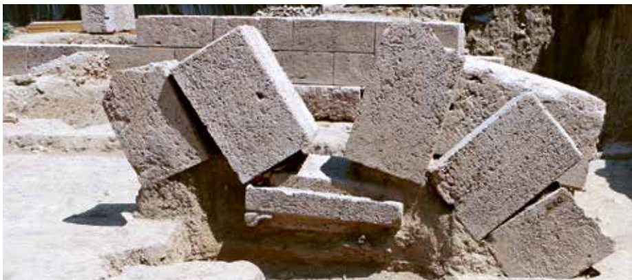
Πεσμένη αντηρίδα του τοίχου αντιστήριξης. Collapsed pillar of the retaining wall against the hillside.

περιέκλειαν στοές, ενώ στα νότια το οριοθετούσαν η νότια πτέρυγα της ανατολικής στοάς και μερικές άλλες κατασκευές (8), οι οποίες μέχρι σήμερα δεν έχουν αποκαλυφθεί πλήρως. Αντιθέτως, η δυτική πλευρά του ιερού παραμένει εντελώς άγνωστη, επειδή βρίσκεται εκτός του ανασκαμμένου χώρου. Εκεί θα μπορούσε να βρίσκεται ένα πρόπυλο, όπου θα κατέληγε η πομπική οδός που οδηγούσε από την Ερέτρια στην Αμάρυνθο.