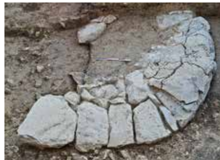
Εστία στο μέσον του κτηρίου 6 — Hearth at the center of building 6.

Τα ανασκαφικά ευρήματα του 2020, η συγκέντρωση αναθημάτων και η εστία στο εσωτερικό του αποτελούν πρόσθετα επιχειρήματα υπέρ αυτής της υπόθεσης, δεδομένου ότι διαφορετικές τελετουργικές πρακτικές μπορούν πλέον να συνδεθούν άμεσα με το συγκεκριμένο κτήριο.