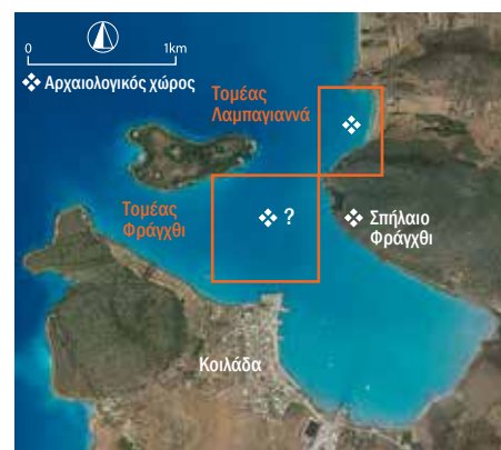
Όρμος της Κοιλιάδας (Αργολίδα). Bay of Kilaadha (Argolid).

Αυτή η διπλή αποτυχία είναι δύσκολο να δικαιολογηθεί: σε δύο σημεία του όρμου, οι δύοτες δεν μπόρεσαν να παρατηρήσουν παρά μόνο την κανονικότητα του θαλάσσιου βυθού, εκεί όπου η ηχοβολιστική συσκευή πολλα-