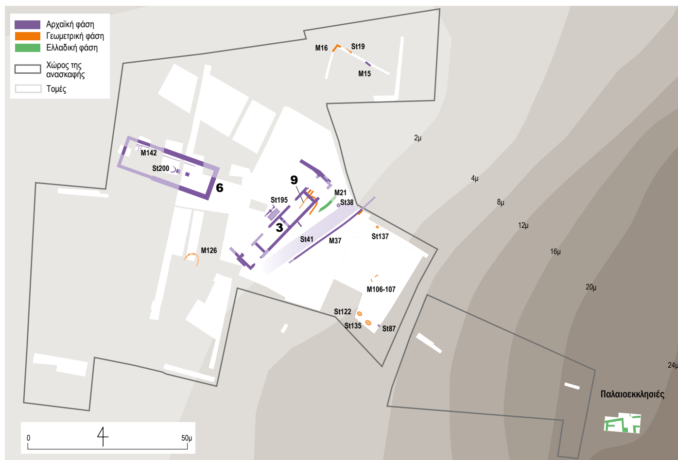
Κάτοψη των προκλασικών φάσεων του Αρτεμισμού – Plan of the Pre-Classical phases in the Artemision.

σκευάστηκε στη Μετανακτορική περίοδο (12 ος αι. π.Χ.) και παρέμεινε σε χρήση έως το τέλος της Πρωτογεωμετρικής εποχής (τέλη 10 ου αι. π.Χ.). Αυτό, ωστόσο, δεν αποδεικνύει και την αδιάκοπη τέλεση θρησκευτικών πρακτικών στην περιοχή. Προς το παρόν, τα αρχαιότερα επιβεβαιωμένα κατάλοιπα τέτοιων δραστηριοτήτων χρονολογούνται στην Ύστερη Γεωμετρική περίοδο (δεύτερο μισό του 8 ου αι. π.Χ.): πρόκειται για μικρογραφικές υδρίες, τελετουργικά αγγεία που βρέθηκαν σε μερικά ερετριακά ιερά. Στην ίδια περίοδο χρονολογούνται και κάποιες κατασκευές