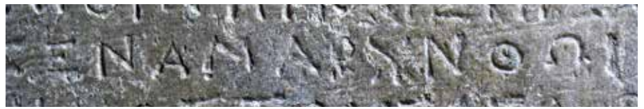
Τιμητικό ψήφισμα με αναφορά στην Αμάρυνθο — Honorific decree mentioning “Amarynthos”.

βολίες, επειδή έφερε τις λέξεις « Αρτέμιδος ἐν Ἀμαρύνθῳ ». Σε άλλο δημόσιο έγγραφο, το οποίο είχε εντοιχιστεί στο πηγάδι, αναφερόταν η ενσωμάτωση της πόλης των Στύρων, στη νότια Εύβοια, στην ευρύτερη περιοχή της Ερέτριας. Ο γεωγράφος Στράβων (10, 1, 10-12), ο οποίος μας άφησε τη σημαντικότερη γραπτή μαρτυρία για το ιερό αυτό, στο κείμενό του αναφέρει πως εκεί στήνονταν σημαντικές επιγραφές. Κατά συνέπεια, το ιερό της Αμαρυσίας Αρτέμιδος δεν ήταν σε χρήση μόνο για την προβολή των επίσημων πολιτών της Ερέτριας — όπως δείχνουν τα πολυάριθμα βάρθα αγαλμάτων —, αλλά και ως χώρος όπου τοποθετούνταν οι σημαντικότερες συμφωνίες μεταξύ της Ερέτριας και των γειτονικών πόλεων, οι οποίες τίθεντο έτσι υπό την προστασία της Αρτέμιδος. Μία φορά το χρόνο, στο ιερό λάμβανε χώρα μια