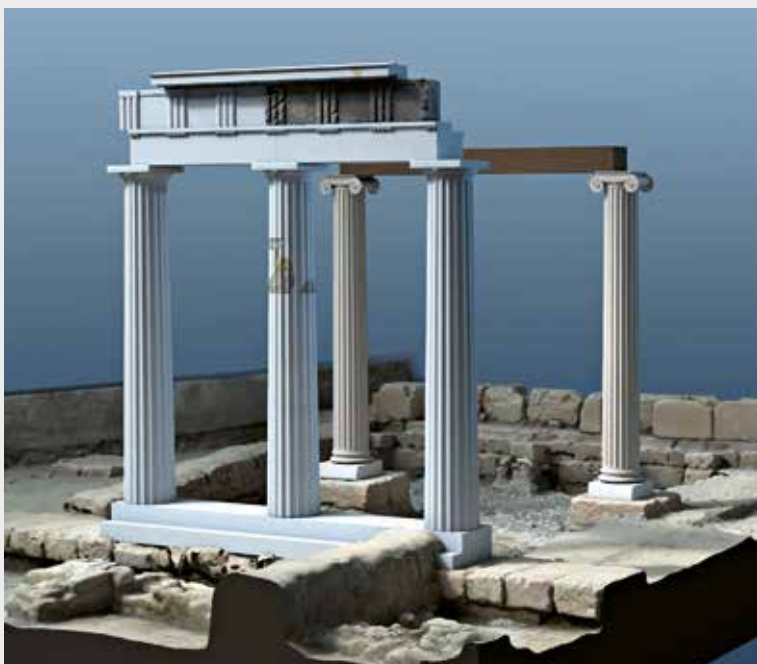
Μερική αναπαράσταση της ανατολικής στοάς, με βάση τα σωζόμενα αρχιτεκτονικά μέλη. Partial reconstruction of the eastern portico based on the archaeological remains.

Περισσότερες πληροφορίες: diplome.kvis.zhdk.ch/Oliver-Bruderer