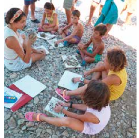
Εργαστήριο κεραμικής για παιδιά. Pottery workshop with children.

δράσης για το ευρύ κοινό. Επίσης, τα παιδιά μπορούσαν να λάβουν μέρος σε ένα βιωματικό εργαστήριο κεραμικής, ειδικά οργανωμένο για μικρές ηλικίες.