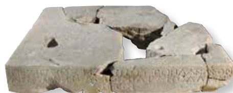
Βάζο αγάλματος που ο Τήχιππος αναθέτει στον αδελφό του Απόλλη — Base of a statue erected by Techippos for his brother Apelles.