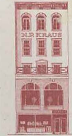
The Stock & Reference Library of H.P. KRAUS