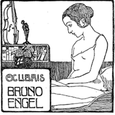
EX LIBRIS BRUNO ENGEL