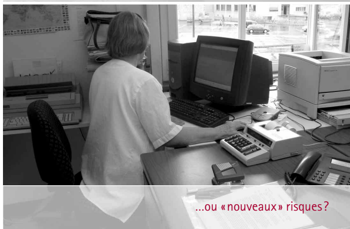
...ou «nouveaux» risques?