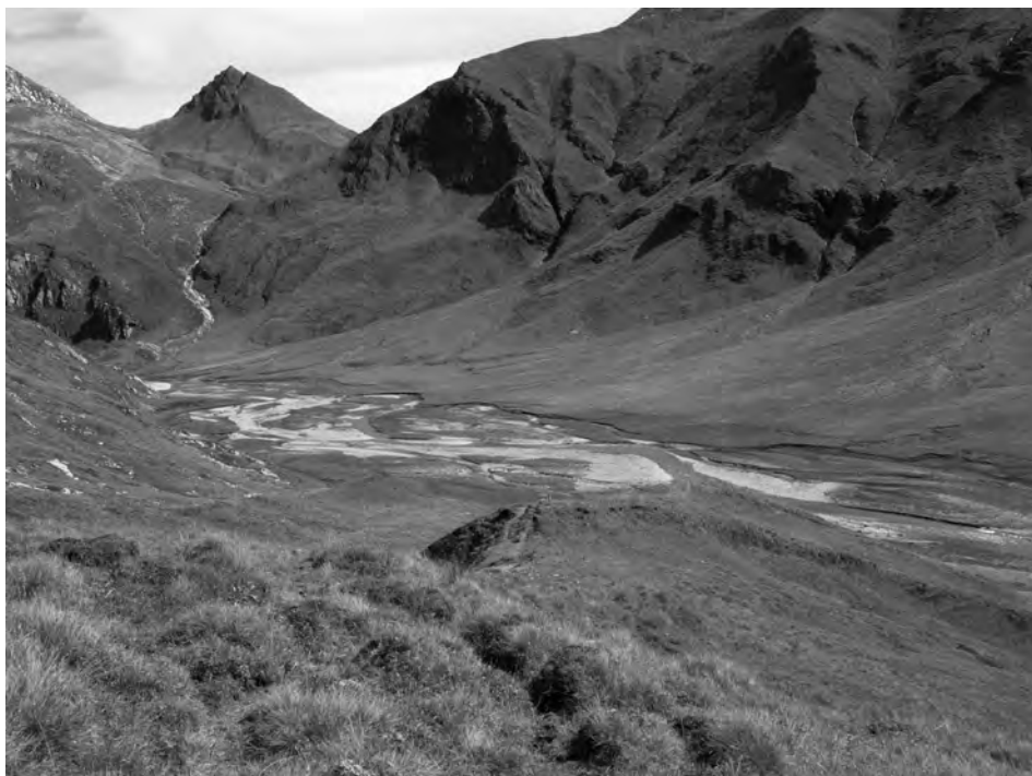
Fig. 3 La Greina. Questo luogo simbolo della protezione della natura in Svizzera è stato oggetto di uno studio geomorfologico dettagliato (Fontana, 2008), che ha permesso di mettere in evidenza l'importanza delle forme geomorfologiche nel grande valore naturale e patrimoniale di questo paesaggio.

gli oggetti geomorfologici meritano di essere protetti, ma anche valorizzati, ciò che è appunto lo scopo, rispettivamente, della geoconservazione e del geoturismo.