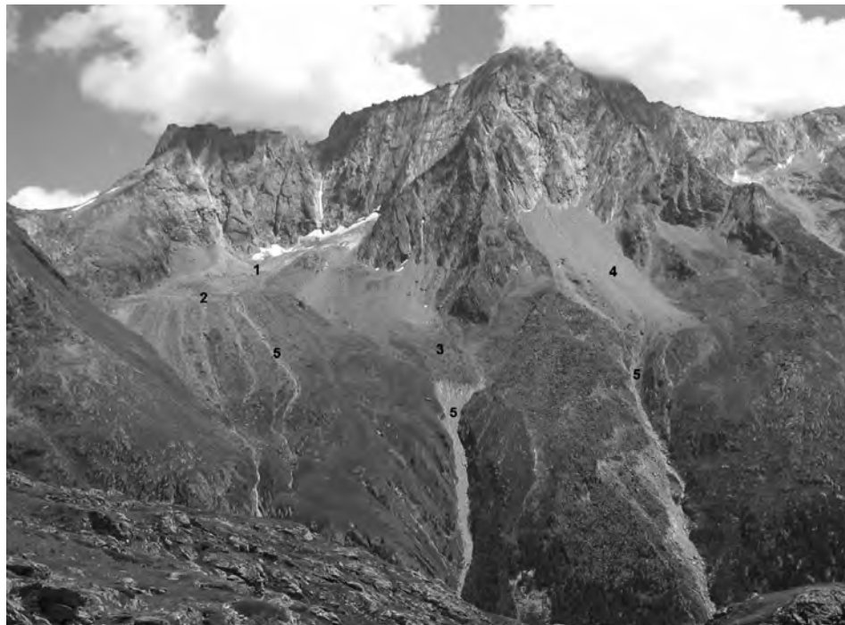
Fig. 2: Il versante di Tsarmine, sulla sponda destra della Borgne d'Arolla (Alpi vallesane). Questo versante presenta numerose zone favorevoli alla partenza di flussi detritici di volume importante. 1=ghiacciaio coperto; 2=bastione morenico; 3=rock glacier a spostamento rapido; 4 = falda detritica; 5=principali corridoi di flussi detritici.

stituito dalle precipitazioni, siano esse di forte intensità (precipitazioni estreme) o di intensità più debole ma di lunga durata. Siccome questi due tipi di precipitazioni sono attualmente in aumento, bisognerà attendersi in futuro anche ad un aumento dei flussi detritici. Si tratta di un rischio importante per numerose valli alpine, anche perché i coni di deiezione sono stati fortemente colonizzati da infrastrutture di ogni tipo.