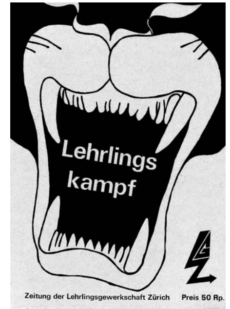
Couverture de Lehrlingskampf , n° 1, 1971, Zurich. Archives sociales suisses.

Parmi les groupes ad hoc organisés dans le cadre du Bunker, l'un s'occupe du problème des apprenti·e·s. En 1970, c'est en son sein que naît l'Organisation révolutionnaire des apprentis ( Revolutionäre Lehrlingsorganisation ), qui fait toutefois long feu, en raison de divergences idéologiques entre ses quelque 40 membres, et à laquelle participent certain·e·s des enquêté·e·s considéré·e·s ici. L'année suivante dans le sillage du Bunker est créée une structure plus ample, mais pas beaucoup plus durable : le Syndicat des apprentis ( Lehrlingsgewerkschaft Zürich ), le premier en Suisse, qui rassemble des personnes de différents courants, spontanéistes, marxistes-léninistes membres de la Revolutionäre Aufbauorganisation Zürich ou trotskistes appartenant