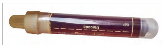
Figure 1: urine couleur «porto» retrouvée chez notre patiente après exposition à la lumière.

La patiente ne consomme pas de jus de betterave. Une bandelette urinaire et un examen de microscopie à contraste de phase effectués ne retrouvent aucun érythrocyte. Un sédiment urinaire est effectué quelques jours plus tard lorsque la patiente indique avoir un nouvel épisode d'urines rouges/foncées et ne retrouve aucun érythrocyte alors que les urines sont effectivement foncées (fig. 1).