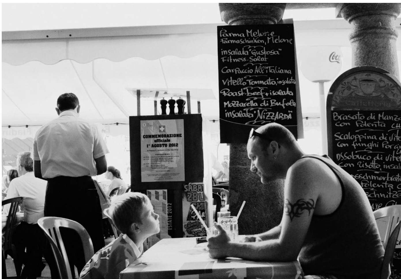
«Commemorazione Ufficiale 1° Agosto 2012, Locarno»

espresso dalla maggioranza dei votanti ticinesi, anche sui temi di politica migratoria, sembra avere contribuito in misura assai rilevante l'opposizione centro-periferia: con il dissenso fra chi, da un lato, vede il Ticino come periferia vulnerabile le cui particolari prerogative vanno tutelate da parte della Confederazione, anche verso la vicina Italia, e chi, dall'altro, chiede al Ticino di adottare un atteggiamento proattivo, di intraprendenza e di dinamismo nelle proprie relazioni con l'Italia in generale e con la Lombardia in particolare. Più il Ticino è percepito dai cittadini come una realtà dipendente e vulnerabile, maggiore è la probabilità che questi stessi cittadini si esprimano a favore di una politica d'immigrazione più restrittiva.