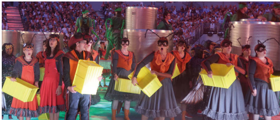
Figure 2 : fourmis choristes

des cors des Alpes. Le metteur en scène refusant les micros posés sur scène, les sondier·ère·s re-conçoivent l'équipement et fixent des micros sur les instruments, mais, ne disposant plus de micros sans-fil, les musicien·ne·s doivent s'adapter et emmener avec eux câbles, micro et cor lorsqu'ils entrent et sortent de scène.