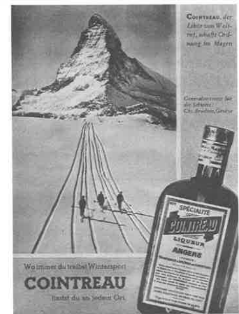
Fig. 2: Altro esempio d'estetica della traccia sulla neve. Pubblicità pubblicata sulla Zürcher Illustrierte Zeitung del 7 dicembre 1934.

per quanto riguarda lo sci (ma anche altri sport invernali, dal bob al curling), la competizione dà spettacolo e lo valorizza in quanto attrazione turistica. Questa congiuntura è sfruttata in modo esplicito dal celebre manifesto che Emil Cardinaux concepisce alla fine della prima guerra mondiale per la stazione di Davos. 36 Cardinaux disegna un gruppo di turisti che, installati su un palco in legno, osservano una corsa di bob tenendo gli sci in mano. In questo modo vengono rappresentate congiuntamente l'attività ricreativa e quella agonistica. Troviamo un funzionamento analogo nell'illustrazione del manifesto che annuncia l'ottava edizione della gara di sci militare e civile organizzata nel 1928 a Les Pléiades 37 : un concorrente in uniforme viene salutato da alcuni turisti con gli sci, che si recano sulle piste a bordo di un treno. In entrambi i casi si tratta di un'associazione che non sorprende se si pensa che molti concorsi sportivi sono organizzati anche per promuovere le località di montagna come meta turistica.