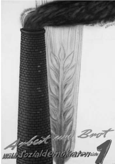
Alois Carigiet, affiche électorale pour le PSS, 1935. Bibliothèque de Genève.

par exemple, une affiche électorale du Parti socialiste suisse pouvait représenter de façon positive une cheminée crachant une épaisse fumée noire sur un épi de blé 8 . Dans son article à la focale transnationale, Renaud Bécot montre bien quelles ont été les brèches ouvertes dans les années 68 et dans différents pays contre ce productivisme à tout crin. L'Italie et les États-Unis ont joué un rôle pionnier dans la mise en action de cet « environnementalisme ouvrier » 9 , qui se construit en opposition à l'environnementalisme technocratique mis alors en œuvre dans la plupart des pays membres de l'OCDE.