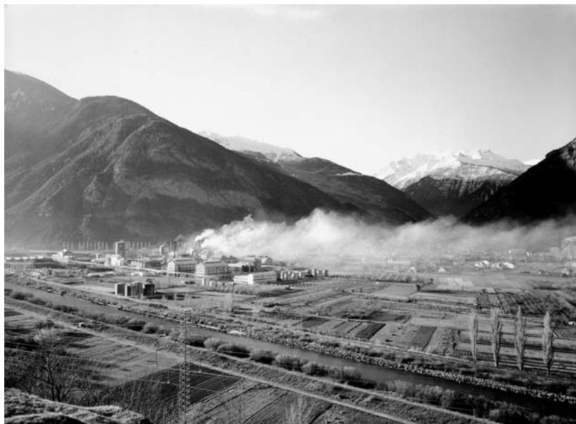
L'usine de la Lonza à Viège, en 1963.

ALEXANDRE ELSIG, MARIANNE ENCKELL, MAGALI PITTET