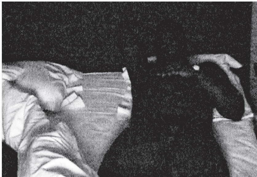
2/ Illuminer (2001)