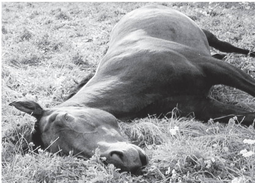
4/ Thunder (2007)

L'œuvre exposée la plus récente de McQueen, End Credits (2012), se distingue par la radicalité de sa critique et par son mode de présentation processuel, défiant toute possibilité de visionnement du film dans son intégralité. Les fiches collectées par le FBI sur Paul Robeson, célèbre acteur et chanteur Noir, activiste communiste et défenseur des droits civiques des Afro-Américains, défilent verticalement, sur une durée de six heures. L'accumulation des fiches, dont la lecture est rendue malaisée par la brièveté de leur exposition à l'écran, et leur redoublement par leur lecture sur la bande-son rendent bien compte de la masse de documents saisis par les services secrets américains, et de la logique proprement paranoïaque de l'Etat pendant la guerre froide. C'est encore une réflexion sur la constitution d'archives, la mémoire et ses processus de refoulement, le film étant rendu possible par le déclassé de ces documents confidentiels.