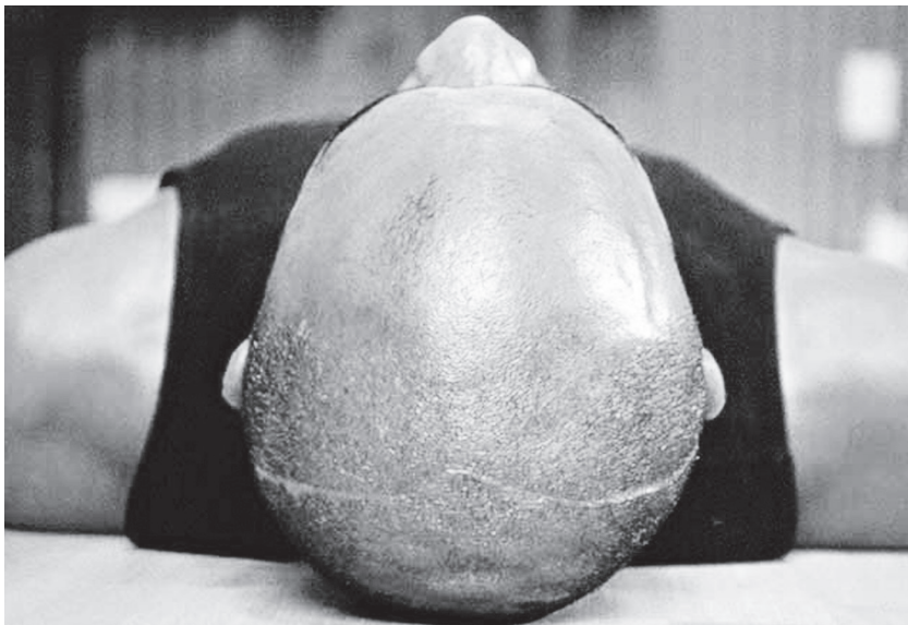
1/ 7th Nov. (2001)

Une autre pièce nous paraît remarquable, Illuminer (2001) ( L'illuminer , pourrait-on traduire en français). La scène est filmée en plan-fixe