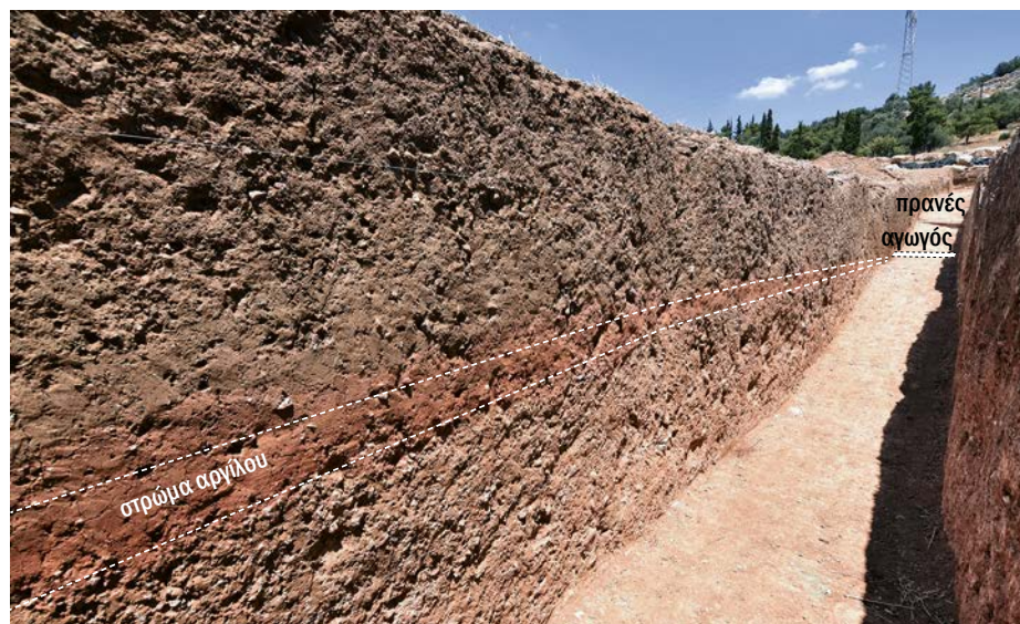
Άποψη της τομής 1 από τα νότια. Trench 1, view from the south.

Στη διάρκεια μιας σύντομης ανασκαφικής περιόδου στα τέλη Ιουνίου 2019 έγιναν πέντε τομές νότια της παλαίστρας προκειμένου