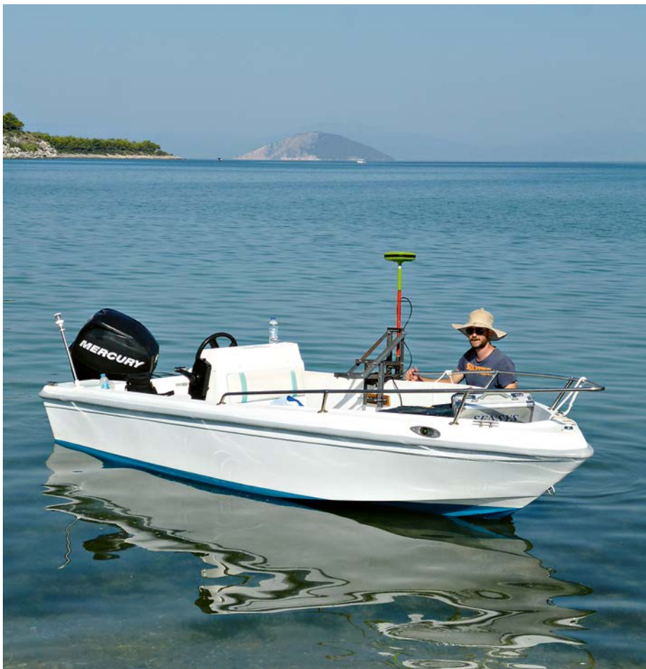
Ένα νέο σύστημα για βαθυμετρική αποτύπωση – Test of an experimental bathymetric system.