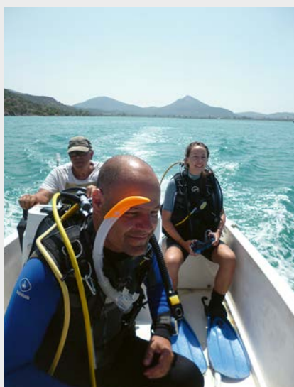
Όρμος Κοιλιάδας 2019, επιστροφή από κατάδυση – Bay of Kiladha 2019, divers' return.