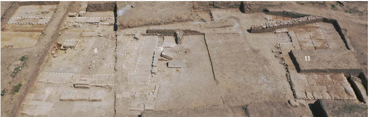
Θεμέλια του κλασικού ναού (6) και του βωμού (11) – Classical temple (6) and altar (11) foundations.

του 8 ου αι. π.Χ., ακολούθησε η ανακάλυψη άλλων δύο. Μπορούμε λοιπόν να υποθέσουμε ότι με την επίχωση της περιοχής στα δυτικά του λόφου, κατά την 1 η χιλιετία π.Χ., το χωριό a-ma-gu-to / Αμάρυνθος επεκτάθηκε σταδιακά.