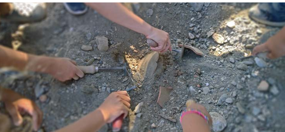
Η ανασκαφή των «μικρών αρχαιολόγων» στην Αμάρυνθο — Excavations for children in Amarynthos.

Για τους μικρούς φίλους διοργανώθηκε ένα κυνήγι χαμένου θησαυρού και μια πραγματική ανασκαφή για «μικρούς αρχαιολόγους» στην παραλία του Γερανίου. Εκπονήθηκε εκπαιδευτικό υλικό προσαρμοσμένο στις δραστηριότητες και στις επισκέψεις, ενώ η προσέγγιση των πολιτιστικών συλλόγων συνέβαλε στην ευαισθητοποίηση των βασικών τοπικών παραγόντων του πολιτισμού σχετικά με τις δραστηριότητες της ΕΑΣ.