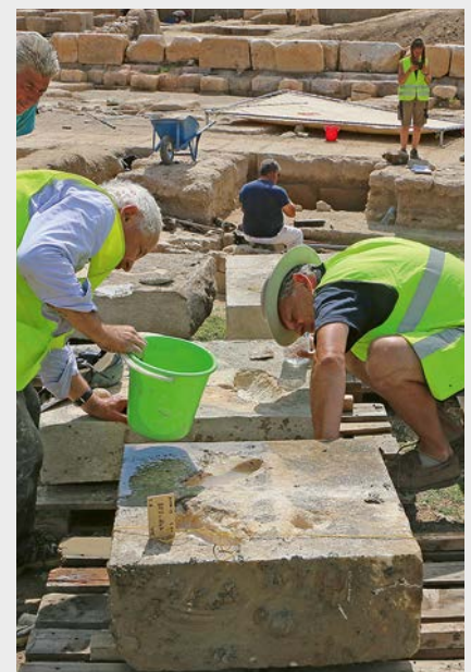
Ενεπίγραφες λιθόπλινθοι από το ρωμαϊκό πηγάδι. Inscribed blocks from the Roman well.

Η επιγραφή ΑΡΧΩ , που βρέθηκε πέρσι σε μια βαθμίδα της κλίμακας, φαίνεται πως αναφέρεται στο πρόσωπο, το άγαλμα του οποίου ήταν τοποθετημένο στον συγκεκριμένο λίθο. Παραμένει πιθανή η υπόθεση ότι πρόκειται για νύμφη της ακολουθίας της Αρτέμιδος. Κρίμα που στο πηγάδι δεν εντοπίστηκε άλλος παρόμοιος λίθος: είναι η μοναδική αποτυχία – εξαιρετικά ασήμαντη! – αυτών των τόσο καρποφόρων ανασκαφών.