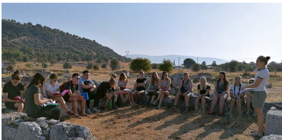
Επίσκεψη Ελβετών μαθητών στην Ερέτρια — Swiss students visiting the archaeological site of Eretria.

Παράλληλα, οι μαθητές από τα σχολεία της Ερέτριας και της Αμάρυνθου έχουν την ευκαιρία να επισκεφθούν τις ανασκαφές και να παρακολουθήσουν θεματικές παρουσιάσεις, ώστε να κατανοήσουν καλύτερα την πλούσια ιστορία του τόπου τους. Έτσι, περι-