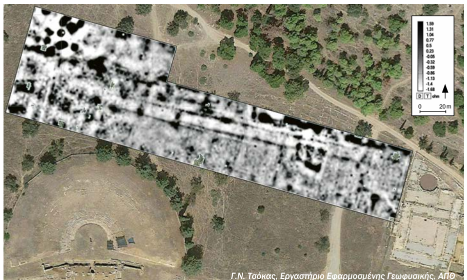
Χάρτης ηλεκτρικής αντίστασης στα οικόπεδα δυτικά του γυμνασίου, όπου εμφανίζονται δύο παράλληλες γραμμές. Electrical ground resistance map west of the Gymnasium, showing two parallel lines.

Η διαμόρφωση μιας παραδρομίδας , που στην κυριολεξία σημαίνει «έναν διάδρομο δίπλα σε», προϋποθέτει την ύπαρξη ενός ξυστού . Τον Μάρτιο έγιναν νέες γεωφυσικές μετρήσεις από τον Γ.Ν. Τσόκα (Εργαστήριο Εφαρμοσμένης Γεωφυσικής, ΑΠΘ). Πάνω