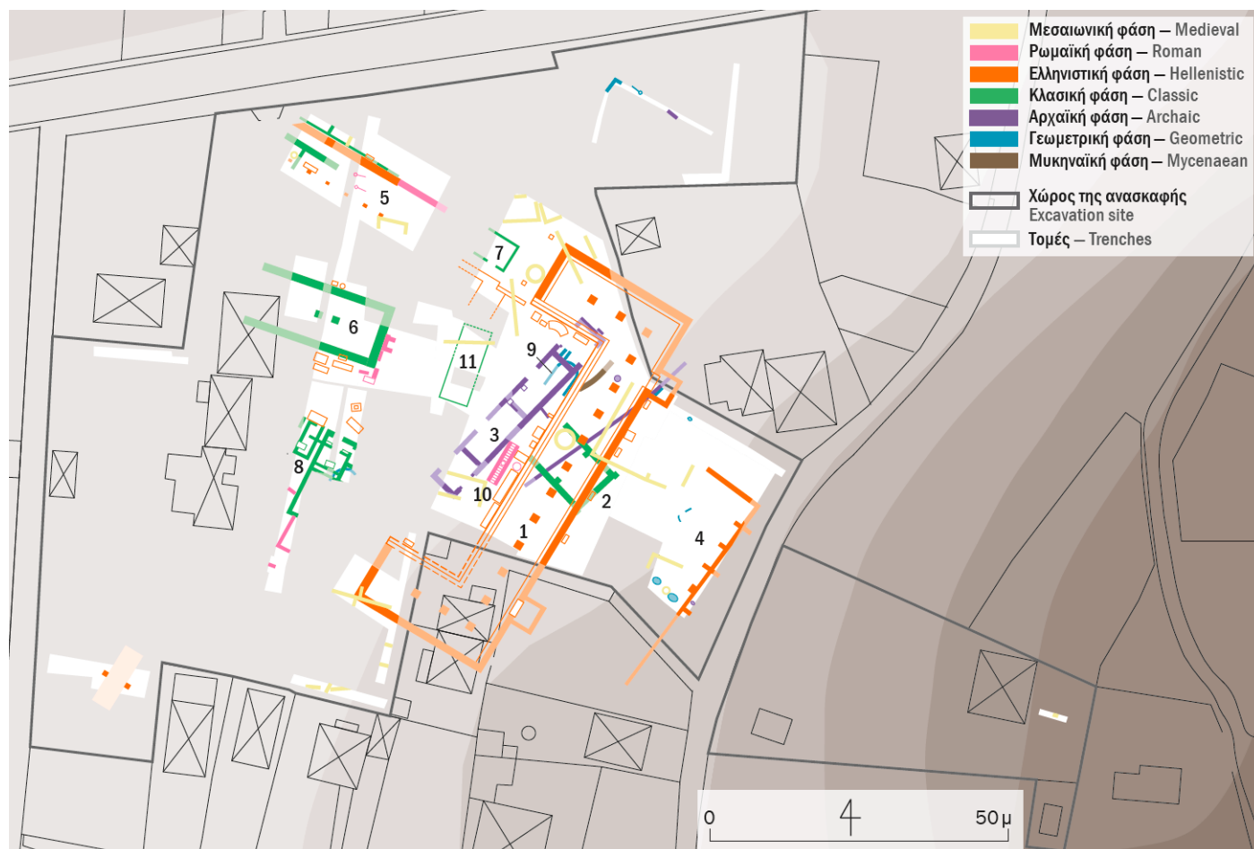
Χάρτης της ανασκαφής με τα σημαντικότερα μνημεία (1-11) — Plan of the principal monuments in the sanctuary (1-11).

Η εγκατάσταση της Εποχής του Χαλκού βρίσκεται στον λόφο των Παλαιοεκκλησιών που συνορεύει στα ανατολικά με τον χώρο της ανασκαφής και αποκαλύφθηκε ήδη στο παρελθόν. Θα πρέπει τώρα να αναρωτηθούμε πώς δημιουργήθηκε, από την εγκατάσταση αυτή, το σημαντικότερο ιερό της Εύβοιας. Οι ανασκαφές του 2019 δεν μπόρεσαν ακόμη να απαντήσουν το ερώτημα αυτό, εντόπισαν ωστόσο σημαντικά στοιχεία για τη Γεωμετρική φάση που γεφυρώνει το χρονικό αυτό χάσμα: μετά το αψιδωτό Κτήριο 9,