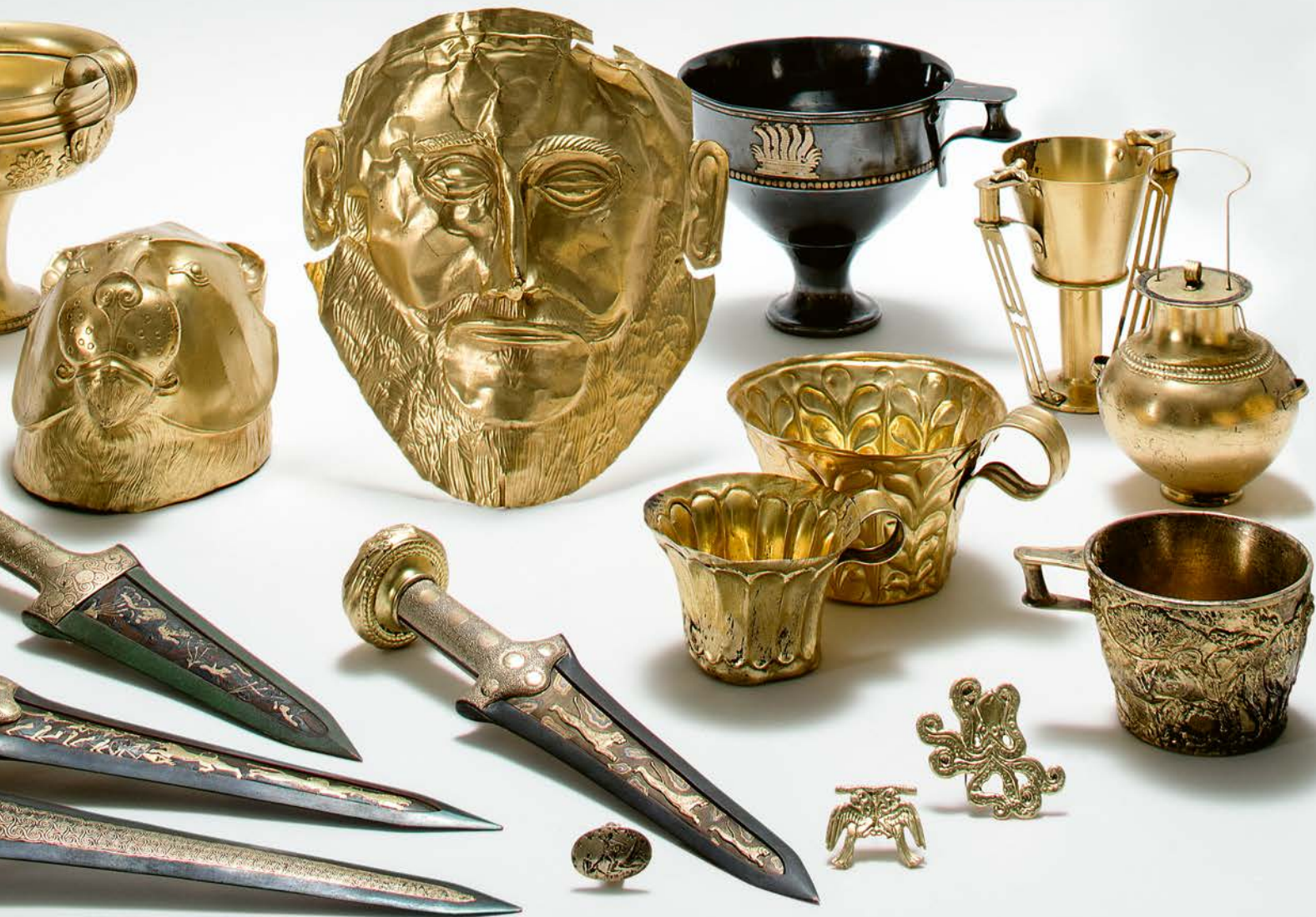
Γαλβανοπλαστικά αντίγραφα του εργαστηρίου Gilliéron, με αντικείμενα της μυκηναϊκής εποχής (MCAH, Λοζάνη). Mycenaean finds reproduced by galvanoplasty by the Gilliéron workshop (MCAH, Lausanne).