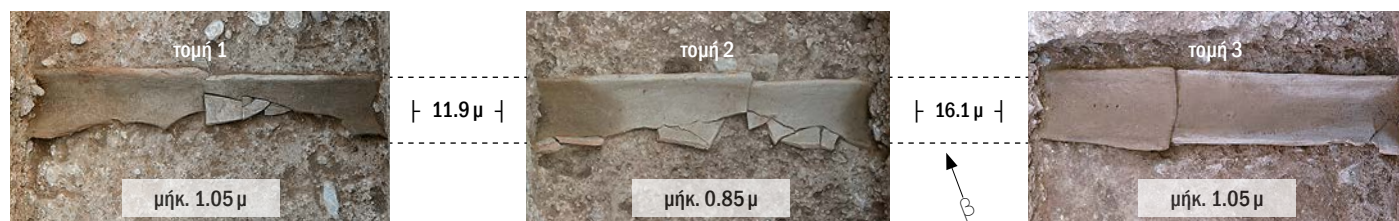
Οι τρεις τομές του πήλινου αγωγού κατά μήκος του σταδίου — The three sections of the tile channel bordering the stadium.