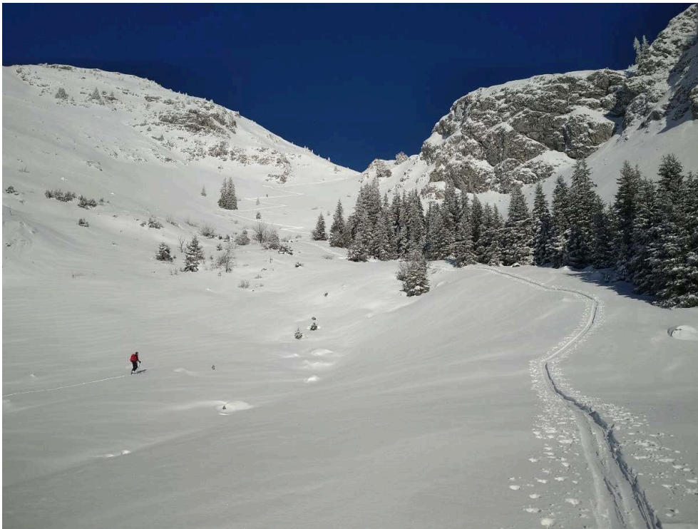
Figure 3. Une trace ascendante de ski de randonnée