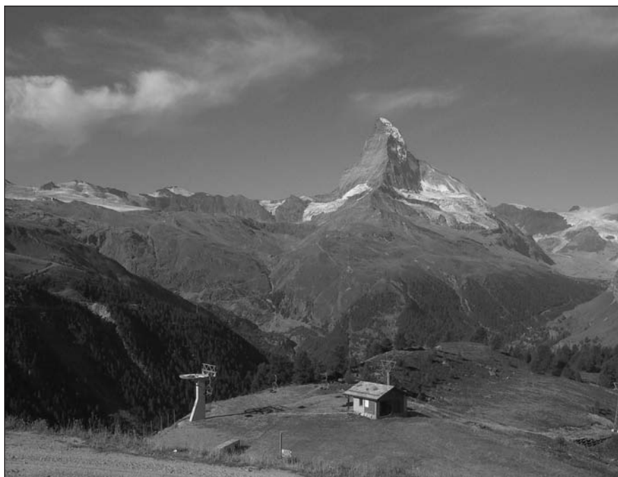
Photo 1 – La région du Cervin (Zermatt, Suisse) : un relief aux multiples valeurs. Le Cervin est un horn formé de gneiss reposant sur des calcschistes et prasinites (valeur géomorphologique et géologique). La montagne a également une grande valeur culturelle (symbole des Alpes suisses) et économique (relief vital pour l'économie touristique locale et nationale).

La valeur d'un paysage géomorphologique ne se limite pas à sa seule beauté esthétique. L'exploitation de gravières, dont l'impact visuel est généralement négatif, peut avoir une valeur scientifique significative car elle permet, par exemple, de reconstituer des paléoenvironnements. La valeur d'archive s'oppose ici à la valeur esthétique. La valeur d'un site, et notamment l'équilibre entre les cinq composantes de cette valeur, peuvent aussi évoluer au cours du temps, en raison de modifications paysagères du site (dégradation ou revalorisation), de son contexte (modifications de sa vision) ou encore de la représentation de cette valeur par la société (Reynard, 2005a). C'est le cas par exemple des zones humides (marais, tourbières) qui pendant longtemps ont été considérées comme des obstacles au développement économique et qui, dans certains pays comme la Suisse,