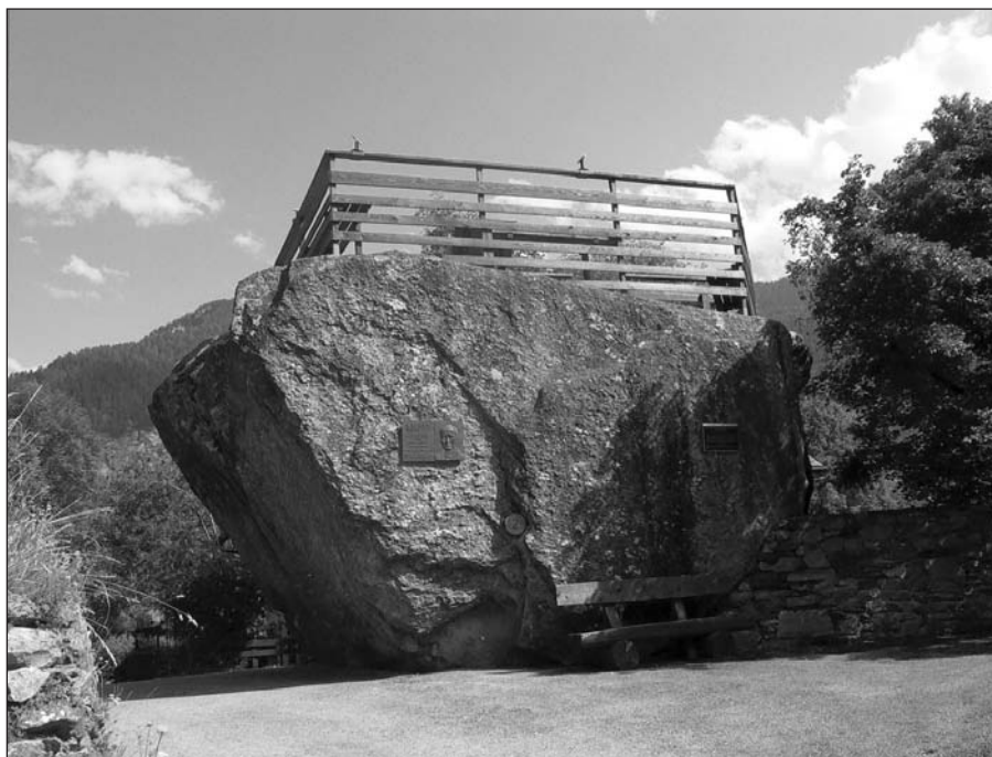
Photo 2 – La Pierre Bergère (Salvan, Suisse) : un géomorphosite à haute valeur culturelle. Ce bloc erratique a une valeur scientifique importante car il permet de reconstituer la paléogéographie glaciaire de la vallée. Il a été aussi utilisé par Guglielmo Marconi en 1895 pour ses premiers essais de télégraphie sans fil et acquiert de ce fait une valeur culturelle élevée (histoire des sciences).

Il n'existe pas de taille standard pour les géomorphosites, ni de taille minimale ou maximale. Il est toutefois important que ces sites soient bien délimités par rapport à leur environnement. On distingue des géomorphosites actifs et passifs ; les premiers permettent de comprendre et visualiser la dynamique des reliefs actuels, alors que les seconds constituent des archives des paléoenvironnements et permettent de prendre conscience de la profondeur temporelle des reliefs actuels. Par rapport à d'autres catégories de géosites (paléontologiques, structuraux, minéralogiques, spéléologiques, hydrologiques, etc.), les géomorphosites se distinguent par trois caractéristiques récurrentes : une composante esthétique, un caractère dynamique et une imbrication des échelles. La composante esthétique est souvent centrale dans le choix des sites à valoriser d'un point de vue touristique. Le caractère dynamique de nombreux géomorphosites permet d'examiner les processus actuels. Les géomorphosites actifs constituent ainsi une clé de compréhension des conditions paléogéographiques ayant permis le développement des géosites passifs. En ce sens, les géomorphosites actifs ont presque toujours une grande valeur pédagogique.