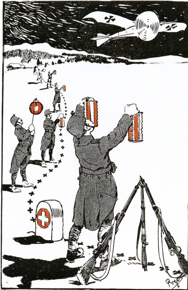
Encore un avion C'lui-là n'peut pas dire qu'il s'est trompé