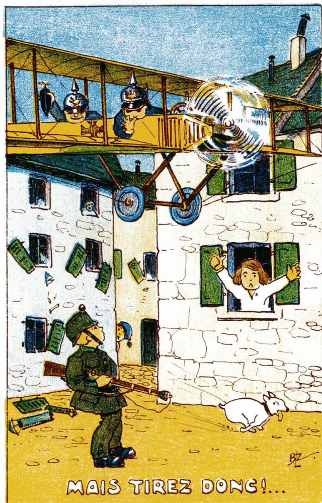
Fig. 4: Carte postale de B.L.Z., Mais tirez donc!... , s. l. n. d.

l'occupation de l'Alsace par l'Allemagne et l'espoir suscité chez une jeune fille par l'arrivée d'une hirondelle venant de France. L'éditeur de la carte postale satirique fait de cet oiseau français un avion allemand venu attaquer le Jura. Ainsi les paroles originales: « Un petit oiseau printanier / vint montrer son aile d'ébène. » deviennent « Un aéroplane étranger / vint pour nous bombarder sans gêne. » Une carte similaire, au dessin plus enfantin, montre la scène avec deux aviateurs munis d'un casque à pointe, dont l'un fait un pied de nez à la sentinelle helvétique (fig. 4). La veine satirique est porteuse et une dernière image se moque de la passivité de soldats suisses tenant des lampions pour signifier à un avion allemand où se situe la frontière (fig. 5). La plupart de ces œuvres sont jugées suffisamment démobilisatrices pour justifier l'intervention de la censure fédérale.