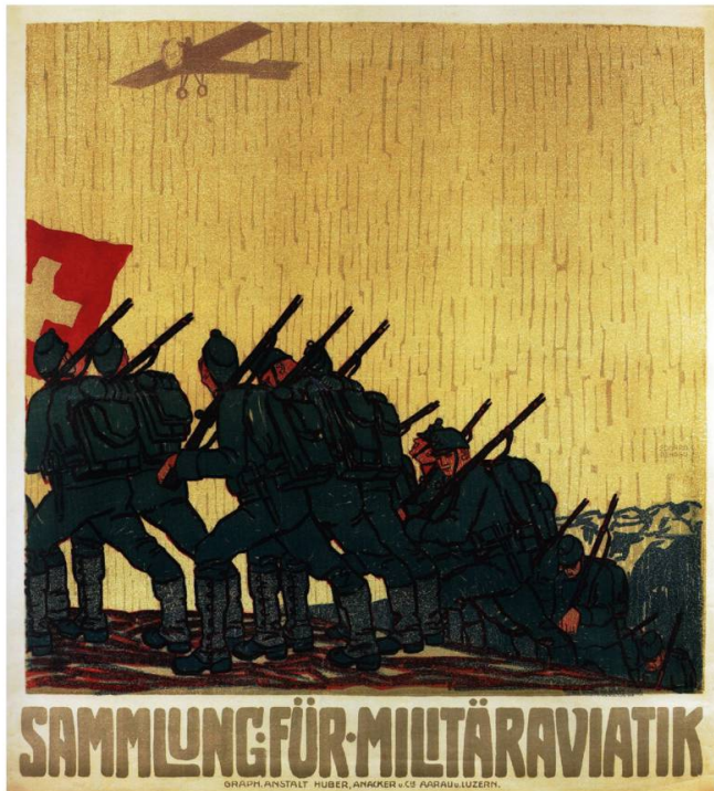
Fig. 1. Affiche d'Eduard Renggli, Sammlung für Militäraviatik , Aarau; Lucerne, Huber, Anacker & Cie, 1914.

tant, en réserve, que le « droit international n'avait pas encore donné une définition claire de la frontière aérienne 17 ».