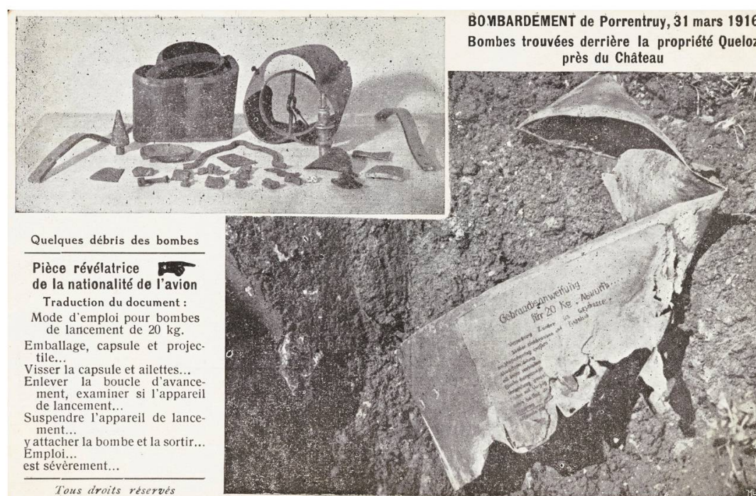
Fig. 2: Carte postale anonyme, Bombardement de Porrentruy , s. l. n. d.

et neutre, ou la matière inanimée. Tout ce qui vit se tourne d'un côté. La Suisse s'est longtemps appelée: les Ligues, et c'est son vrai nom. Les ligues ont pris aujourd'hui parti, qu'elles en conviennent ou non, et, on le suppose, pour des camps opposés 18 . »