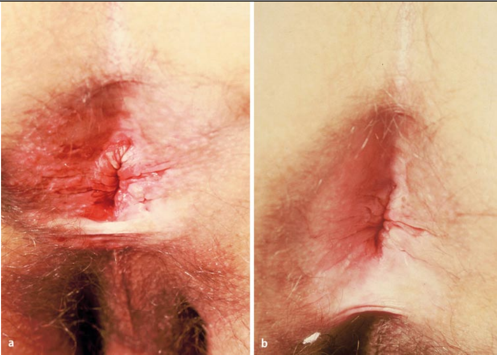
Abb. 3 ▲ a M. Bowen im Analbereich bei 65-jährigem Patienten. b 3 Monate nach Bestrahlung mit 10-mal 4 Gy, 20 kV, 0,3 mm Aluminiumfilter

ler Schonung der darunter liegenden Haut bei gleichzeitiger Tumorzerstörung. In der Weichstrahlen- und Oberflächentherapie ist zu beachten, dass in Knorpel oder Knochen infiltrierende Tumoren keine Indikation darstellen, deshalb ist bei fraglichen invasiven Tumoren vor einer Therapie eine MRI-Aufnahme angezeigt. Ebenfalls wird kein Tumor ohne entsprechende histopathologische Untersuchung bestrahlt. Die Histologie gibt nicht nur Auskunft über Art- und Ausdehnung des Tumors, sondern auch über evtl. spezielle histologische Untertypen, wie z. B. die sklerodermiformen bzw. szirrhösen Wachstumsformen. Letztere sind weniger strahlensensibel – wahrscheinlich bedingt durch die begleitende Fibrose – und zeigen oft eine erhöhte Rezidivneigung. Bei inoperablen Patienten bedeutet dies allerdings nicht unbedingt, dass auf eine Strahlentherapie verzichtet werden muss. Es sollten aber die Bestrahlungsparameter angepasst werden, d. h. zum Beispiel durch höhere Einzeldosen bzw. höhere Gesamtdosen oder durch Behandlung mit schnellen Elektronen. In der Regel können Basalzellkarzinome (Basaliome) bzw. spinozelluläre Karzinome (Spinaliome) oder Plattenepithelkarzinome gleich behandelt werden. Tendenziell neigt man bei Spinaliomen eher zu höheren Gesamtdosen (■ Abb. 1a, b , ■ Abb. 2a, b ). Das Therapieschema ist in ■ Tab. 2 dargestellt.