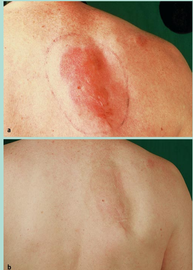
Abb. 5 ▲ a Isoliertes B-Zell-Lymphom am Rücken bei einem 57-jährigen Patienten. b 6 Monate nach Bestrahlung mit 7-mal 2 Gy, 50 kV, 2,0 mm Aluminiumfilter

– insbesondere zur Behandlung der Handflächen und Fußsohlen mit Grenz- bzw. Röntgenstrahlen. Infrage kommen natürlich auch schnelle Elektronen oder eine Teleröntgentherapie (► Ganzkörperbestrahlungen ).