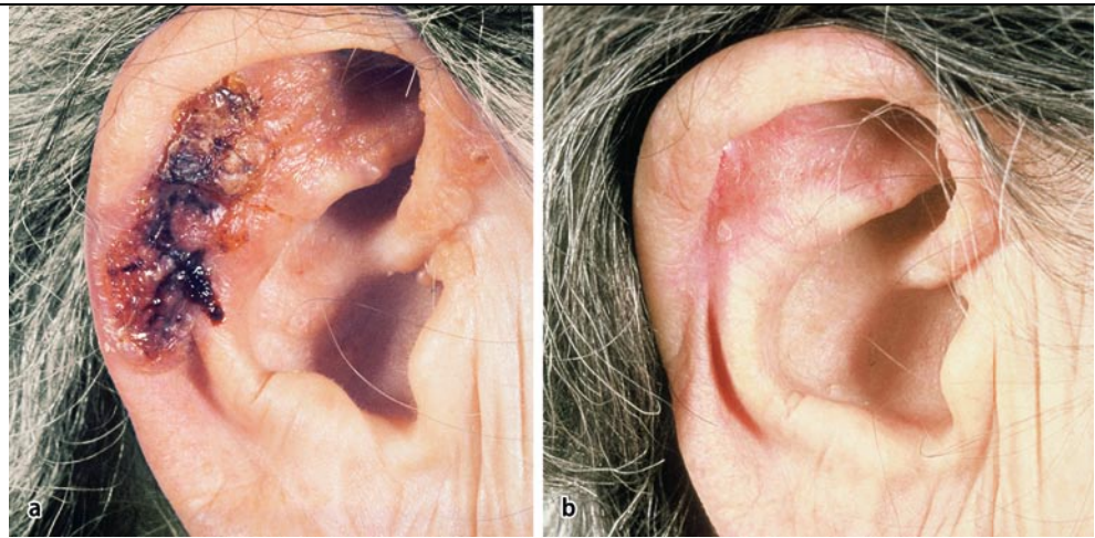
Abb. 1 ▲ a Basaliom der rechten Ohrmuschel vor Bestrahlung bei einer 71-jährigen Patientin. b 4 Monate nach Bestrahlung mit 12-mal 4 Gy, 30 kV, 0,5 Aluminiumfilter