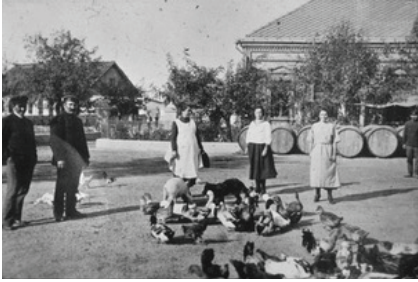
Рис. 2. Вид хозяйства винодела Адольфа Курца. Шабо. 1930-е гг.