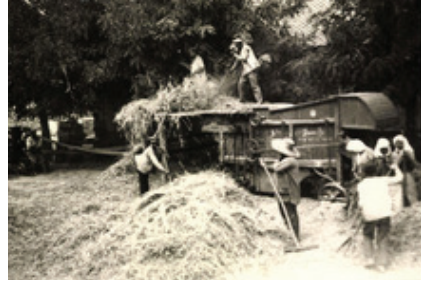
Рис. 3. Сушка сена. Хозяйство Рудольфа Штоллера. Шабо. 1930-е гг.

распространения французской культуры и поселенцы стали получать газеты на французском языке.