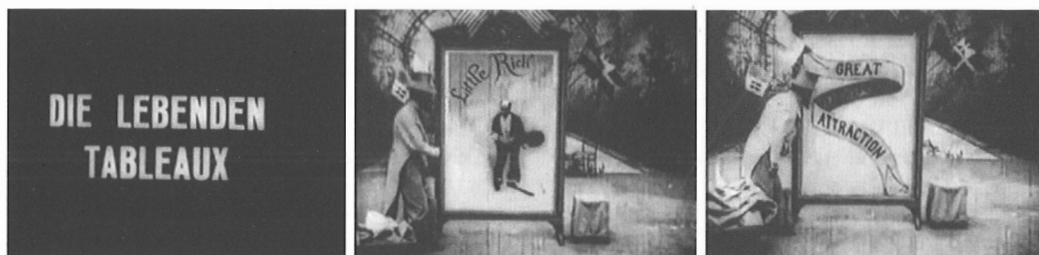
Fig. 1 – La Valise de Barnum (Pathé Frères, 1904)

Si ce carton lui donne la force inédite d'un étiquetage, la désignation n'est pas exceptionnelle : dans l'essor lexical qui accompagne l'apparition des vues filmées, le terme de « tableaux vivants » se révèle prégnant 4 . Pourtant, l'expression avait alors une autre acception. « Tableaux vivants » était le nom établi et courant d'un type de spectacle très en vogue à la Belle Époque, qui consistait à reconstituer sur scène des œuvres d'art célèbres à l'aide d'acteurs vivants. Les variantes en étaient innombrables. Sur les scènes foraines et populaires aussi bien qu'amateurs et mondaines, ces reconstitutions prenaient la forme très à la mode de spectacles autonomes, purs enchaînements plastiques de tableaux vivants immobiles, qui reprenaient leurs modèles aussi bien au répertoire pictural que sculptural, parfois même en inventant des compositions. Sur les scènes de théâtre et d'opéra, les tableaux vivants était également très prisés à titre de point culminant du drame, alliant à la suspension (plus ou moins furtive) de l'action la realization (suivant la théorisation de Martin Meisel 5 ) ou la mise en action (selon la terminologie d'époque 6 ) des derniers clous exposés au Salon. Mais quelle filiation établir entre ces tableaux vivants scéniques et les vues cinématographiques ? Comment comprendre ce glissement terminologique ? Quels liens relient les deux spectacles ?