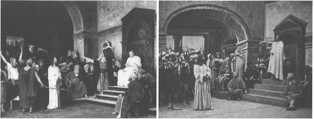
Fig. 2 – a. Mihály Munkácsy, Le Christ devant Pilate , 1881 b. Vie et Passion de Jésus-Christ (Pathé Frères, 1902)

en principe de mise en scène traversant toute la production. Il faut donc en traquer l'indice ou la thématisation, non dans les rubriques génériques, mais au niveau ponctuel des descriptifs et des titres de chaque film.