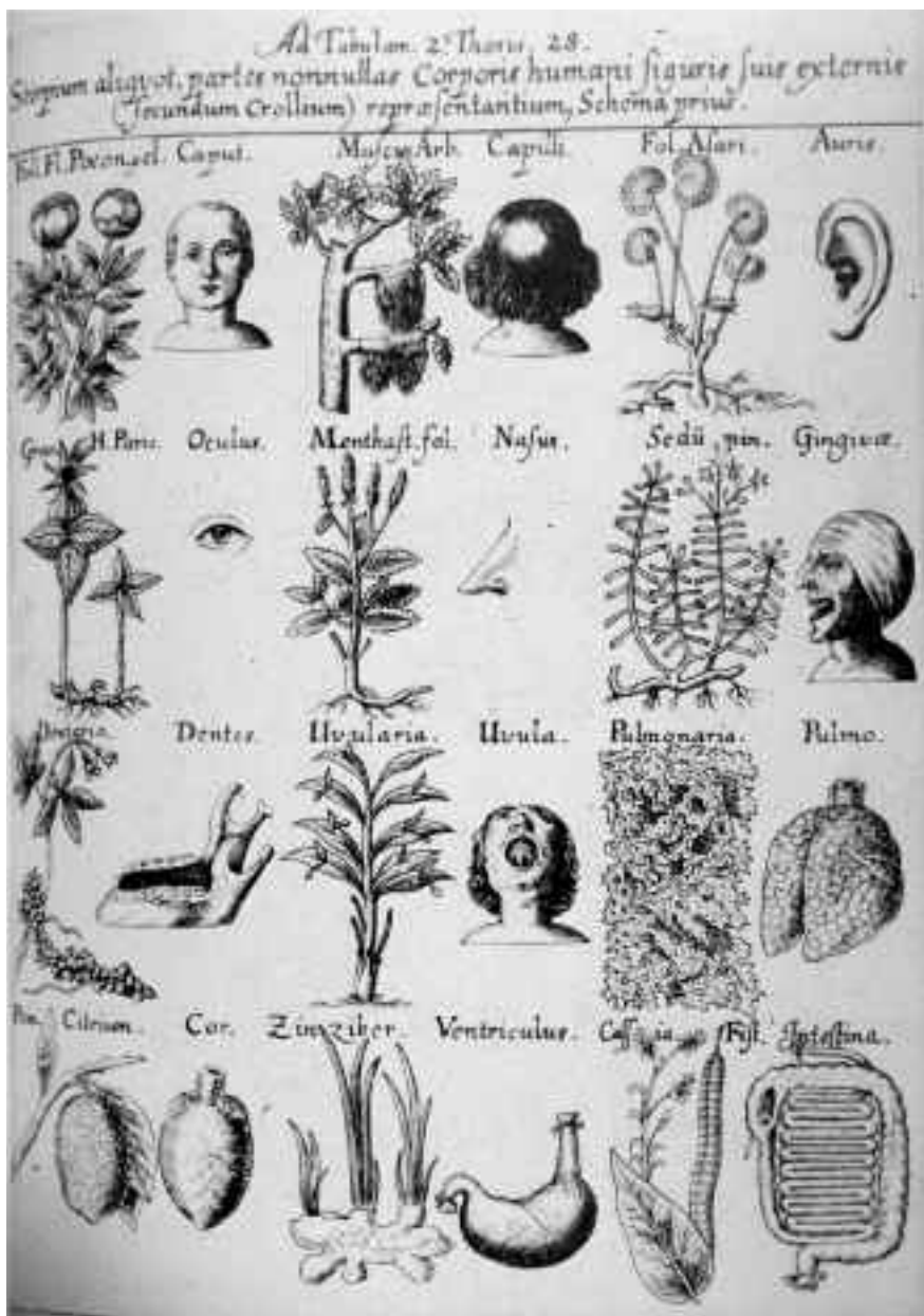
Fig. 3. W. A. Fabricius, Apophma Botanikon. De signaturis plantarum (1653).