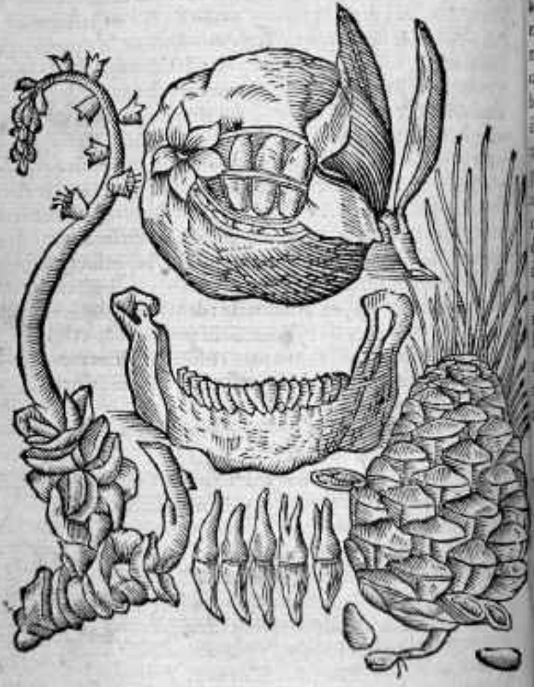
Fig. 2. Giovanni Battista Della Porta, Plantes exhibant la forme de dents, Phytonomica (1588).

EVVISOS à maxilla dentes tabellula oculis subiecta exprimit : à dextera è dentario speciem vnã designauimus, putantes ad dentium similitudinem efficiendam suffecturam : à sinistris pinem carum desquamatum, vt è suis loculis iacentes, & exempta pnydes, sine pineoli, & in medio mali yunici cortices & membranam dissectimus, vt acini eosdem simulantes in conspectum venirent.