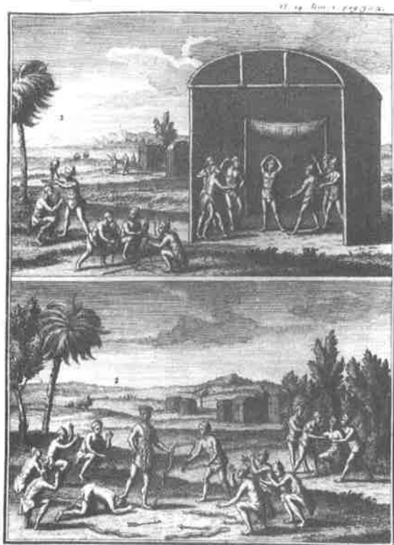
Fig. 1. Joseph-François LAFITAU, Mœurs des Sauvages américains... , planche 14, tome 1.