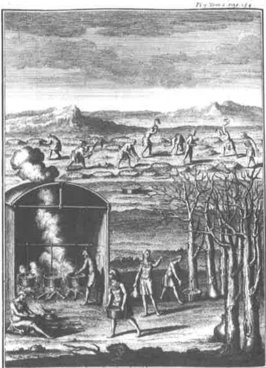
Fig. 8. Joseph-François LAFITAU, Mœurs des Sauvages américains... , planche 7, tome 2.