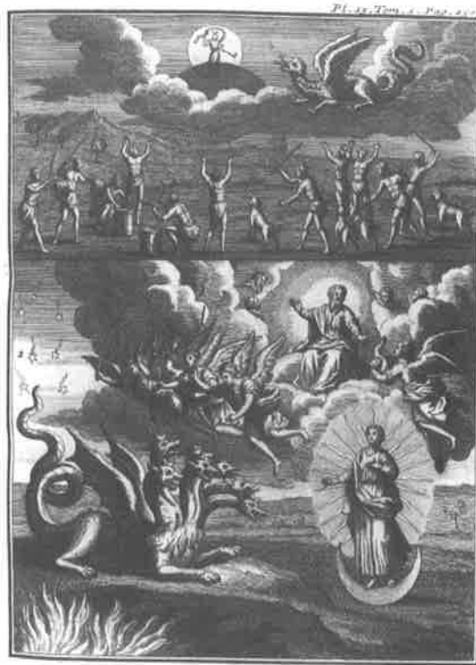
Fig. 2. Joseph-François LAFITAU, Mœurs des Sauvages américains... , planche 13, tome 1.