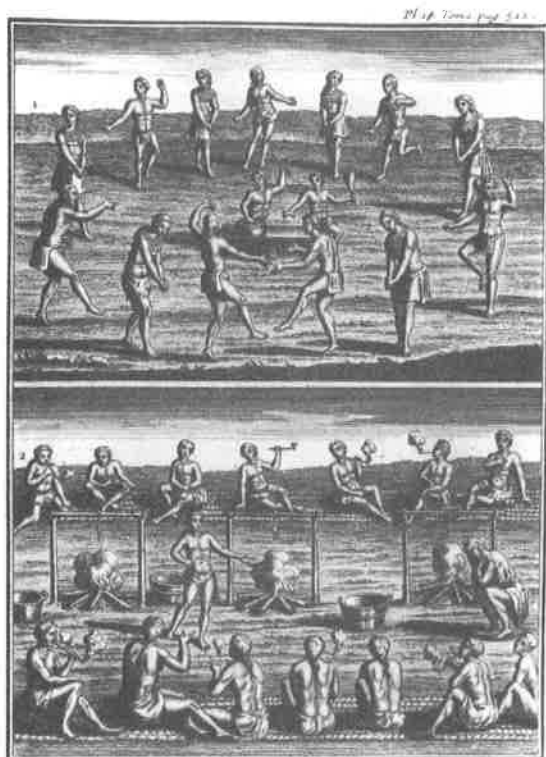
Fig. 3. Joseph-François LAFITAU, Mœurs des Sauvages américains... , planche 18, tome 1.