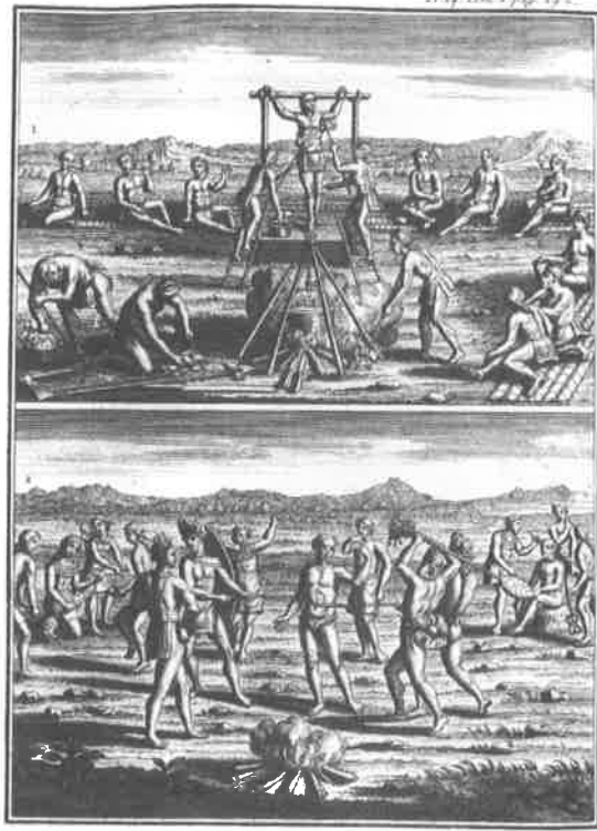
Fig. 6. Joseph-François LAFITAU, Mœurs des Sauvages américains... , planche 14, tome 2.