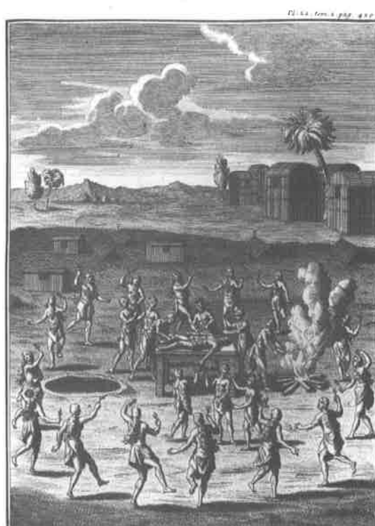
Fig. 4. Joseph-François LAFITAU, Mœurs des Sauvages américains... , planche 22, tome 2.