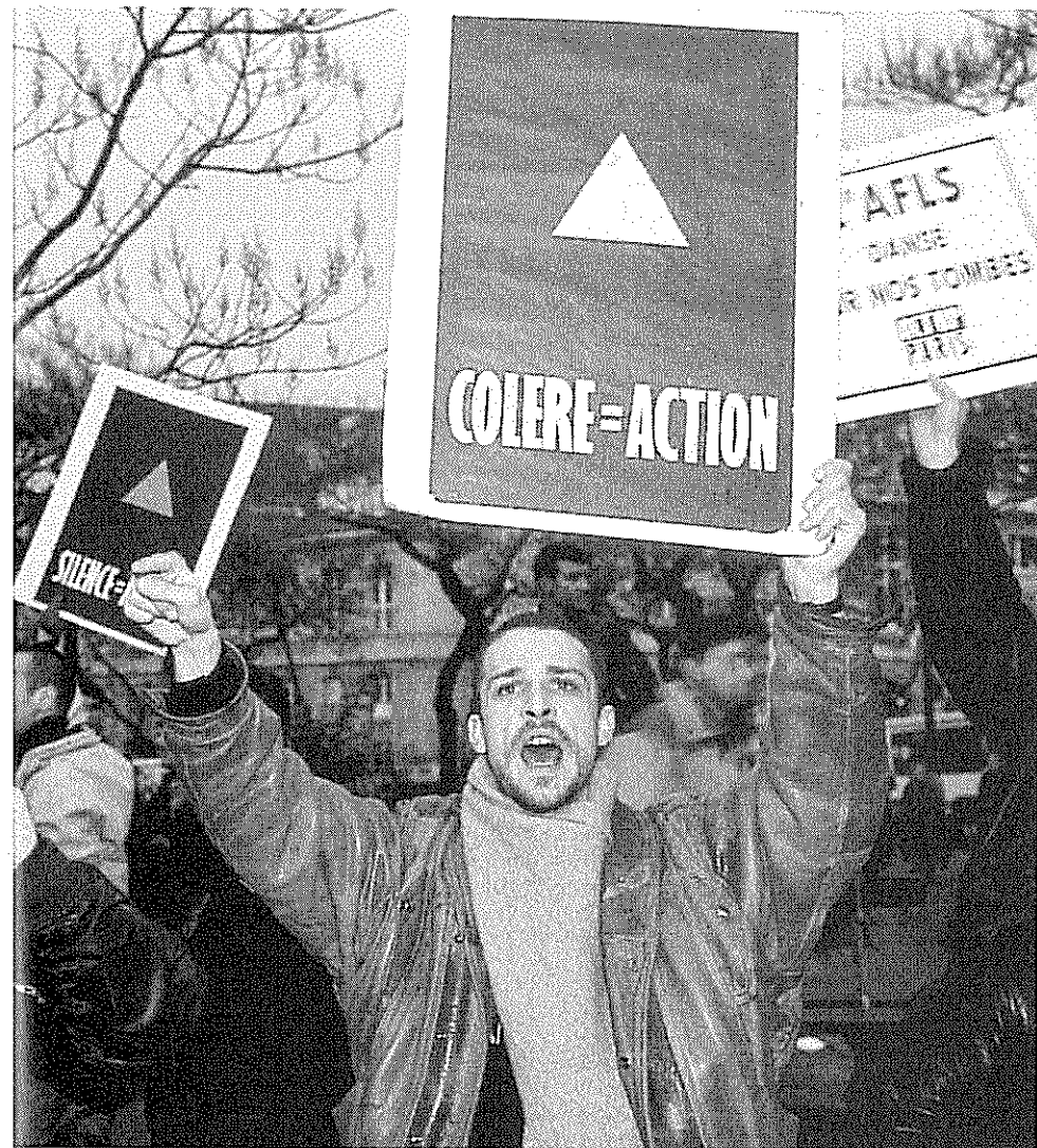
(AGF UK, 1993) FACULTY/SPA PHOTOS

preneurs de mouvement et les moyens d'assurer la coopération au sein d'un mouvement (par les interactions de face-à-face, par des techniques de communication, par le discours des organisations et par la propagande).