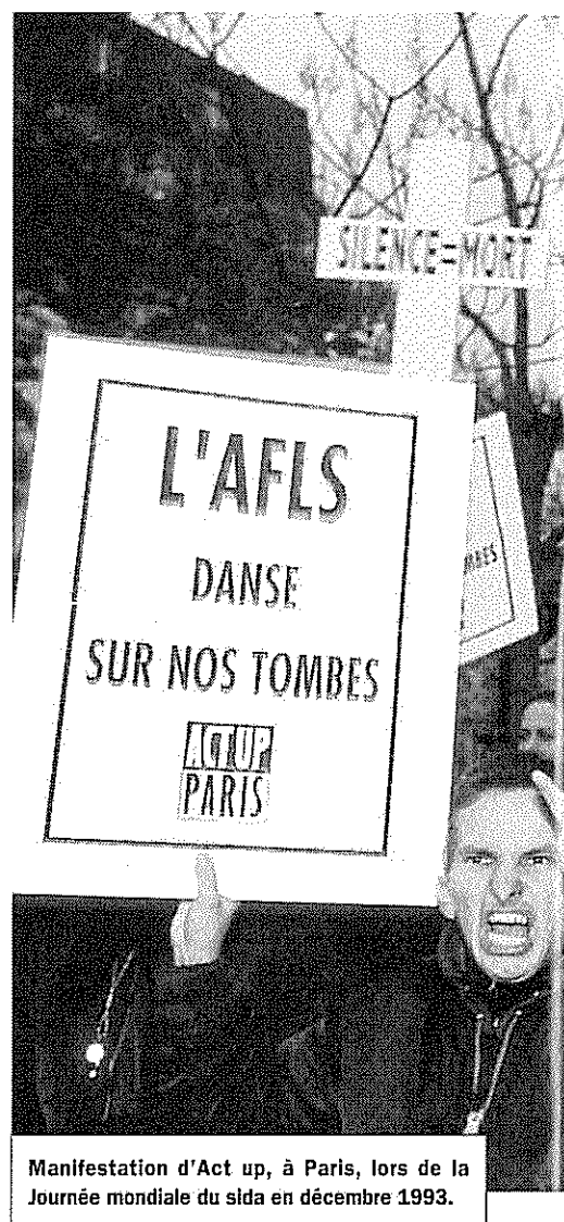
Manifestation d'Act up, à Paris, lors de la Journée mondiale du sida en décembre 1993.

J UIN 1936 : à la suite de la victoire du Front populaire, la France est paralysée par un mouvement de grèves sans précédent : 2 millions de salariés ont interrompu le travail tout en occupant les usines. Leurs revendications portent principalement sur le salaire et les conditions de travail. Août 1963 : 200 000 Américains entament une marche pacifique en faveur des droits civiques des Noirs. Octobre 1988 : les infirmiers déclenchent un mouvement ponctué de manifestations organisées aux quatre coins de l'Hexagone. Les manifestations prennent fin au cours de l'année 1993 avec la constitution d'un comité infirmier. D'ampleur et de durée inégales et porteurs de revendications de nature spécifique, ces trois mouvements s'inscrivent dans des contextes différents. Ils n'en suscitent pas moins la même interrogation chez le sociologue de la mobilisation, à savoir : selon quelle logique des individus en viennent à se réunir, puis à s'unir pour la défense d'un projet revendicatif commun ? Cette question centrale en recouvre en fait trois autres, correspondant chacune à un stade possible de l'analyse.