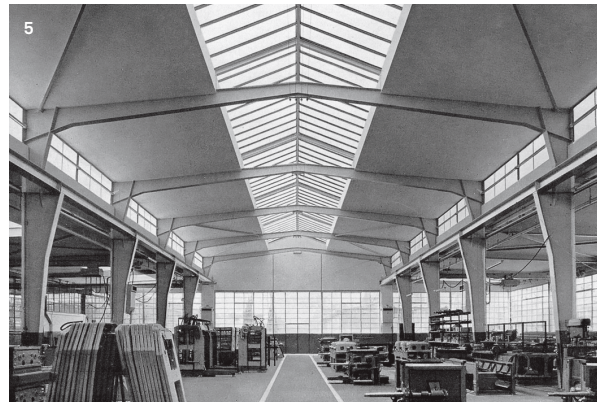
4-5 Usine Bobst, Prilly 6 Usine Kodak, Renens 7 Halle de façonnage Francillon, Crissier