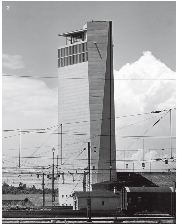
1 Usine de meubles DEM, Chavannes-près-Renens 2 Le silo, Renens 3 Les Imprimeries réunies, Renens